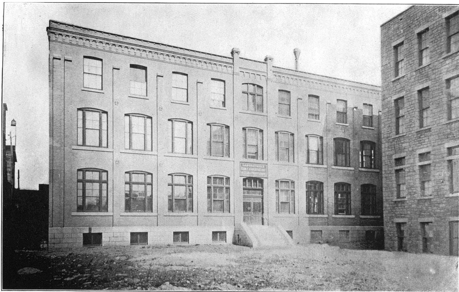
ÉCOLE POLYTECHNIQUE DE MONTRÉAL. — Façade de l'édifice des laboratoires.