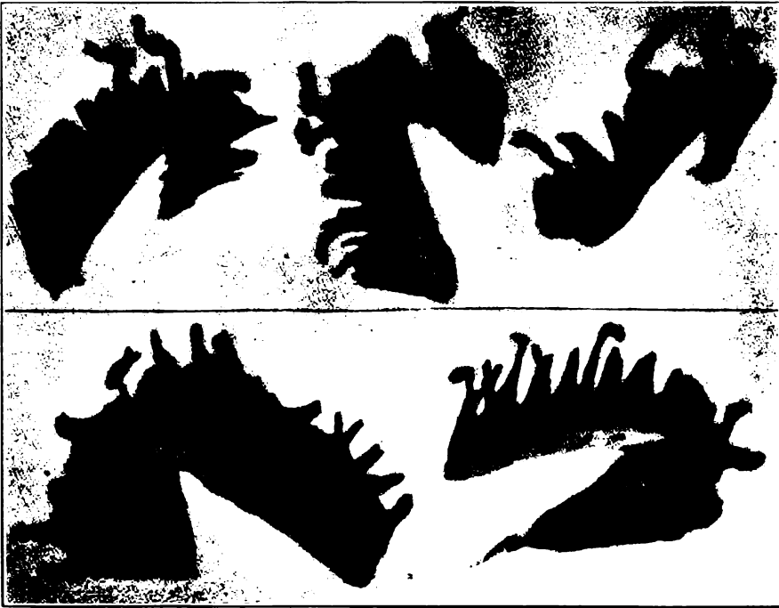
LERNAEOPODA EDWARDSII -- Le copépo­de parasite de la truite mou­chetée (SALVELINUS FONTINALIS) dans certains laes.