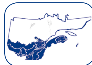
Territoires où les résultats s'appliquent.

Pour bien croître, la régénération préétablie ne nécessite que 50 % de pleine lumière. Pendant les périodes d'oppression, l'épinette rouge privilégie la croissance latérale au détriment de la croissance en hauteur. Cette stratégie lui permet de survivre en sous-bois jusqu'au prochain dégagement. La photosynthèse de l'épinette rouge est optimale sous une lumière faible à modérée et elle est souvent inhibée sous une lumière forte. Ce constat illustre bien la faible acclimatation de l'espèce aux variations brusques de l'intensité lumineuse.