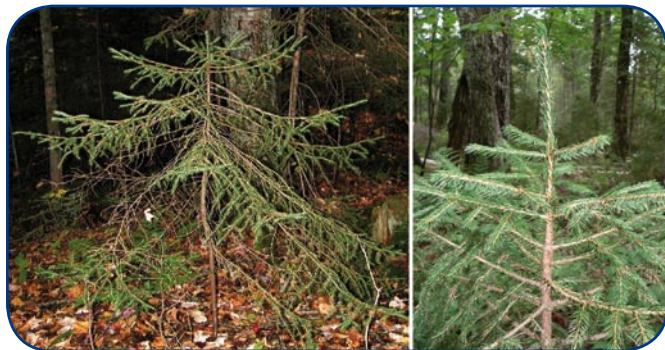
Régénération préétablie d'épinette rouge en situation d'oppression (gauche) et de croissance à la suite d'une coupe partielle (droite).

La physiologie de l'épinette rouge dépend fortement de la température de l'air et du sol, de même que de leur taux d'humidité. Bien qu'une température du sol de 20 à 30 °C soit bénéfique à la germination, des dommages importants aux semences surviennent à plus de 33 °C. Une telle température à la surface du sol est assez fréquente sur un parterre de coupe exposé. De plus, la photosynthèse des semis est maximale lorsque la température de l'air avoisine les 15 à 20 °C. Elle diminue à partir de 25 °C et est souvent inhibée au-delà des 30 °C,