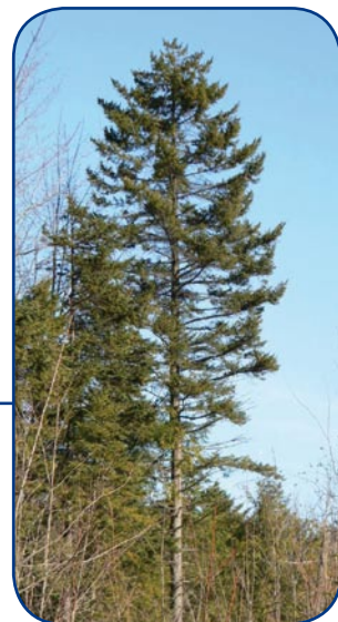
Épinette rouge à maturité.

L'épinette rouge peut atteindre 26 m de hauteur, 60 cm de diamètre et 400 ans ! Elle est présente en forêt feuillue, mais on la retrouve davantage en forêt mixte, notamment au sein des associations de bouleau jaune et de résineux (BjR). Elle est absente de la forêt boréale.