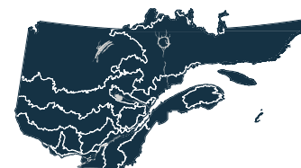
Territoires où les résultats s'appliquent.