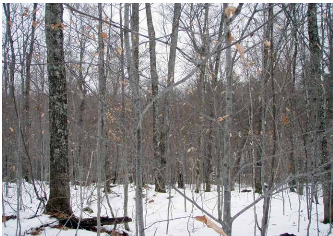
Photo 1. Érablière envahie par 3000 gaules de hêtre à l'hectare.

La réalisation d'un inventaire de la régénération est souhaitable afin d'obtenir une estimation précise et reproductible de son état. Nous recommandons d'évaluer le coefficient de distribution (CD) et la position des essences qui dominent la régénération à l'aide de placettes d'une superficie de 4 m 2 . Dans chacune des placettes, il faut noter la présence de l'essence dominante, soit la plus haute tige au sein de la strate de régénération. Nous recommandons également de noter la présence de la plus haute tige de chacune des autres essences selon une des catégories suivantes : a) gaule (diamètre à 1,3 m du sol de 1,1 à 9,0 cm); b) haut semis (hauteur > 1 m); c) moyen semis (hauteur de 31 à 100 cm); ou d) bas semis (hauteur < 31 cm). Le calcul des CD pour chacune des essences selon les 4 classes définies précédemment permettra de déterminer les problèmes sylvicoles et les solutions potentielles. Les hauts semis sont présumés bien établis, généralement visibles pour un débroussaillieur. Les bas semis sont présumés encore non établis, compte tenu de la forte probabilité de mortalité habituellement observée au cours des premières années de croissance. Les moyens semis sont dans une situation intermédiaire.