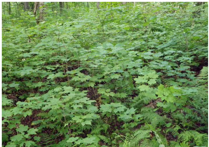
Photo 2. Abondante régénération naturelle de l'érable à sucre dans une érablière située au nord de l'aire de répartition du hêtre.