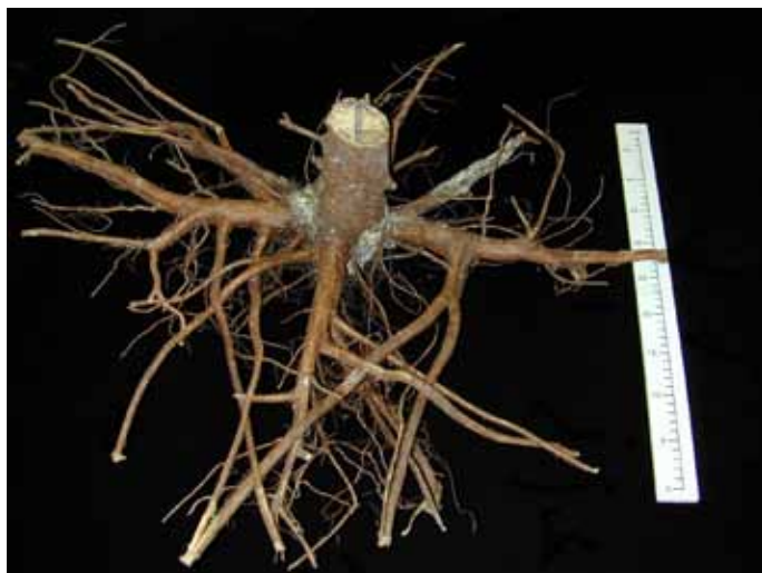
Figure 2. Système racinaire d'un PFD d'épinette noire produit en récipients et déterré pendant la septième saison de croissance depuis sa mise en terre, afin d'en évaluer l'architecture.

THIFFAULT, N., 2010. Stabilité mécanique et caractéristiques racinaires de plants de fortes dimensions de Picea mariana produits en récipients ou à racines nues . The Forestry Chronicle 86(4) : 469-476.