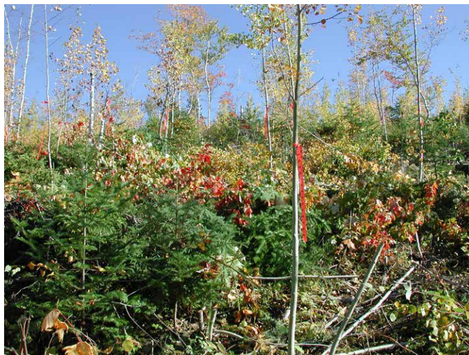
Photo 1. L'étude a été réalisée dans une tremblaie dense avec un sous-étage de sapin et d'épinette. L'éclaircie précommerciale a été appliquée en septembre 2004.

Dix ans après l'EPC, la moitié des tiges de tremble du traitement témoin étaient mortes en raison de la grande intolérance à l'ombre de l'espèce. Cependant, cette autoéclaircie n'a pas suffisamment modifié les conditions environnementales pour améliorer la croissance des conifères en sous-étage. Par exemple, la mortalité de l'épinette (noire et blanche regroupées pour les analyses) a atteint 24 % dans le traitement témoin,