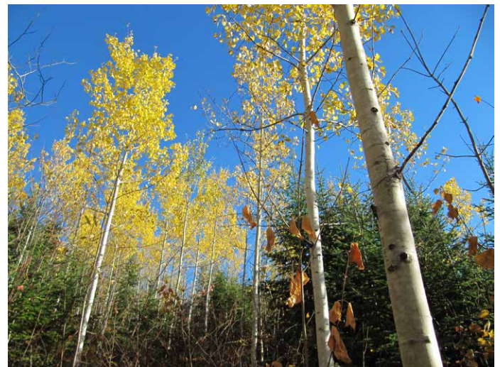
Photo 2. Aperçu d'un secteur éclairci et du partage de l'espace entre le tremble et les conifères en octobre 2010, 6 ans après le traitement.