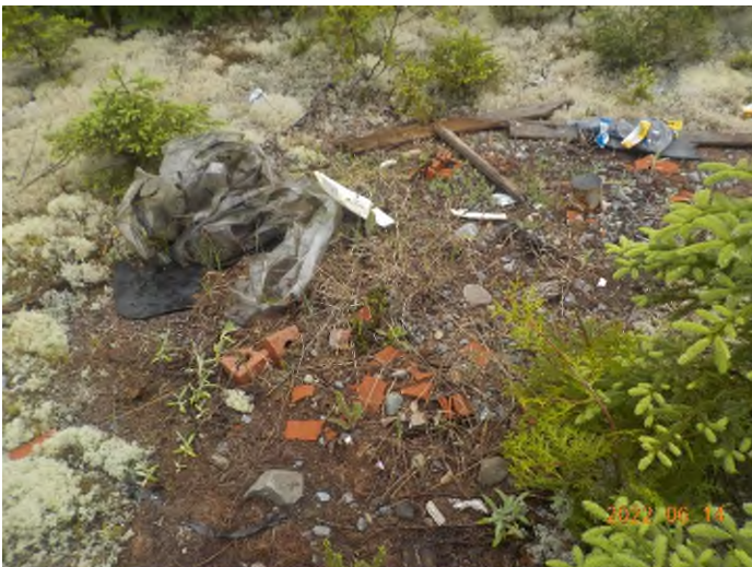
Figure 21: Débris à ramasser du point supplémentaire E