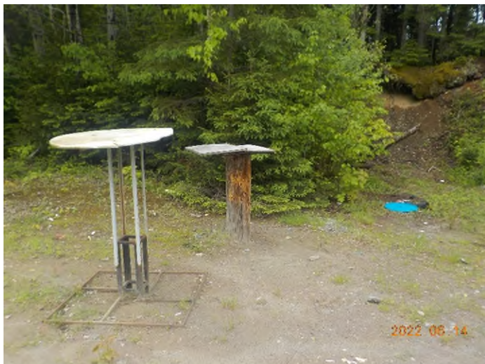
Figure 28: Débris à ramasser au point supplémentaire D