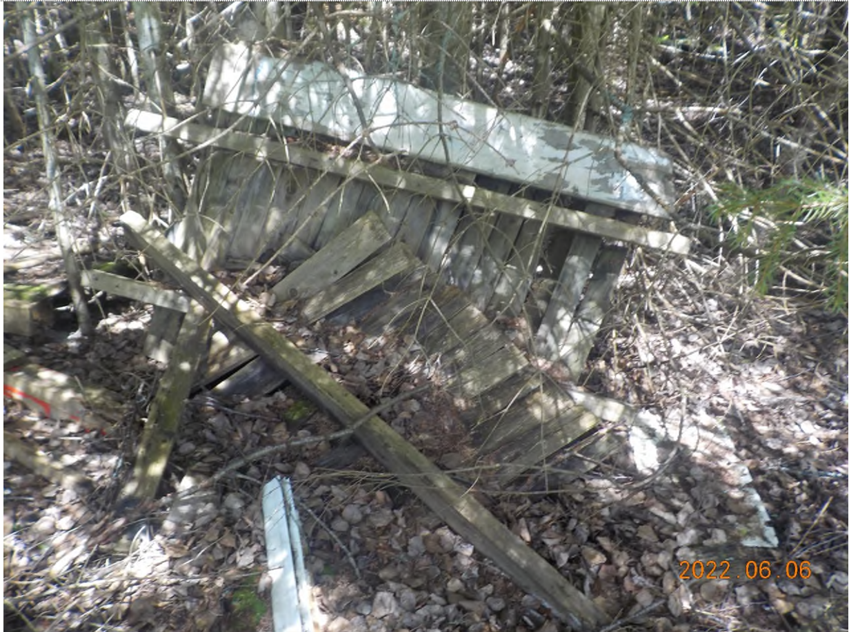
Figure 23: Débris à ramasser au point supplémentaire B (ancienne cache)