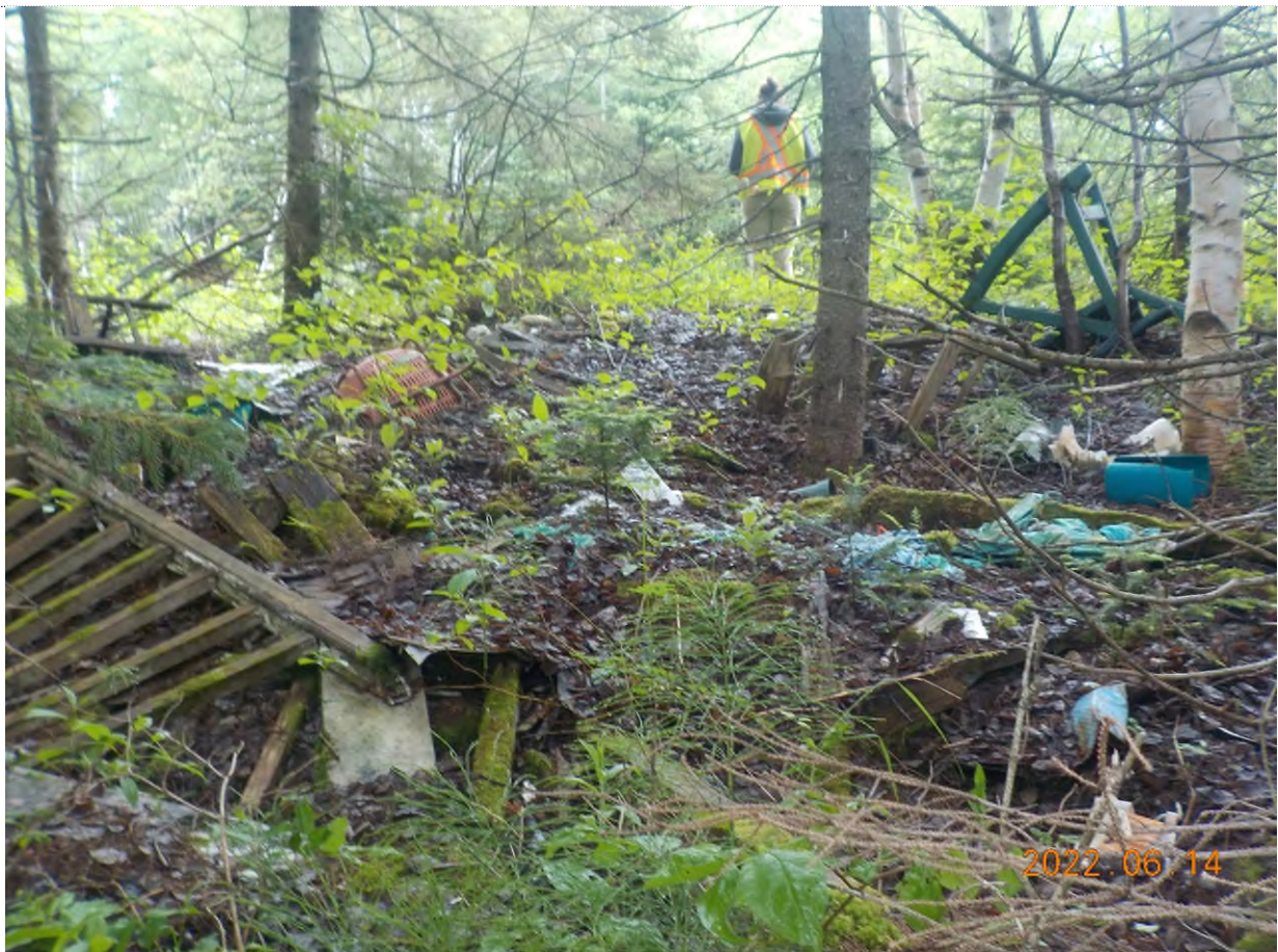
Figure 2: Débris à ramasser