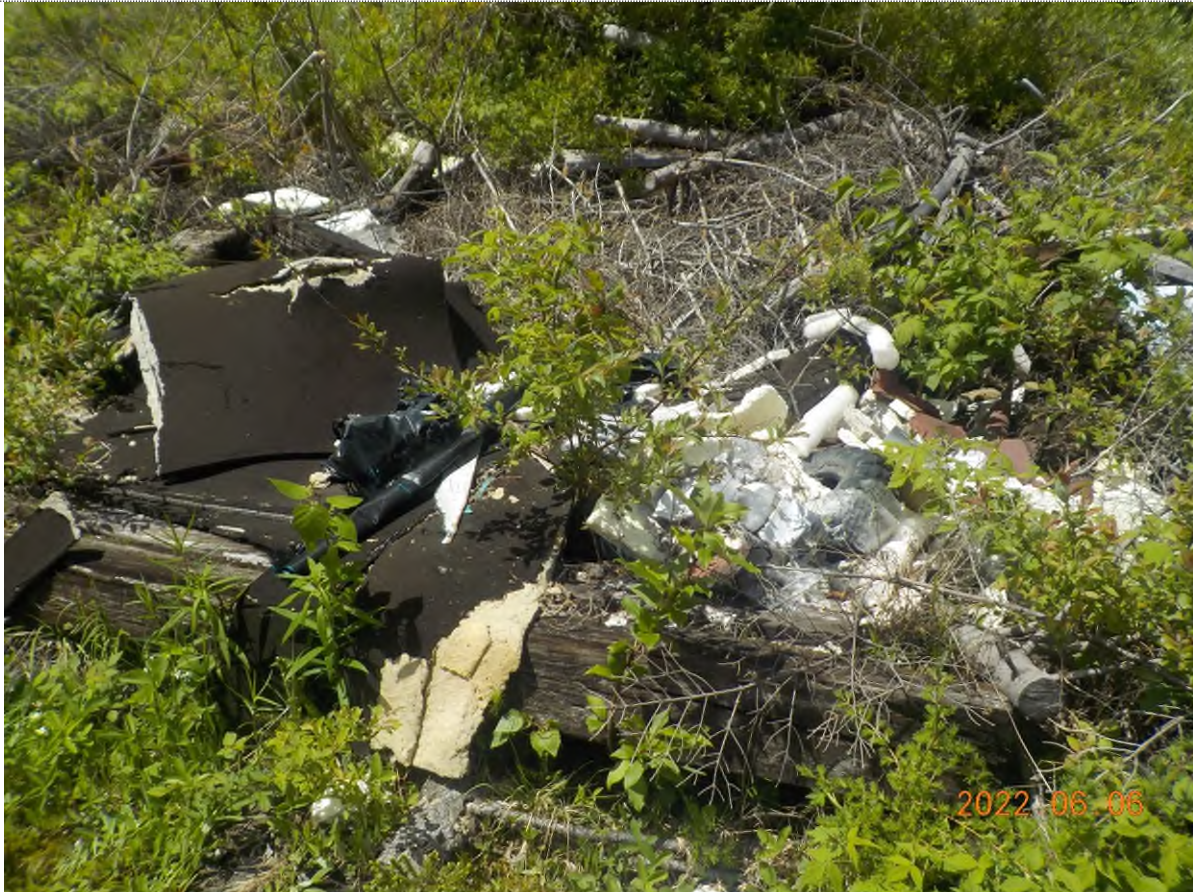
Figure 5: Débris à ramasser