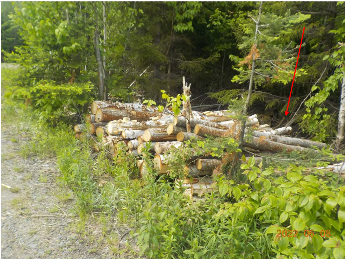
Figure 20: Vue du site point suppl. E