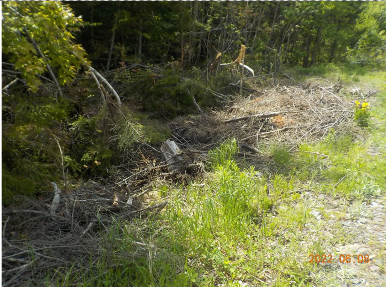
Figure 37: Débris à ramasser au point supplémentaire L (couper et étendre) -possible débris dessous