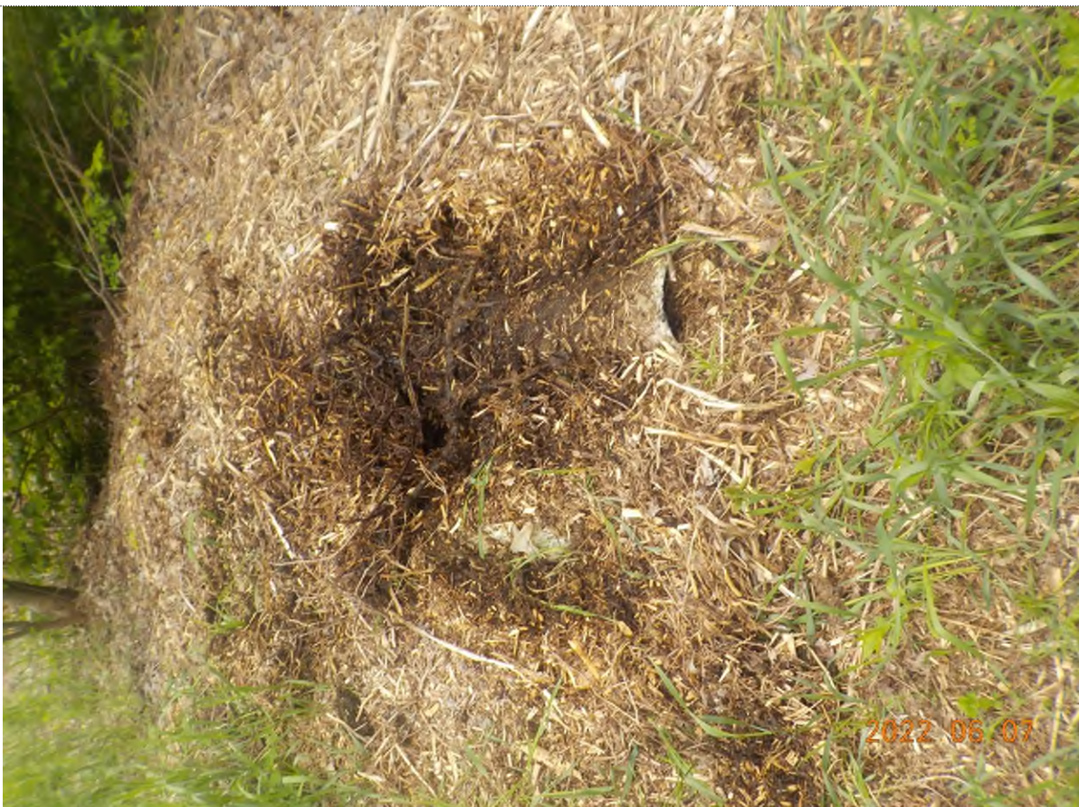
Figure 42: Ponceaux de béton enfouis sous tas de copeaux de bois