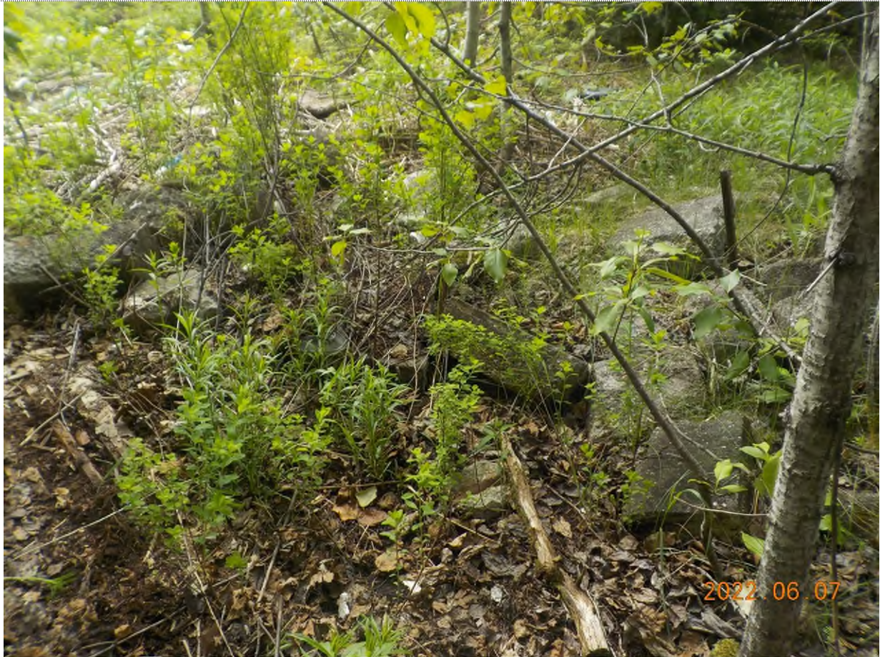
Figure 11: Blocs de béton à ramasser sur le site principal