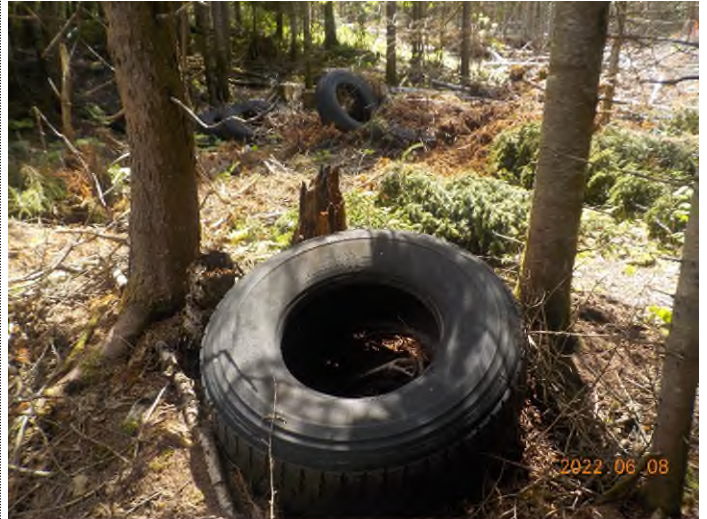
Figure 33: Débris à ramasser aux points supplémentaires J et K