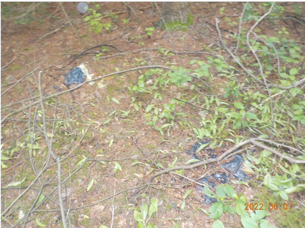
Figure 12: Déchets à ramasser dans le boisé (enfouis sous matière végétale) – pts suppl. A