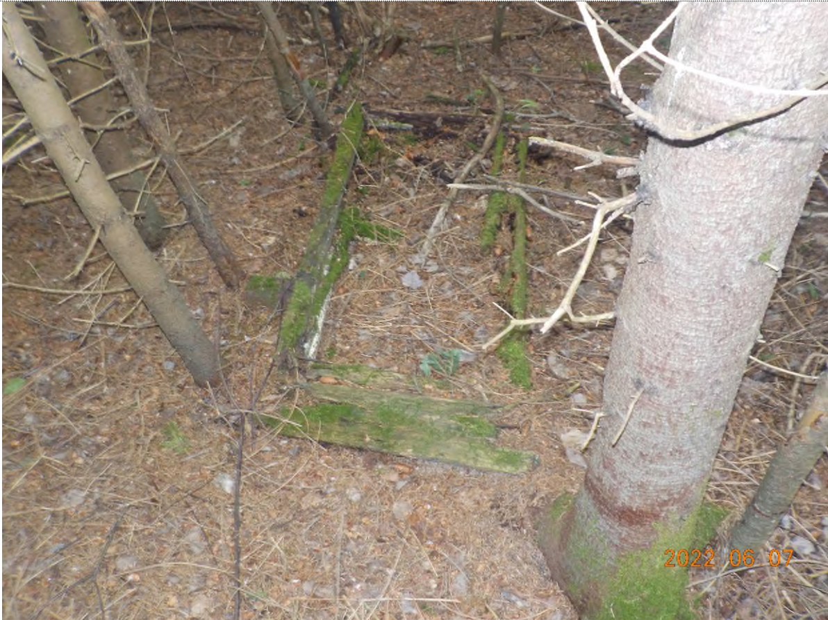
Figure 13: Déchets à ramasser dans le boisé (pts suppl.A)