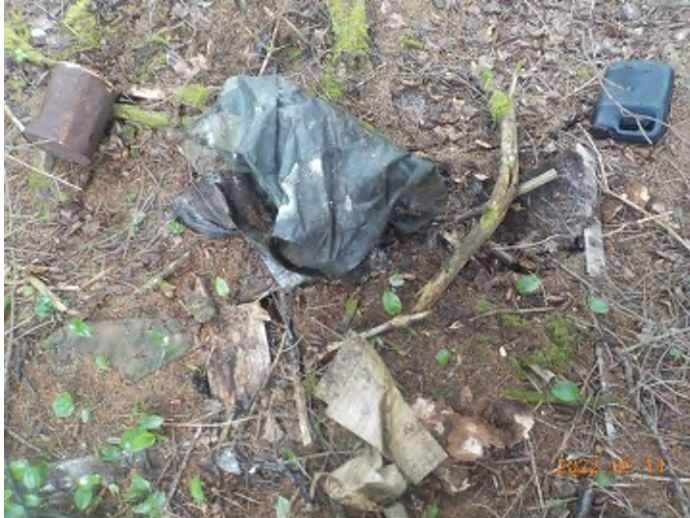
Figure 35: Débris à ramasser du point supplémentaire I