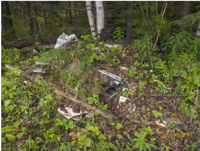
Figure 13: Débris à ramasser