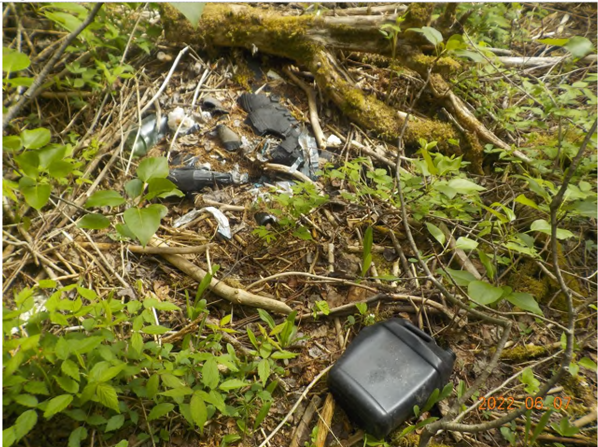
Figure 5: Débris à ramasser sur le site principal