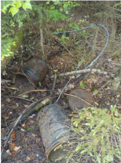
Figure 26: Débris à ramasser au point supplémentaire C