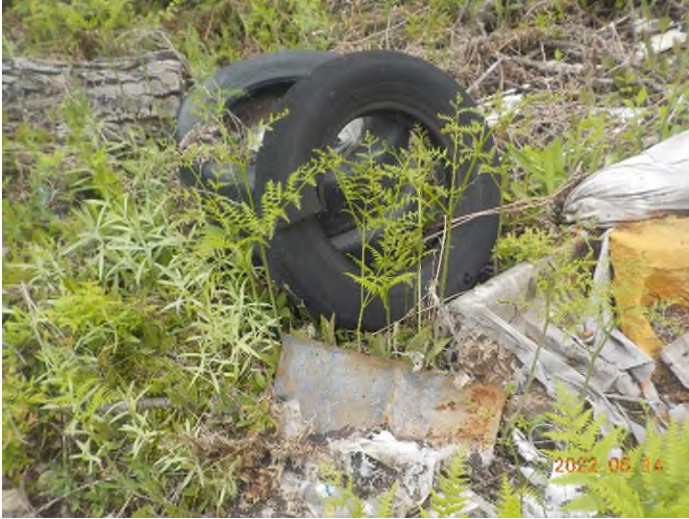
Figure 3: Débris à ramasser