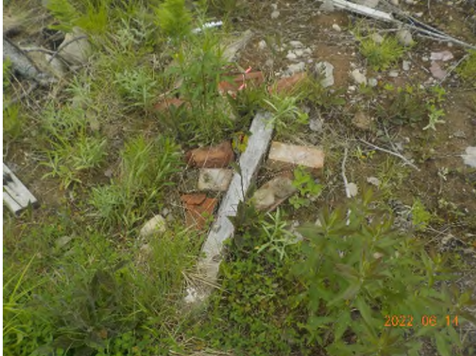
Figure 7: Débris à ramasser