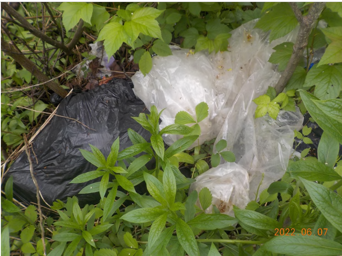
Figure 32: Déchets à ramasser (pts suppl. C)