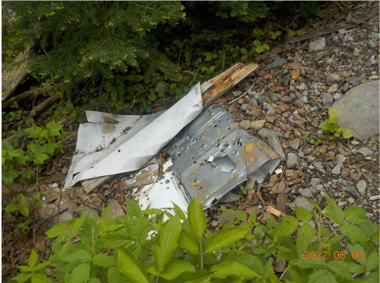
Figure 3: Débris à ramasser du point supplémentaire A