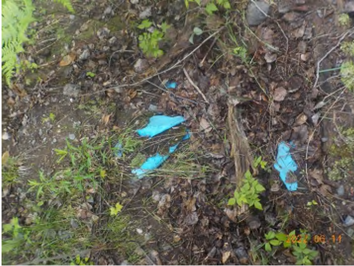
Figure 96: Débris à ramasser au point supplémentaire H