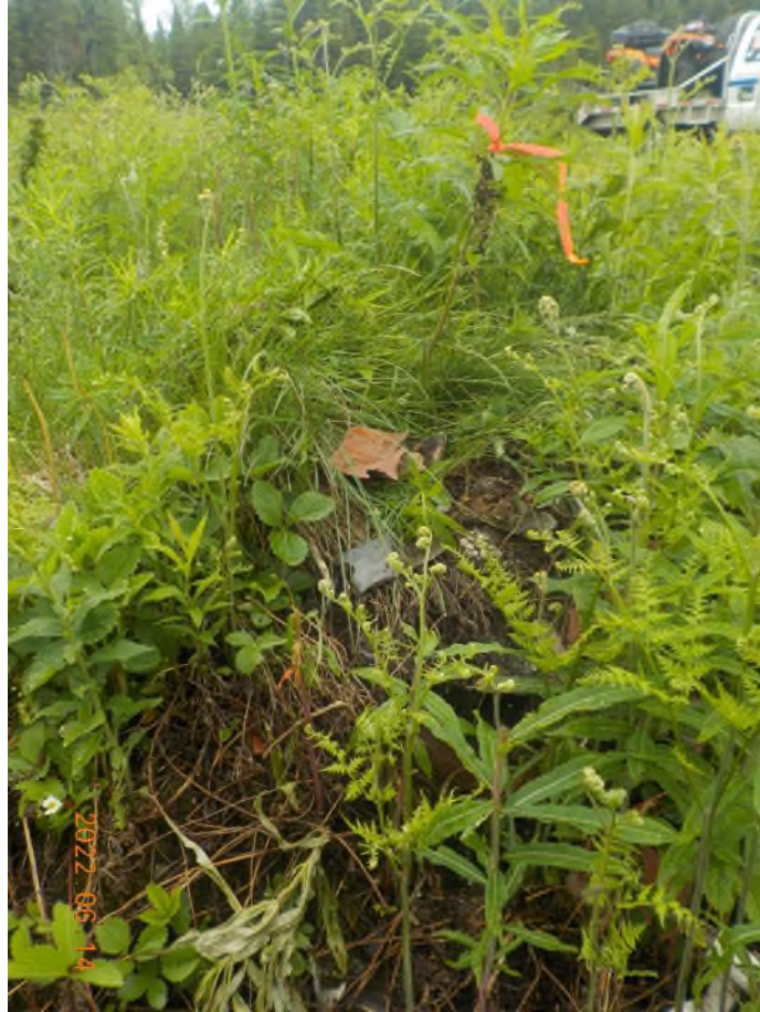
Figure 15: Débris enfouis dans le talus sous matière végétale