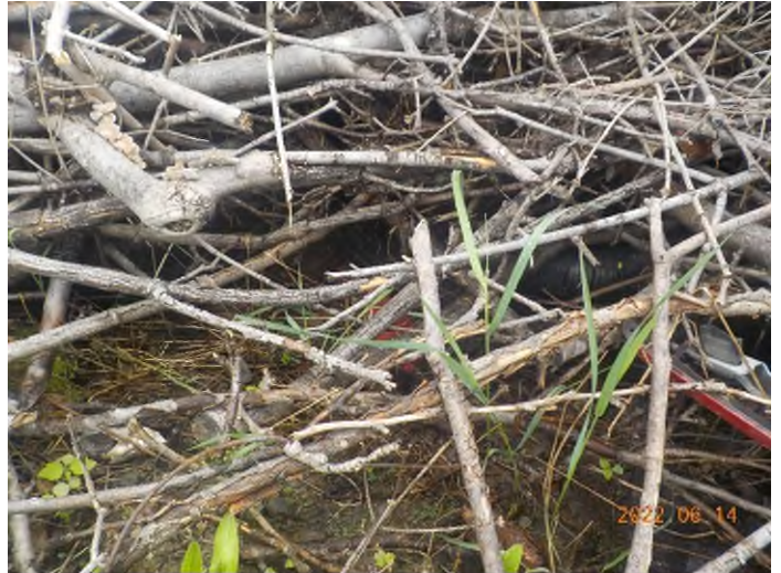
Figure 20: Débris à ramasser au point supplémentaire B