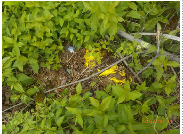
Figure 6: Débris à ramasser