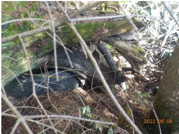
Figure 15: Débris à ramasser au point suppl. C