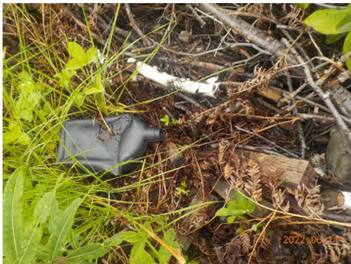
Figure 13: Débris à ramasser