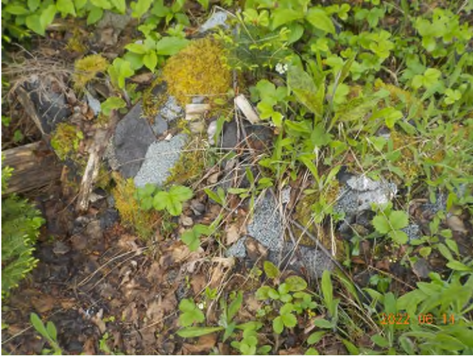
Figure 3: Débris à ramasser