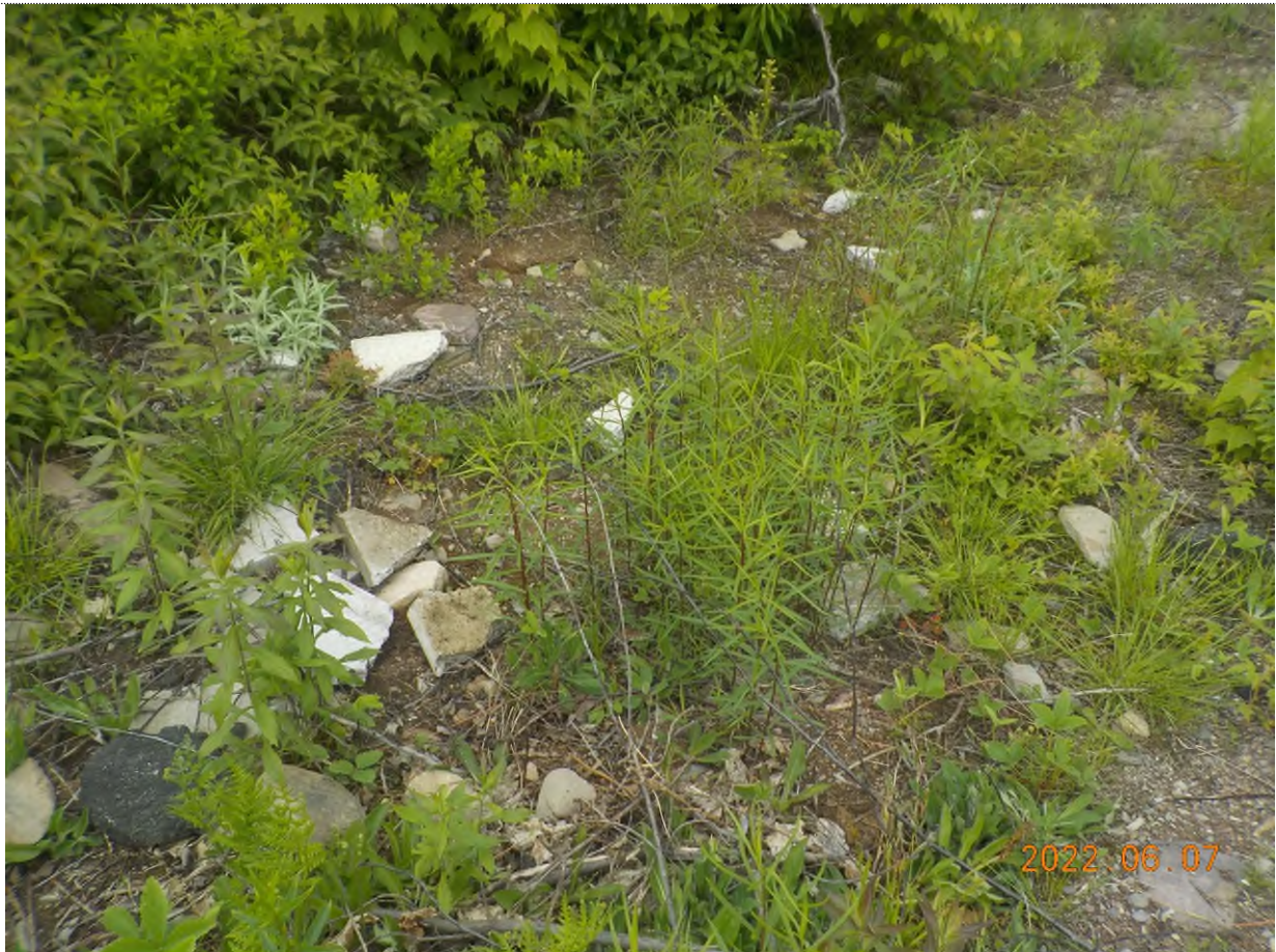
Figure 3: Déchet à ramasser (débris de béton et asphalte)