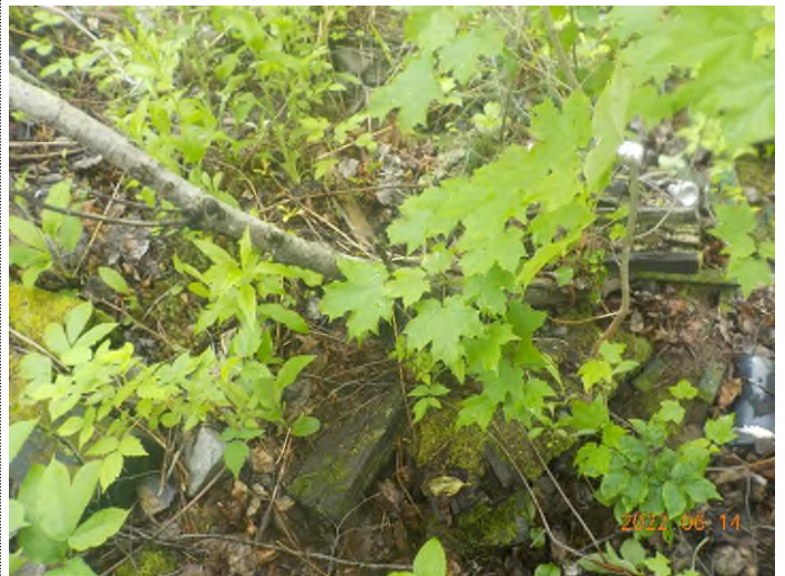
Figure 48: Débris à ramasser au point supplémentaire H