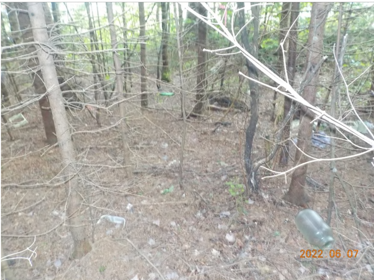
Figure 20: Vue des déchets à ramasser (pts suppl.B)