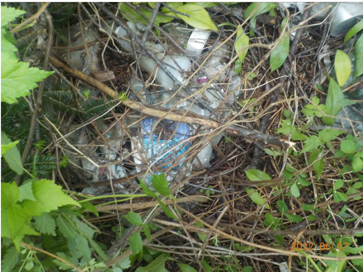
Figure 24: Déchets à ramasser sous les branches et matière végétale (pts suppl.C)