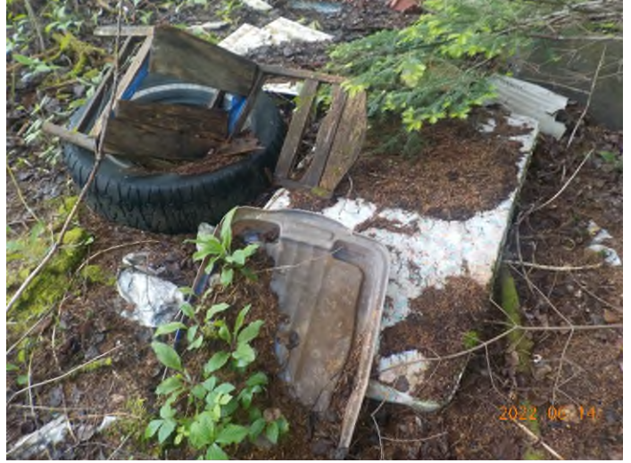
Figure 4: Débris à ramasser