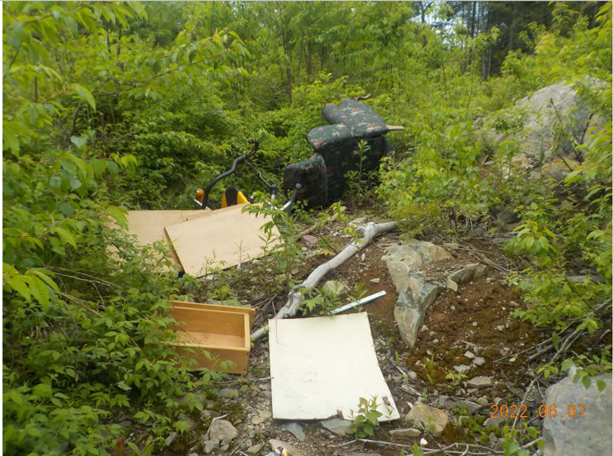
Figure 3: Débris à ramasser au point supplémentaire A