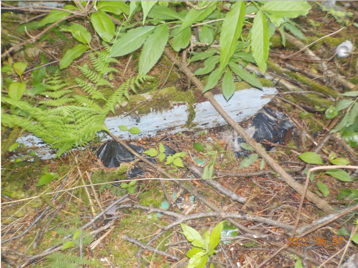
Figure 27: Déchets à ramasser sous matière végétale (pts suppl. C)