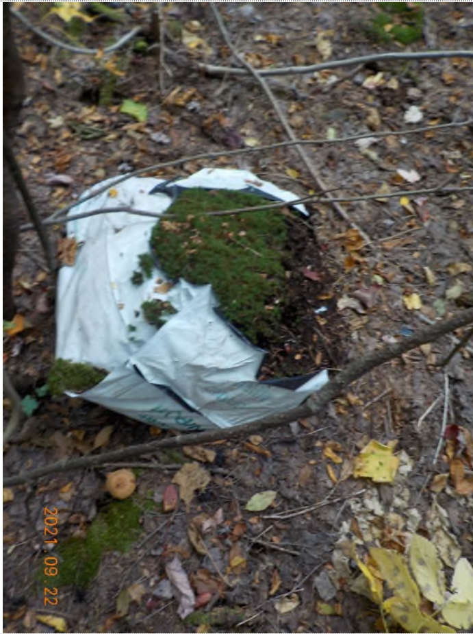
Figure 28: Débris à ramasser au point suppl. I