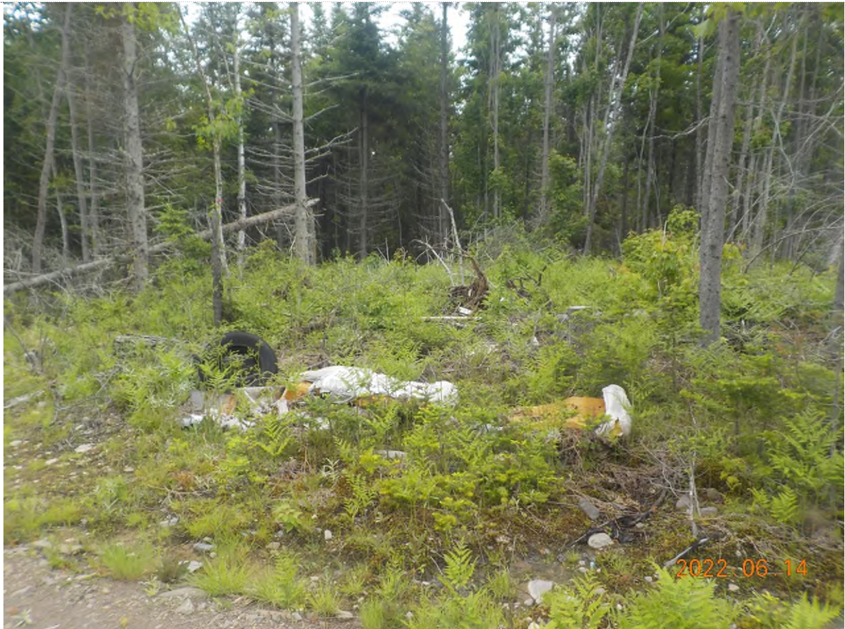
Figure 2: Emplacement des débris à ramasser