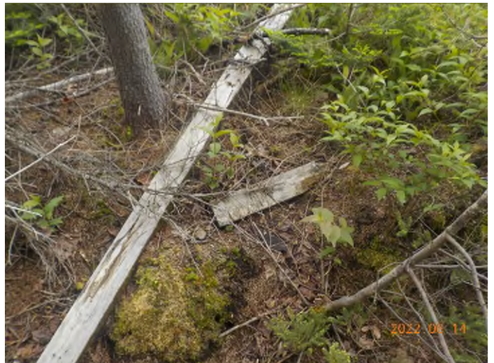
Figure 10: Débris à ramasser au point supplémentaire A