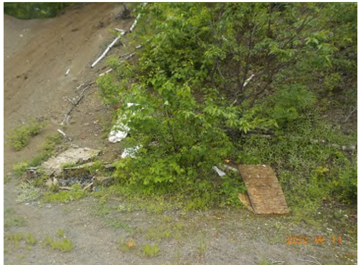
Figure 37: Débris à ramasser au point supplémentaire F