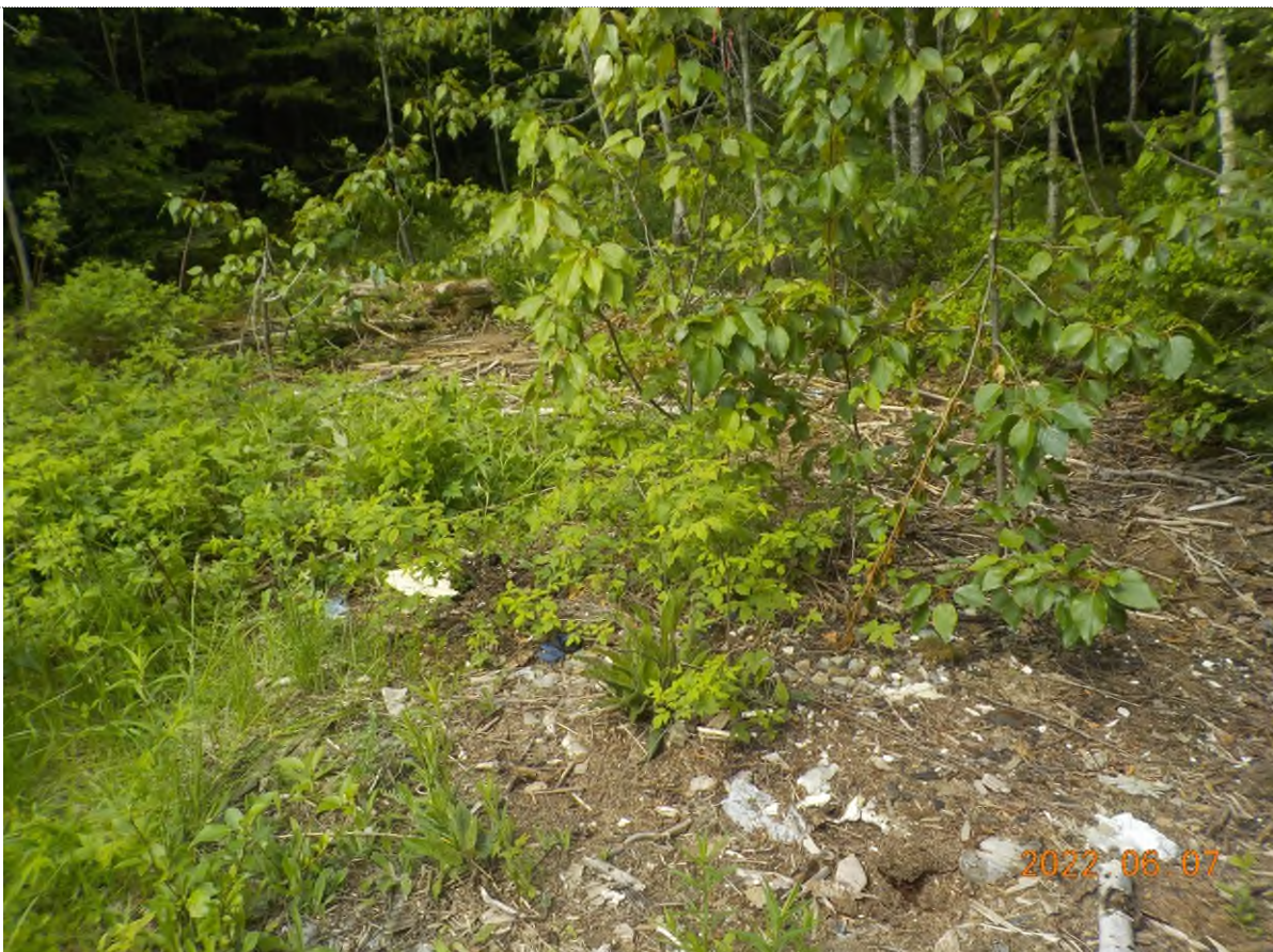
Figure 2: Vue du site à ramasser (débris compacté sous la matière végétale)