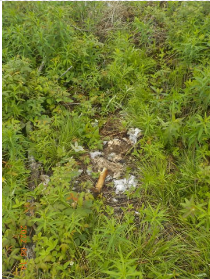
Figure 9: Débris à ramasser (enfouis dans le sol))