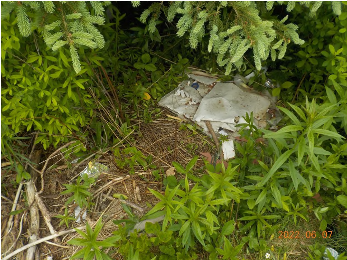
Figure 3: Déchets à ramasser sous les branches