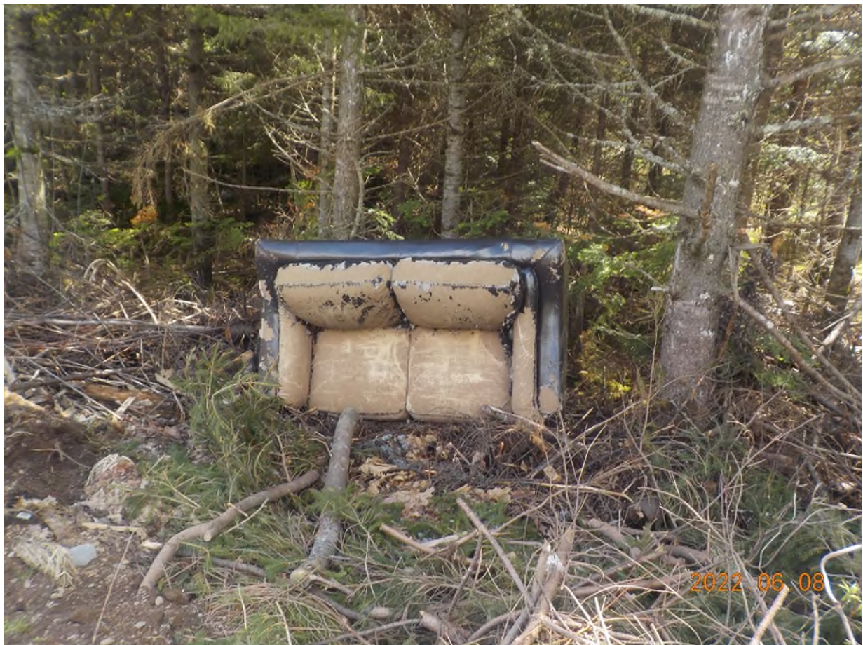
Figure 38: Débris à ramasser au point supplémentaire M