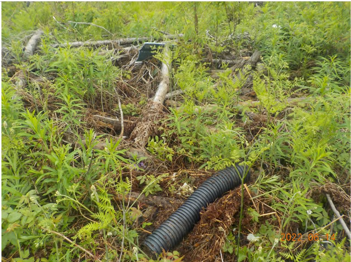
Figure 11: Débris à ramasser (certains débris sous le bois, branches et matière végétale)