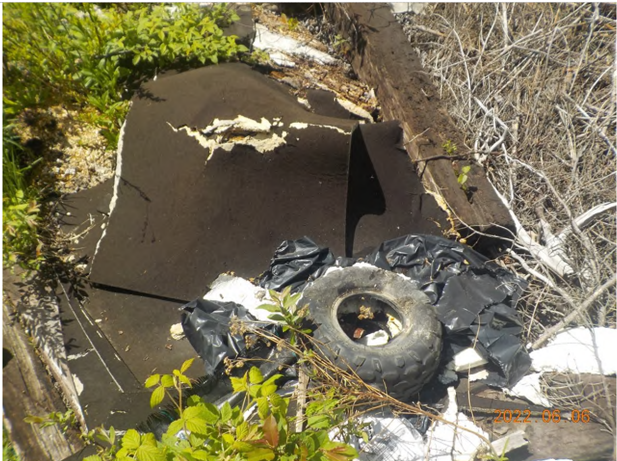
Figure 18: Débris à ramasser