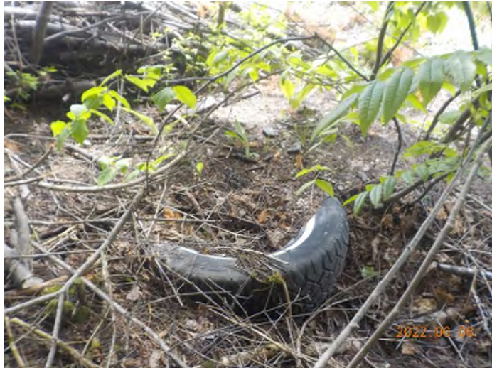
Figure 13: Débris à ramasser au point suppl. C