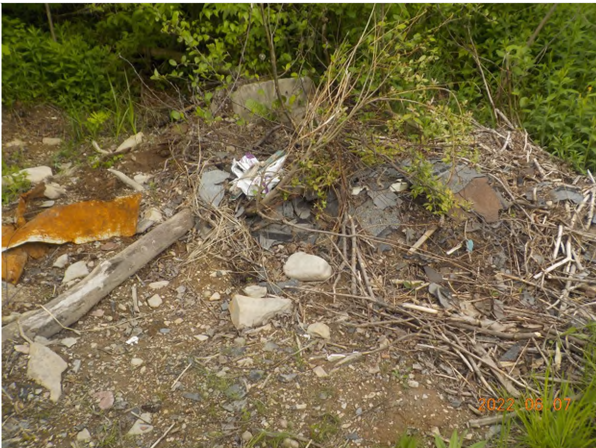
Figure 2: Site à ramasser