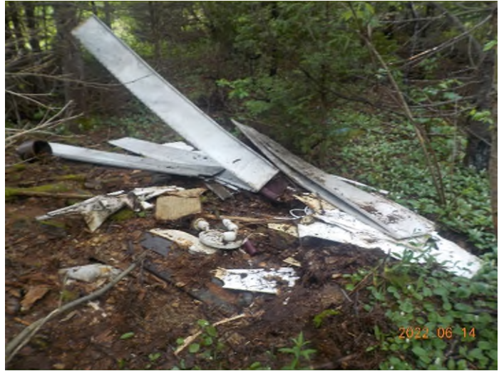
Figure 36: Débris à ramasser du point supplémentaire I