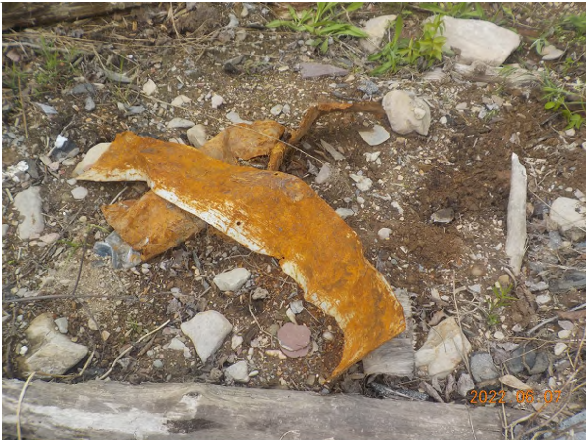
Figure 3: Vue des débris à ramasser