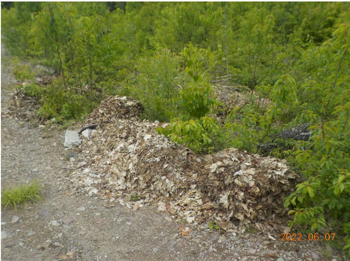
Figure 4: Matière végétale à ramasser