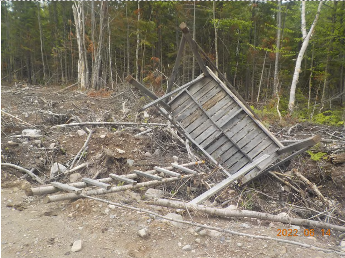
Figure 1: Structure écrasée à ramasser