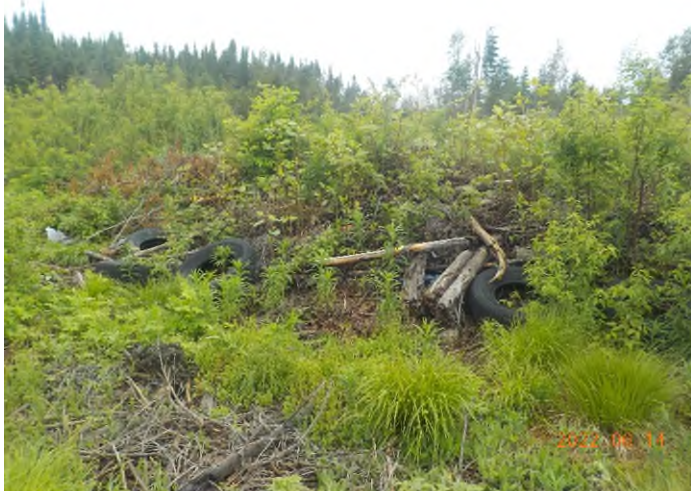
Figure 7: Débris à ramasser (exemple de talus à excaver)