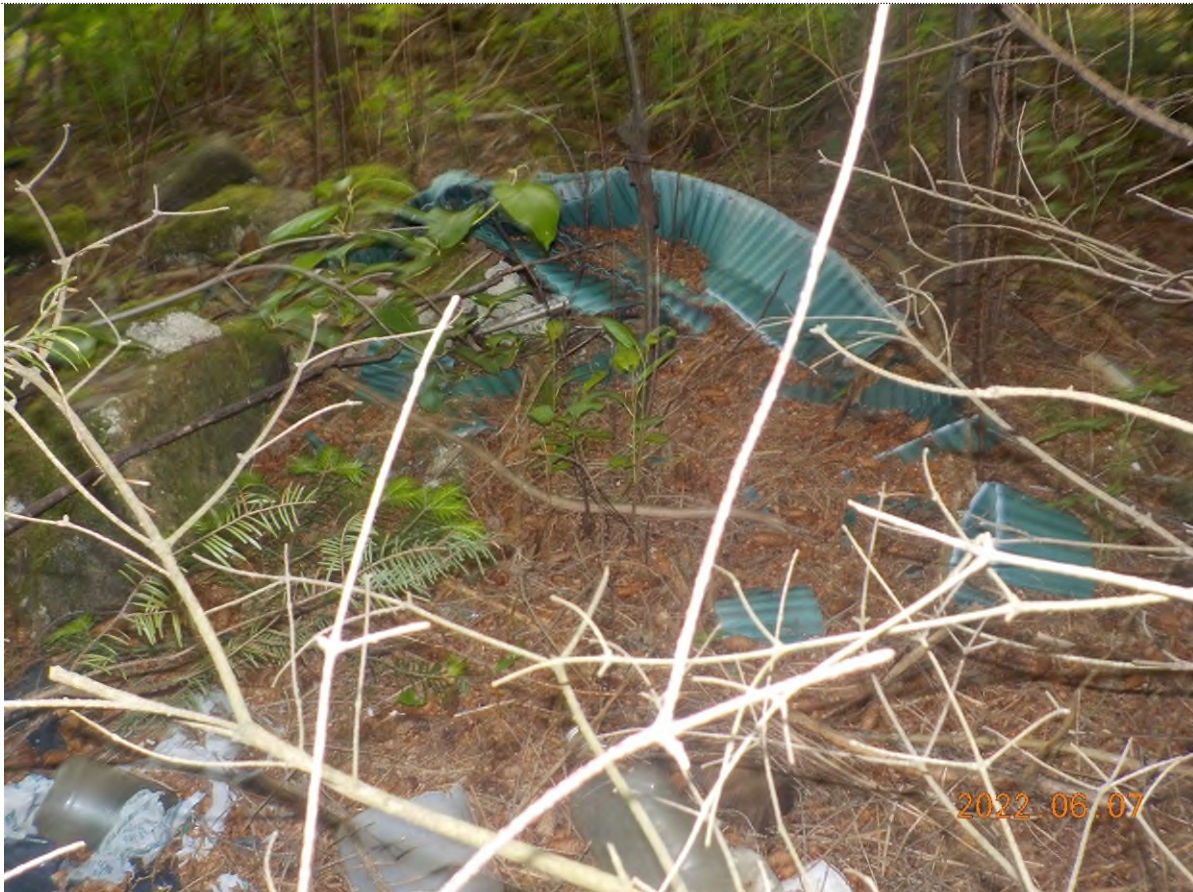
Figure 29: Déchets à ramasser sous matière végétale (pts suppl. C)