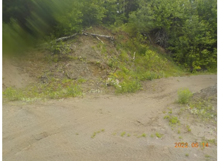
Figure 43: Emplacement des débris à ramasser au point supplémentaire G