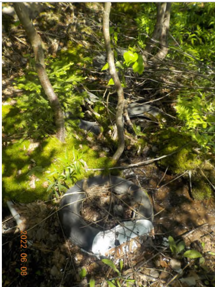
Figure 5: Débris à ramasser aux points suppl. A-B