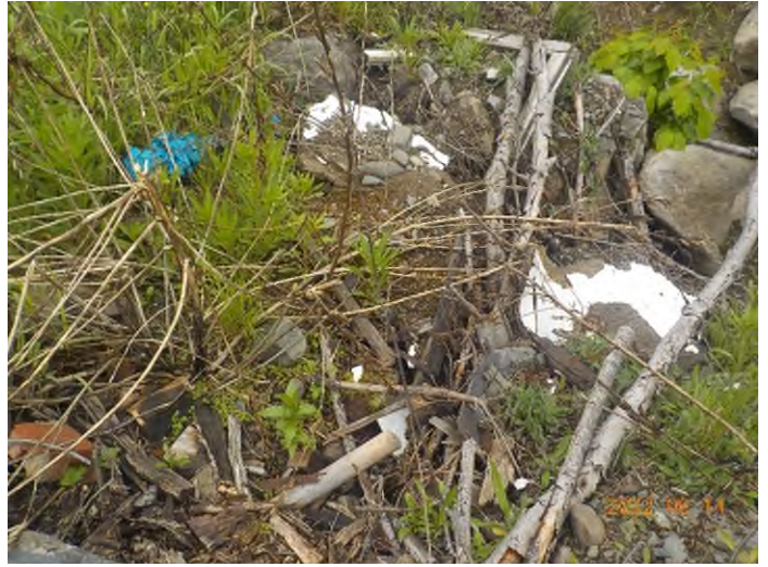
Figure 24: Débris à ramasser au point supplémentaire B