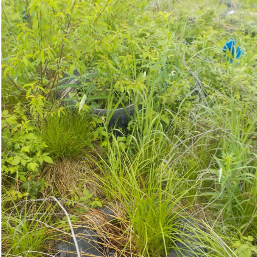
Figure 1: Débris à ramasser