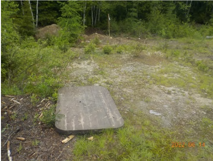
Figure 7: Débris à ramasser du point supplémentaire A