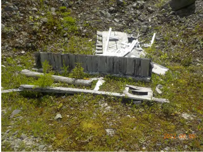
Figure 9: Débris à ramasser