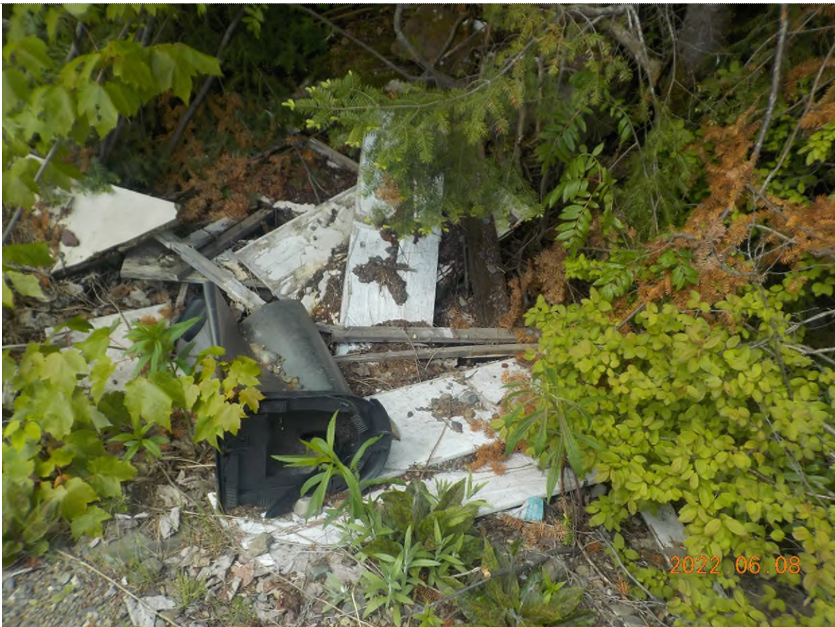
Figure 18: Vue du site point suppl. D