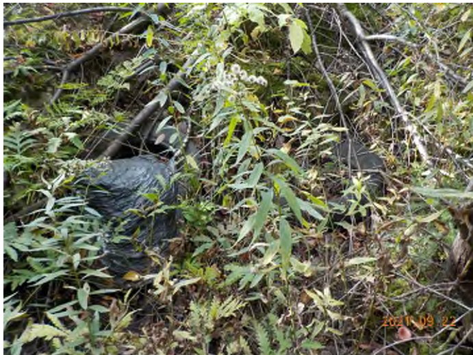
Figure 9: Débris à ramasser aux points suppl. A-B