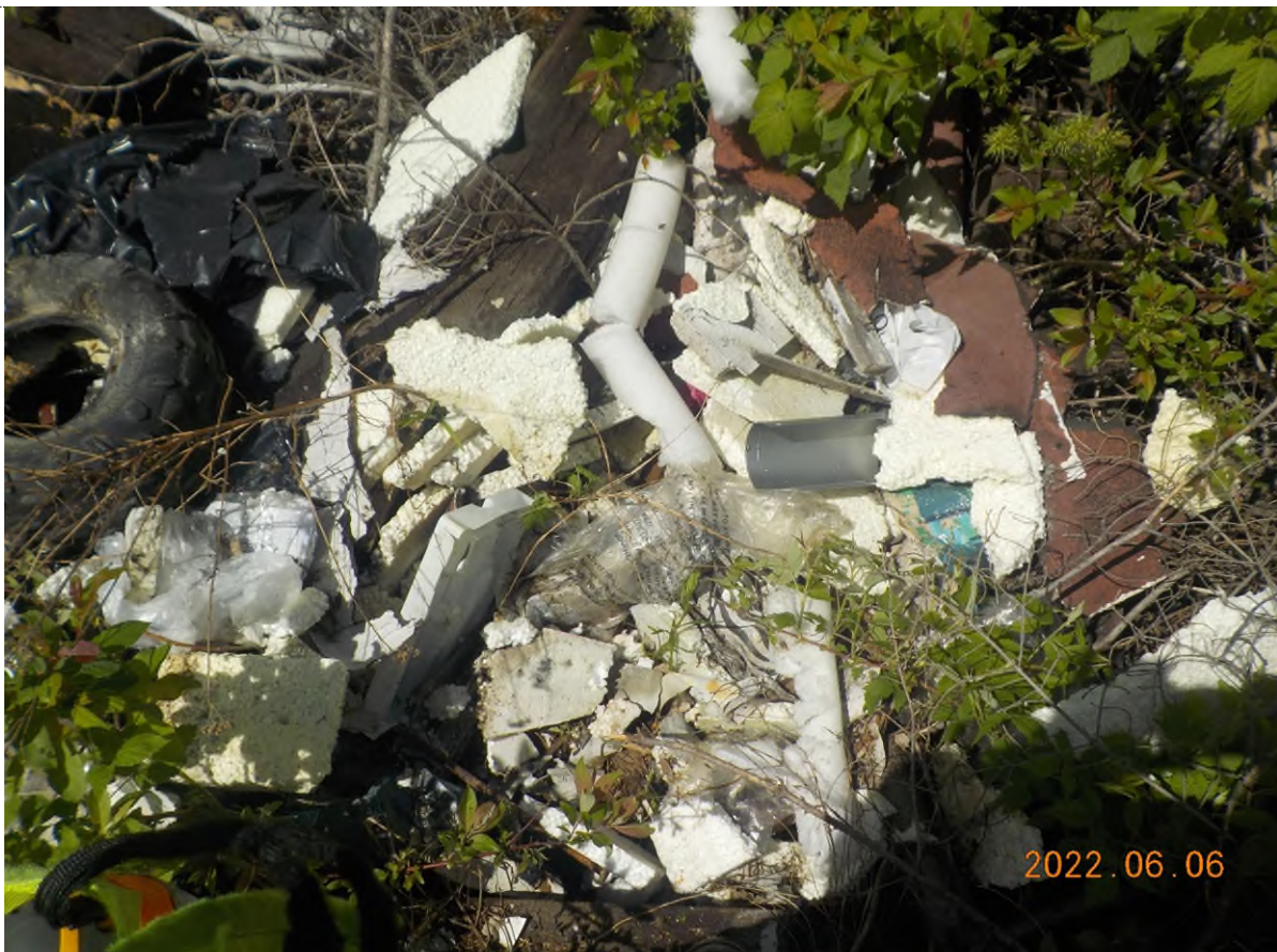
Figure 4: Débris à ramasser