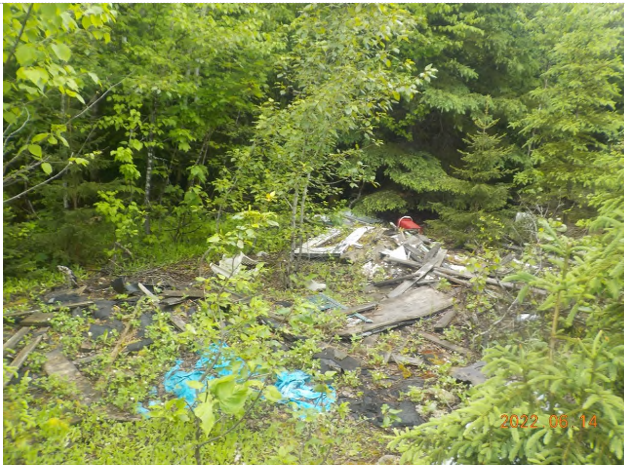
Figure 2: Emplacement des débris à ramasser