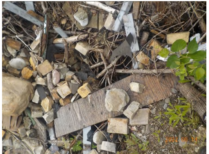
Figure 18: Débris à ramasser au point supplémentaire B