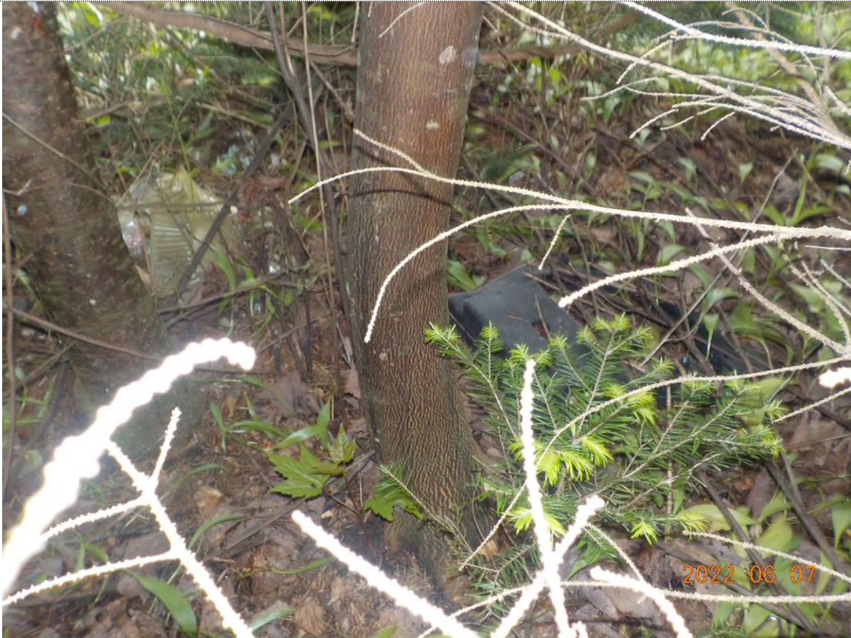
Figure 11: Déchets à ramasser sous les arbres (pts suppl. A)