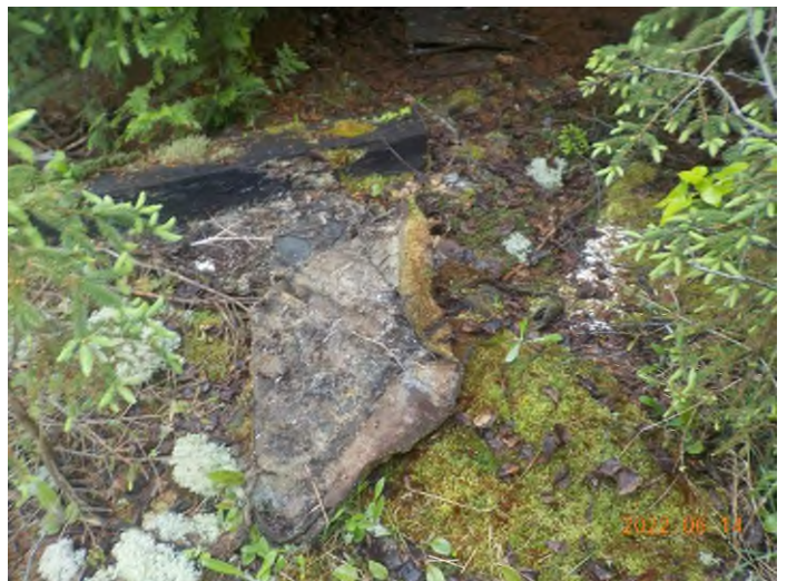
Figure 18: Débris à ramasser du point supplémentaire C