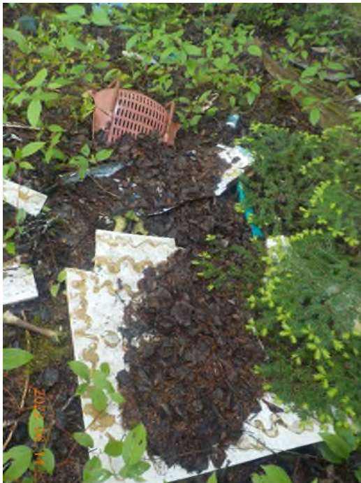
Figure 5: Débris à ramasser