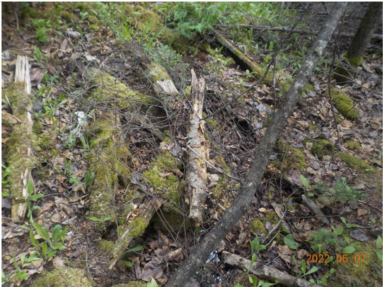
Figure 12: Débris à ramasser sur le site principal (bois et fils barbelés)