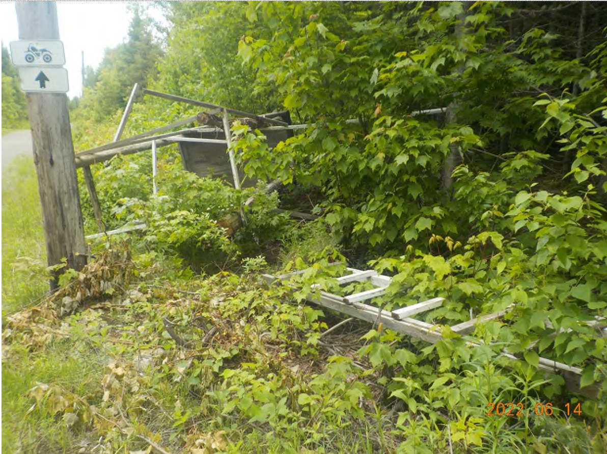
Figure 1: Structure écrasée à ramasser