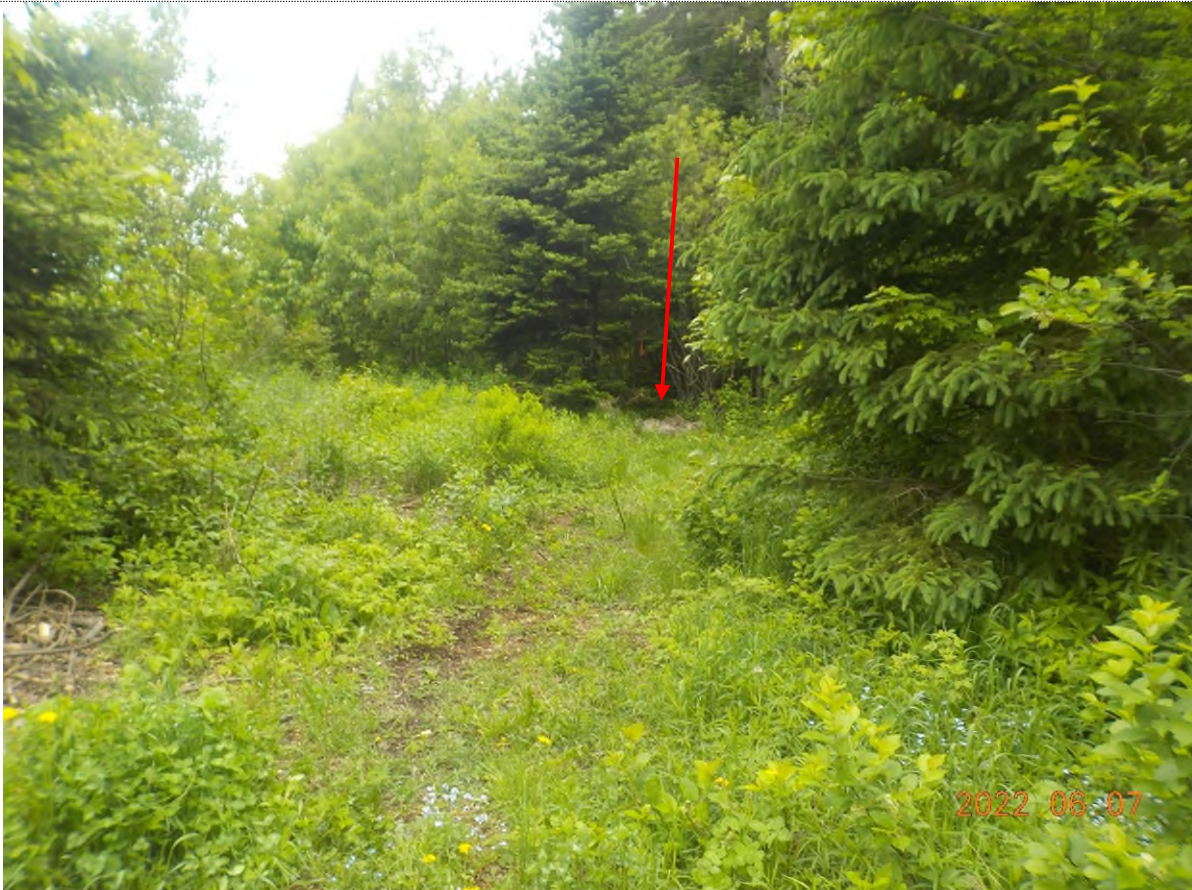
Figure 41: Emplacement de déchets à ramasser