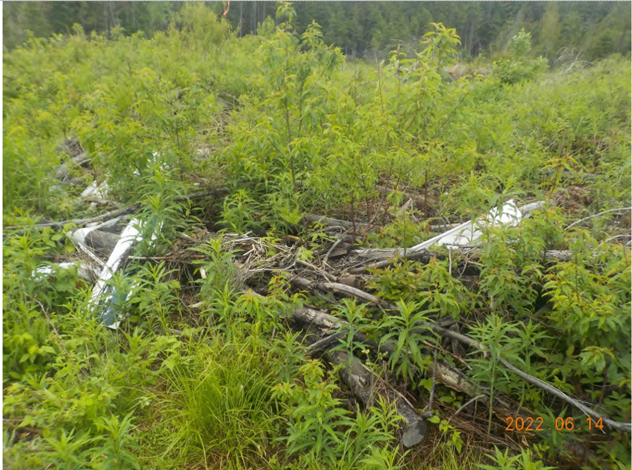
Figure 12: Débris à ramasser (certains débris sous le bois, branches et matière végétale)