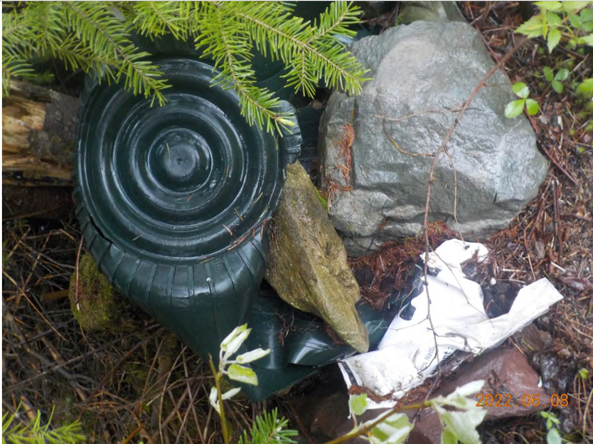
Figure 1: Débris à ramasser