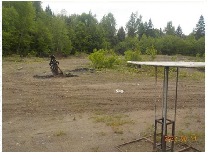
Figure 29: Débris à ramasser au point supplémentaire D