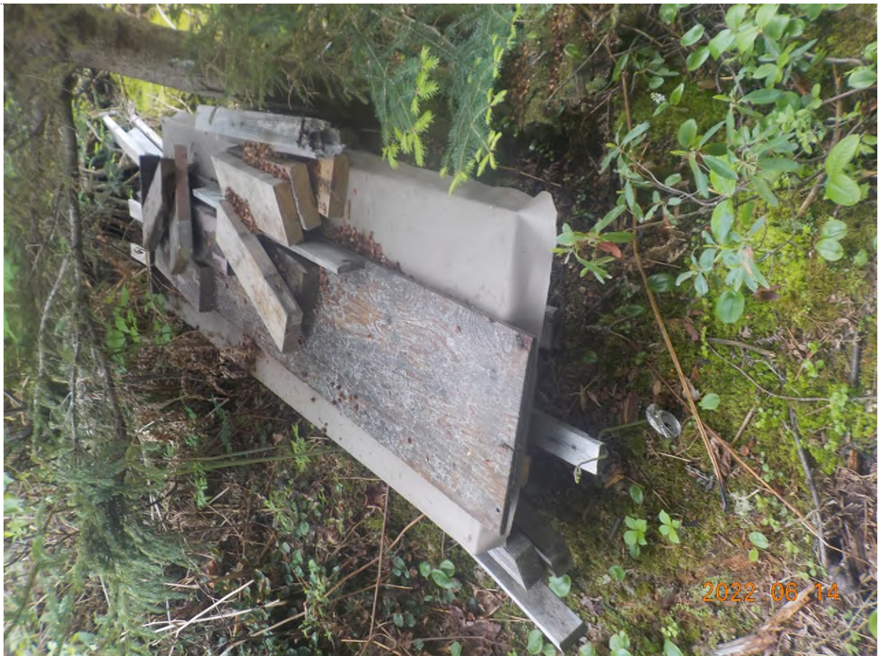
Figure 4: Débris à ramasser