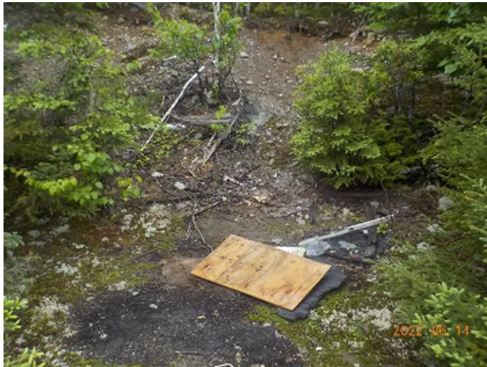
Figure 23: Débris à ramasser du point supplémentaire F