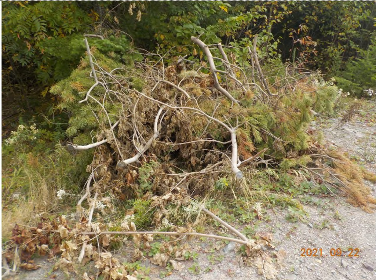
Figure 26: Débris à ramasser au point supplémentaire G (couper et étendre dans le boisé)