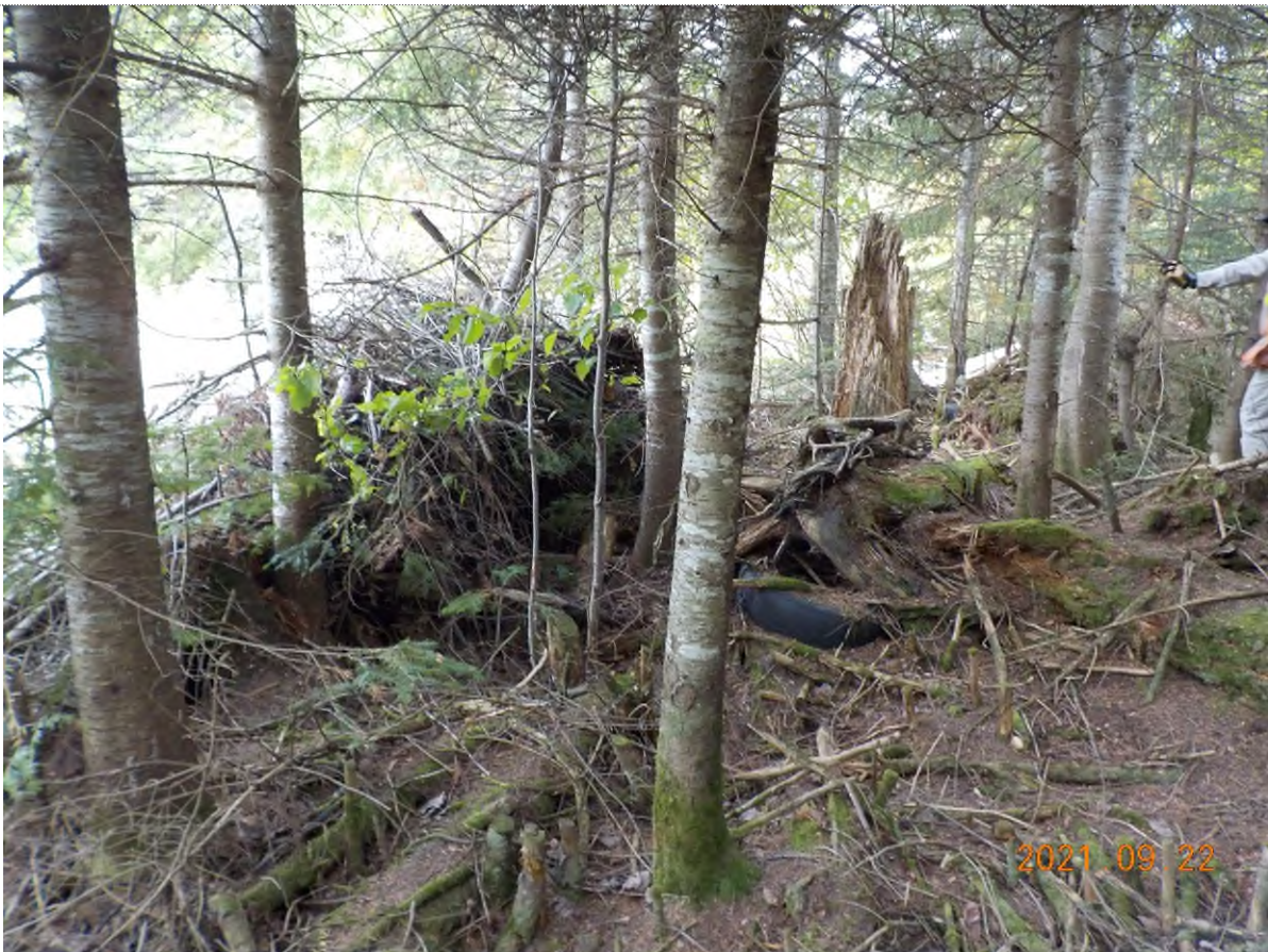
Figure 12: Vue du site point suppl. C