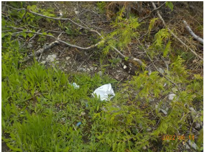
Figure 10: Débris à ramasser au point supplémentaire A