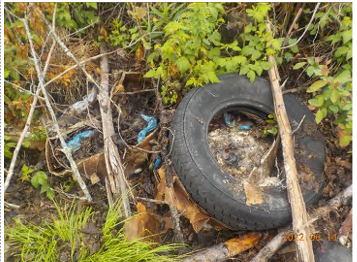
Figure 6: Débris à ramasser