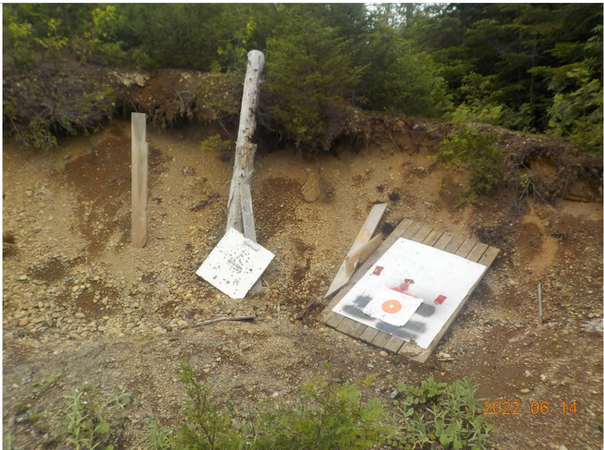
Figure 2: Débris à ramasser