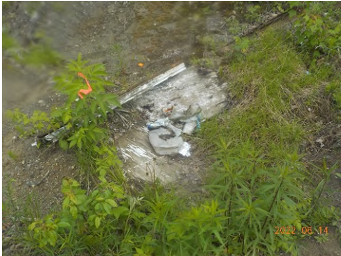
Figure 62: Débris à ramasser au point supplémentaire G