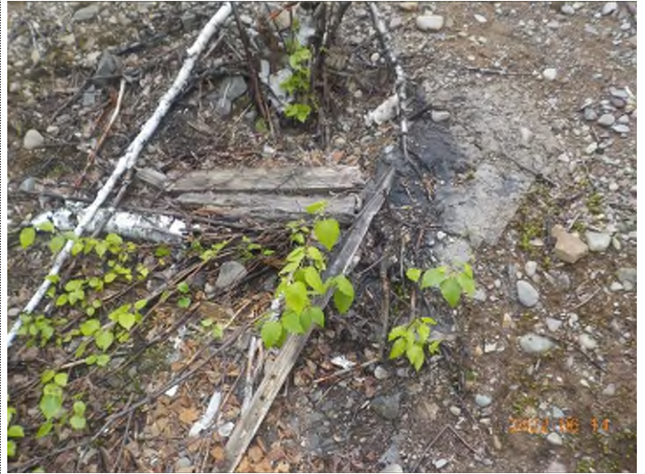
Figure 24: Débris à ramasser du point supplémentaire F