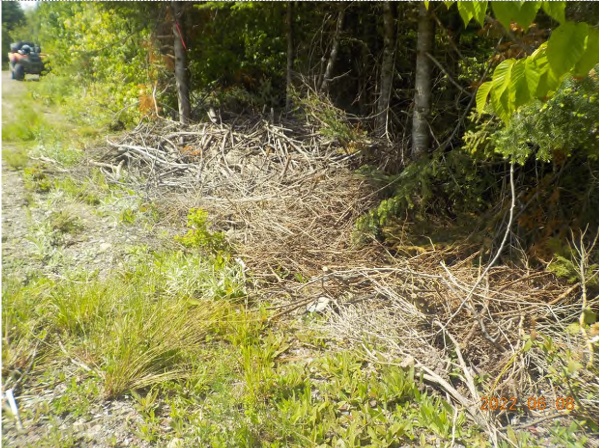
Figure 11: Vue du site point suppl. C