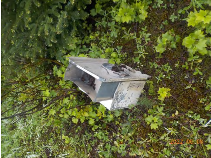
Figure 3: Débris à ramasser