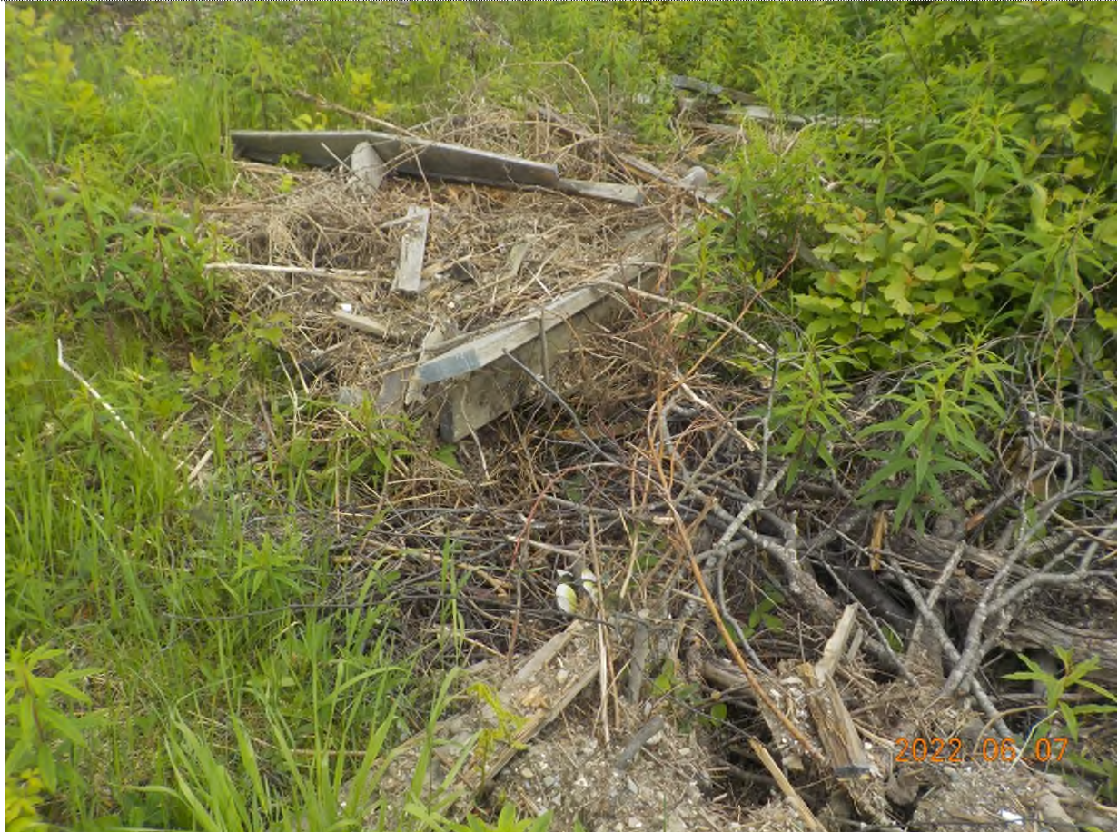
Figure 1: Débris d'ancienne plate-forme à ramasser