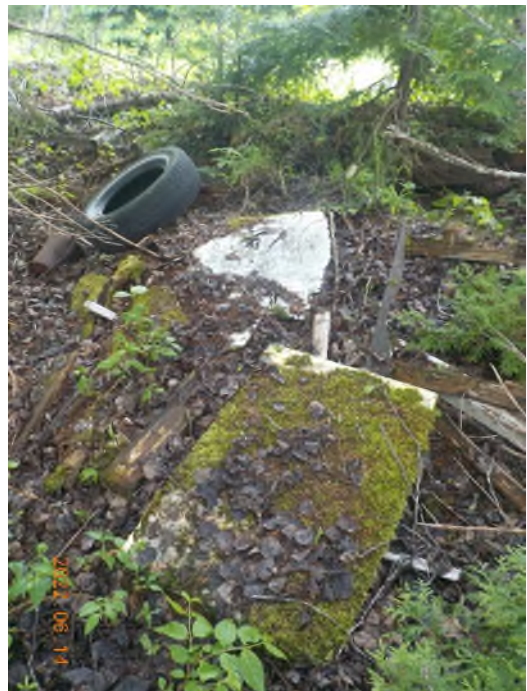
Figure 10: Débris à ramasser