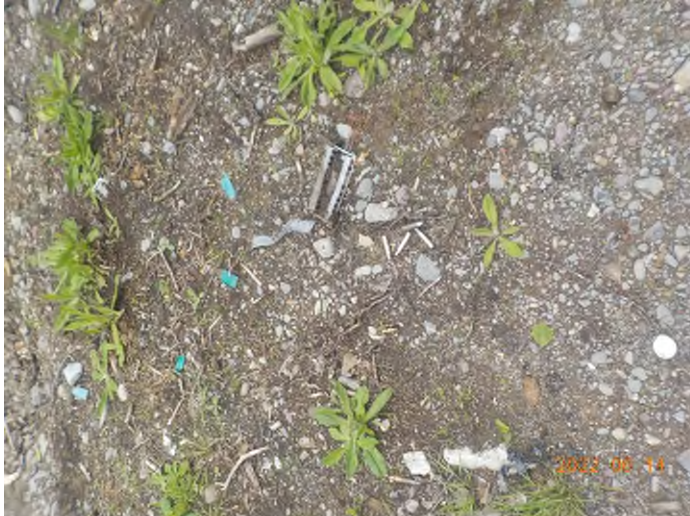
Figure 11: Débris à ramasser au point supplémentaire A