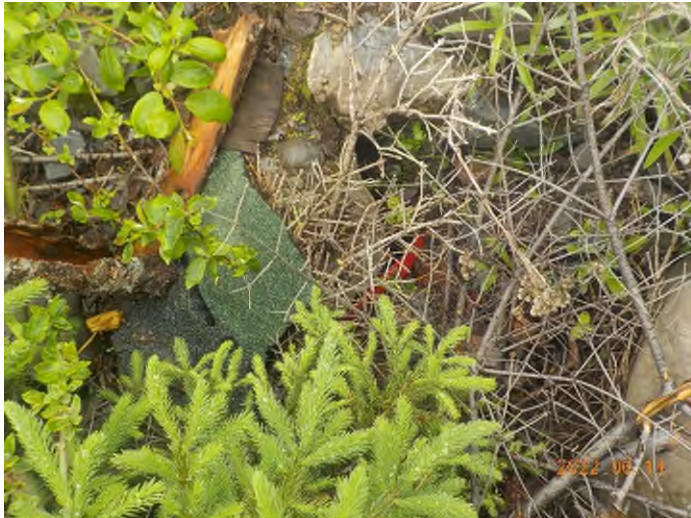
Figure 19: Débris à ramasser au point supplémentaire B