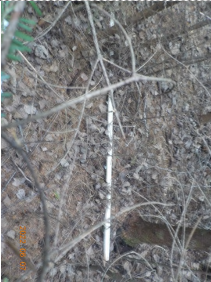
Figure 23: Débris à ramasser au point suppl. B (pôles en aluminium)