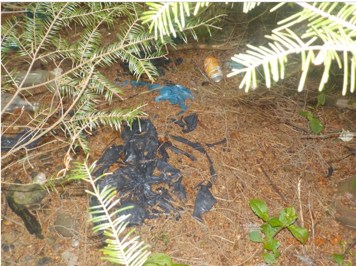
Figure 28: Déchets à ramasser sous matière végétale (pts suppl. C)