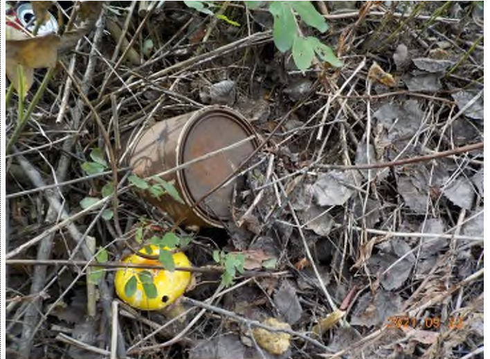
Figure 8: Débris à ramasser aux points suppl. A-B