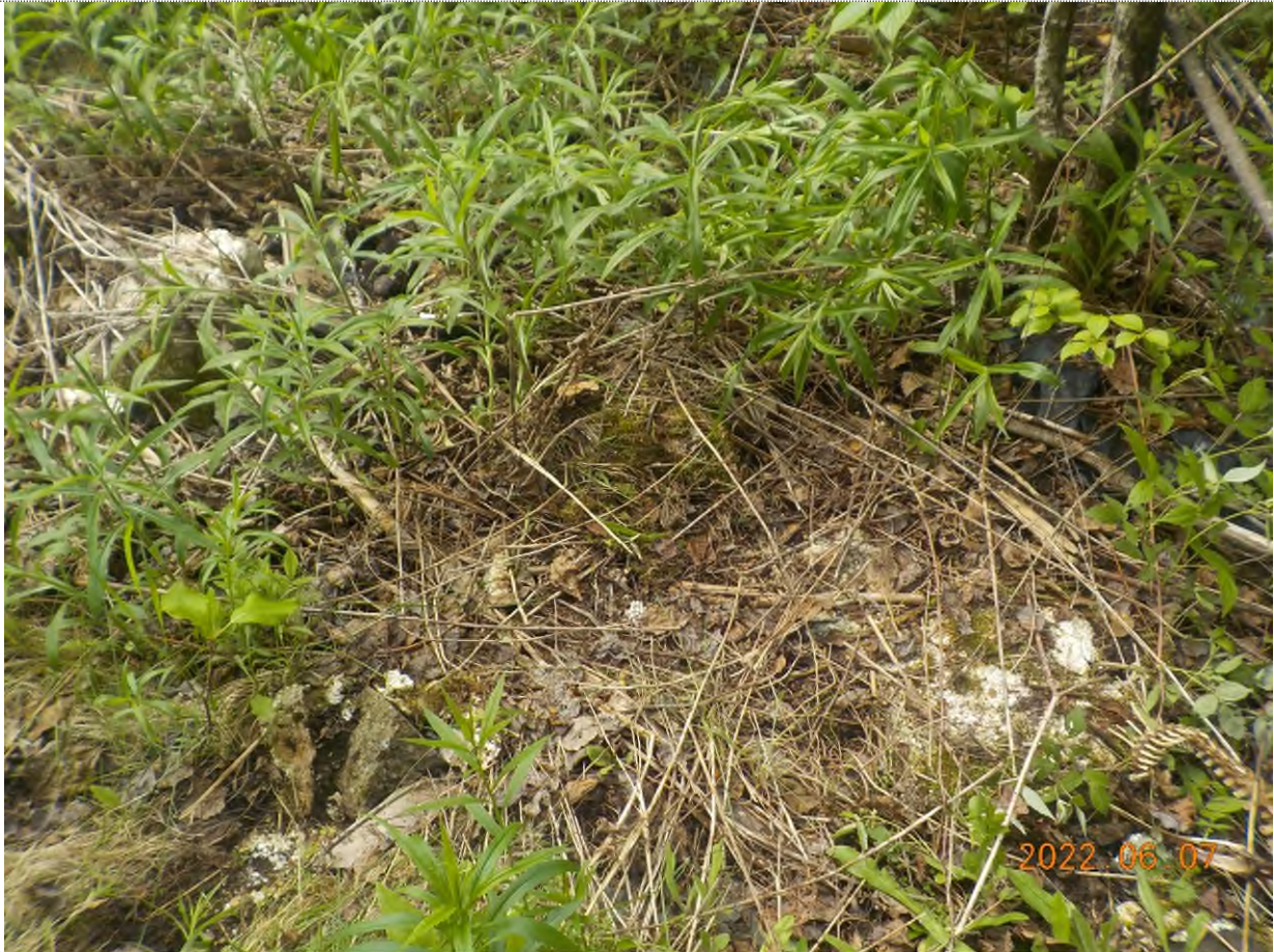
Figure 9: Débris enfouis à ramasser sur le site principal