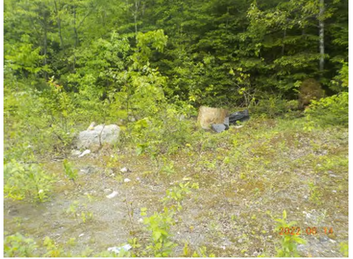
Figure 4: Débris à ramasser