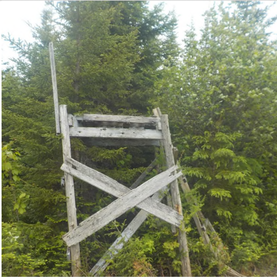
Figure 1: Structure abandonnée à ramasser