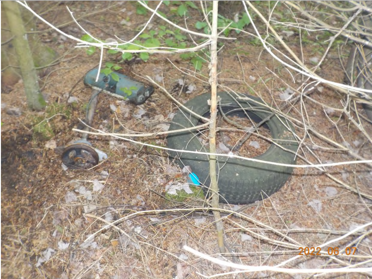
Figure 17: Pneus et déchets à ramasser (pts suppl. B)