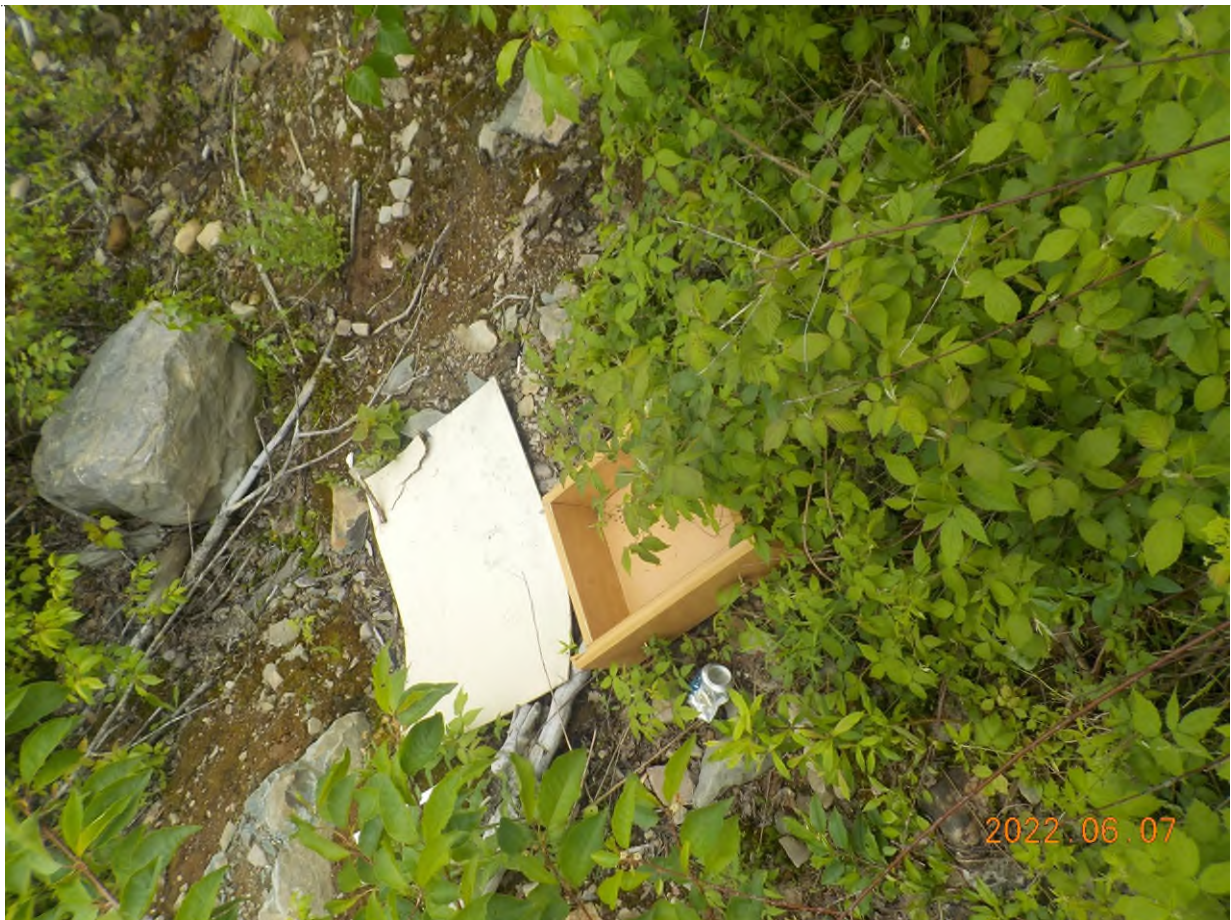
Figure 6: Débris à ramasser au point supplémentaire A