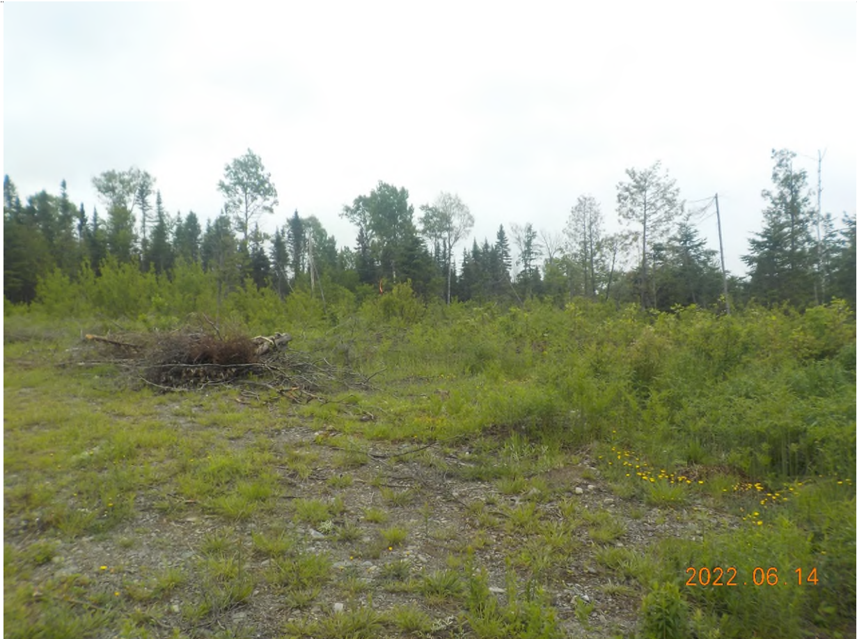
Figure 16: Vue d'ensemble du site