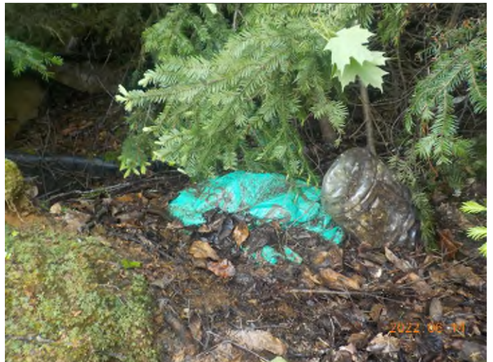
Figure 6: Débris à ramasser