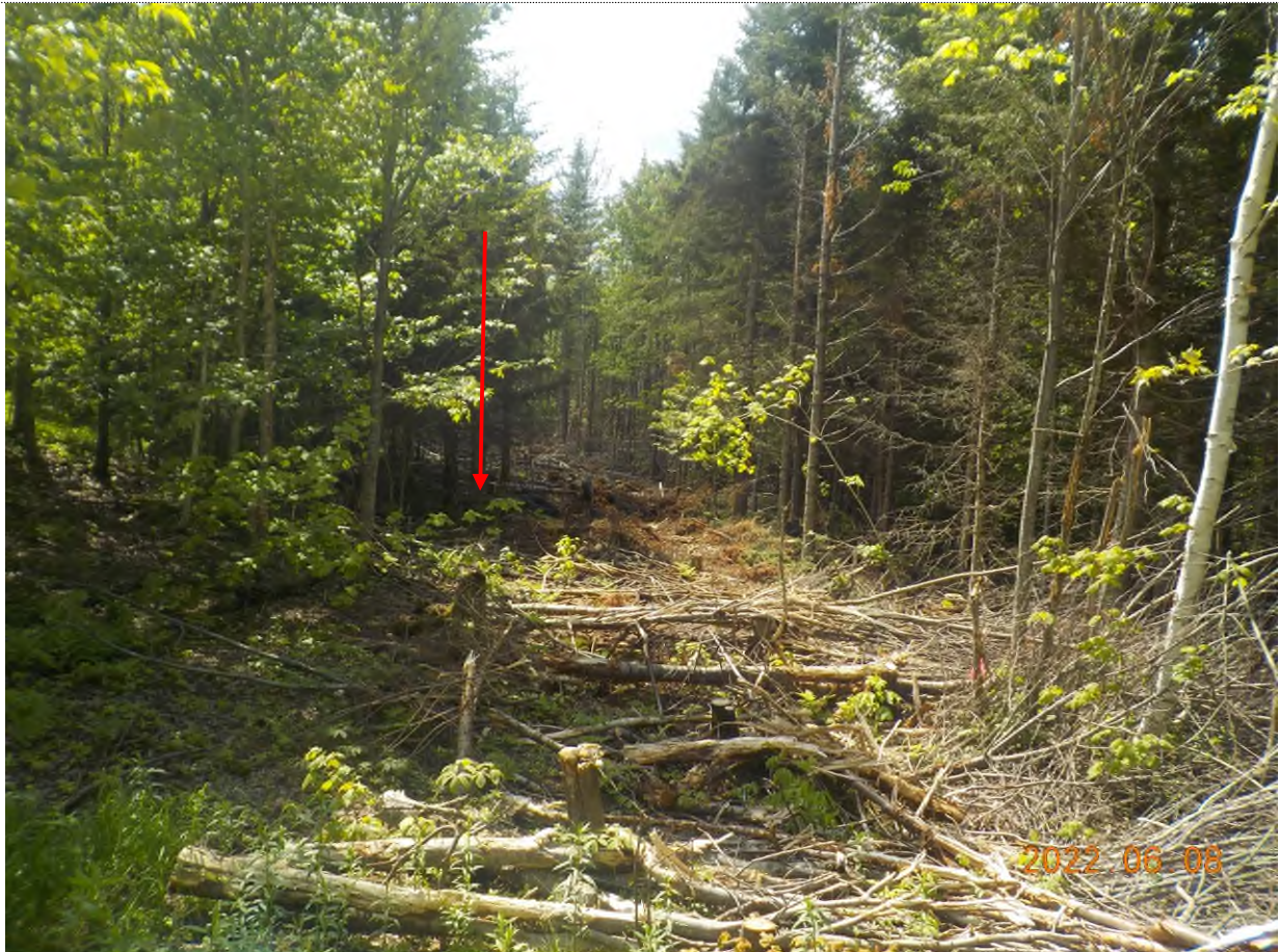
Figure 36: Accès au site suppl. J et K (coupe de bois récente)