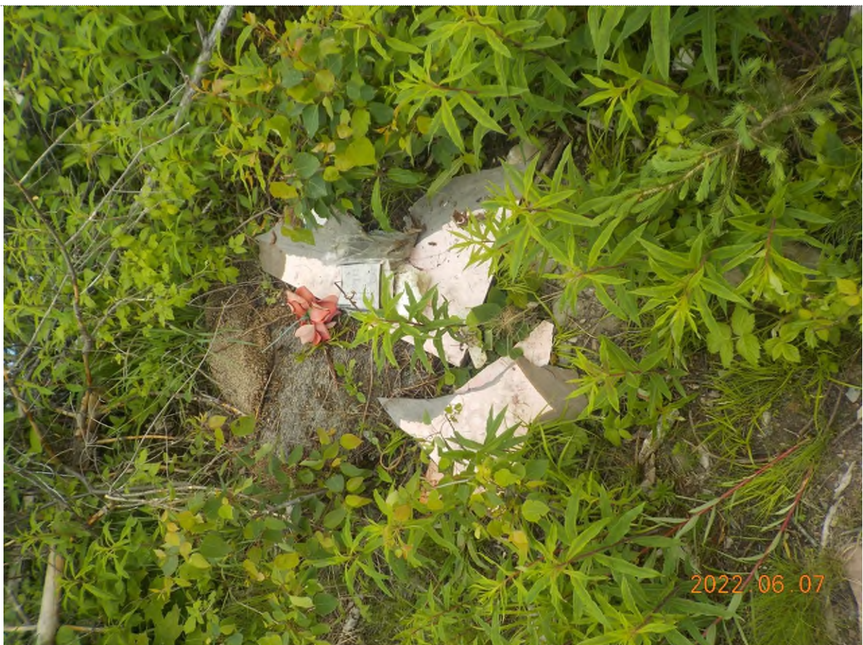
Figure 4: Débris à ramasser (tapis et prélat)