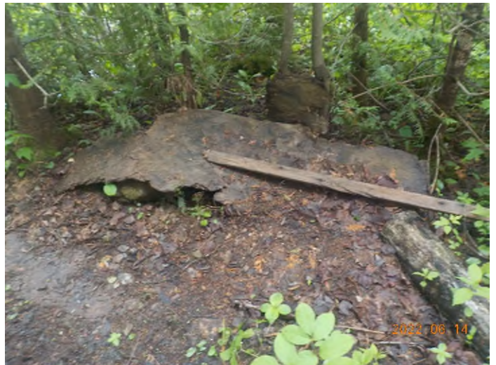
Figure 6: Débris à ramasser