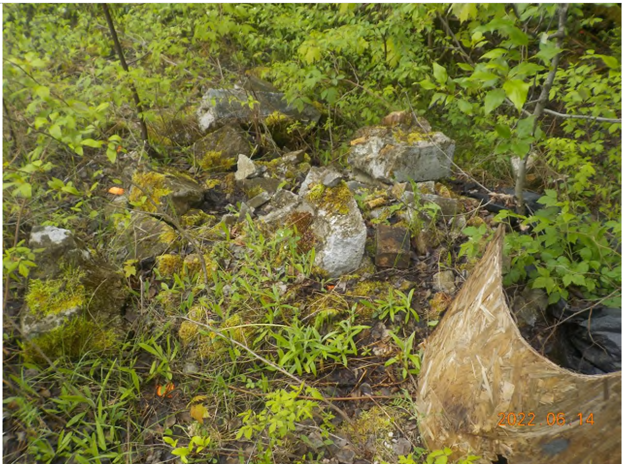
Figure 2: Débris à ramasser