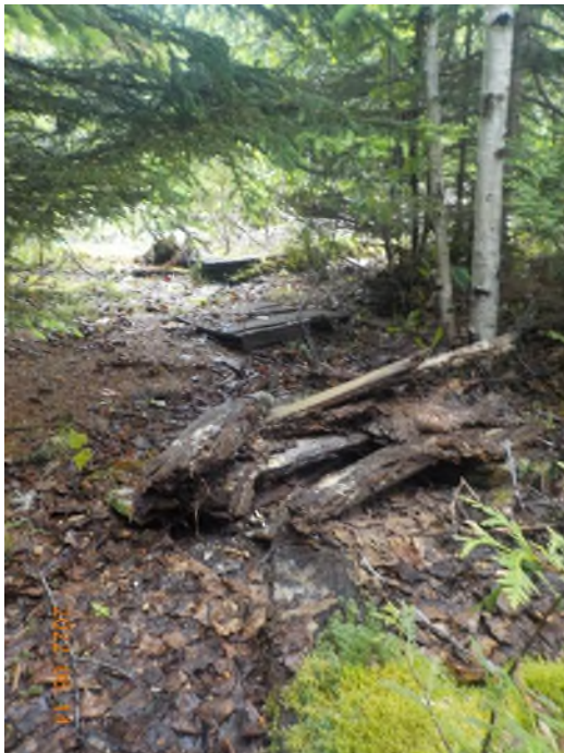
Figure 17: Débris à ramasser du point supplémentaire C