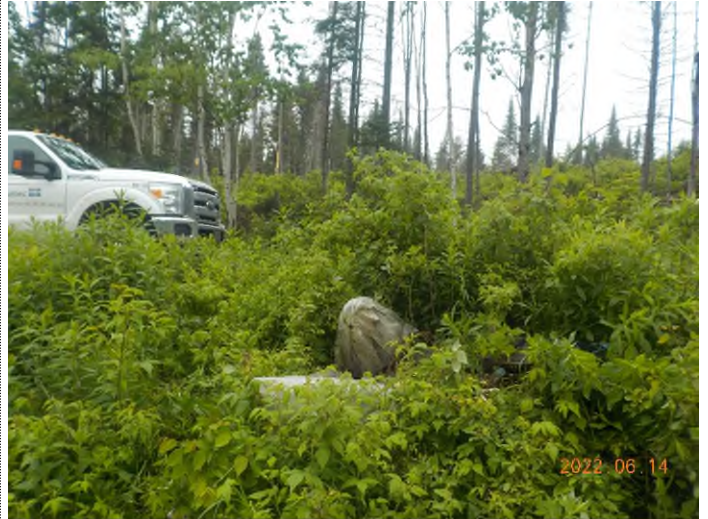
Figure 16: Débris à ramasser au point supplémentaire A