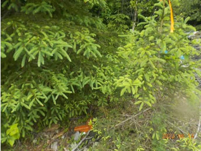
Figure 19: Débris à ramasser du point supplémentaire D