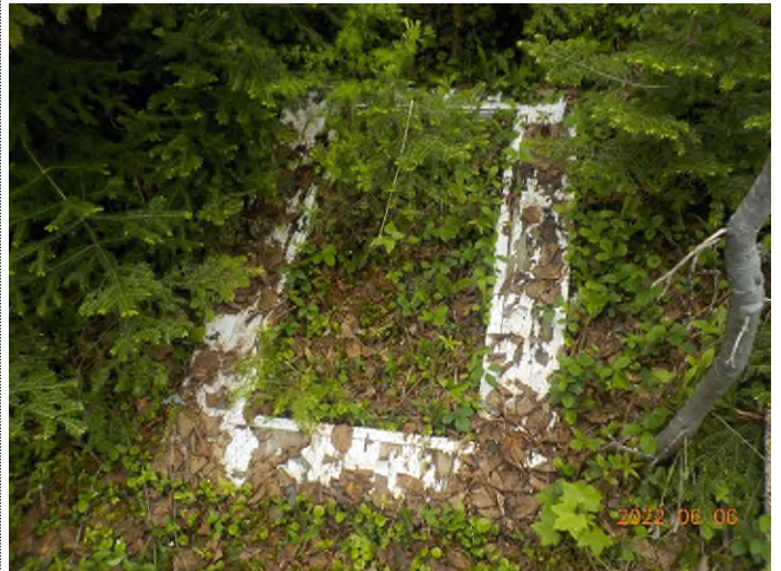
Figure 14: Débris à ramasser pts suppl. A