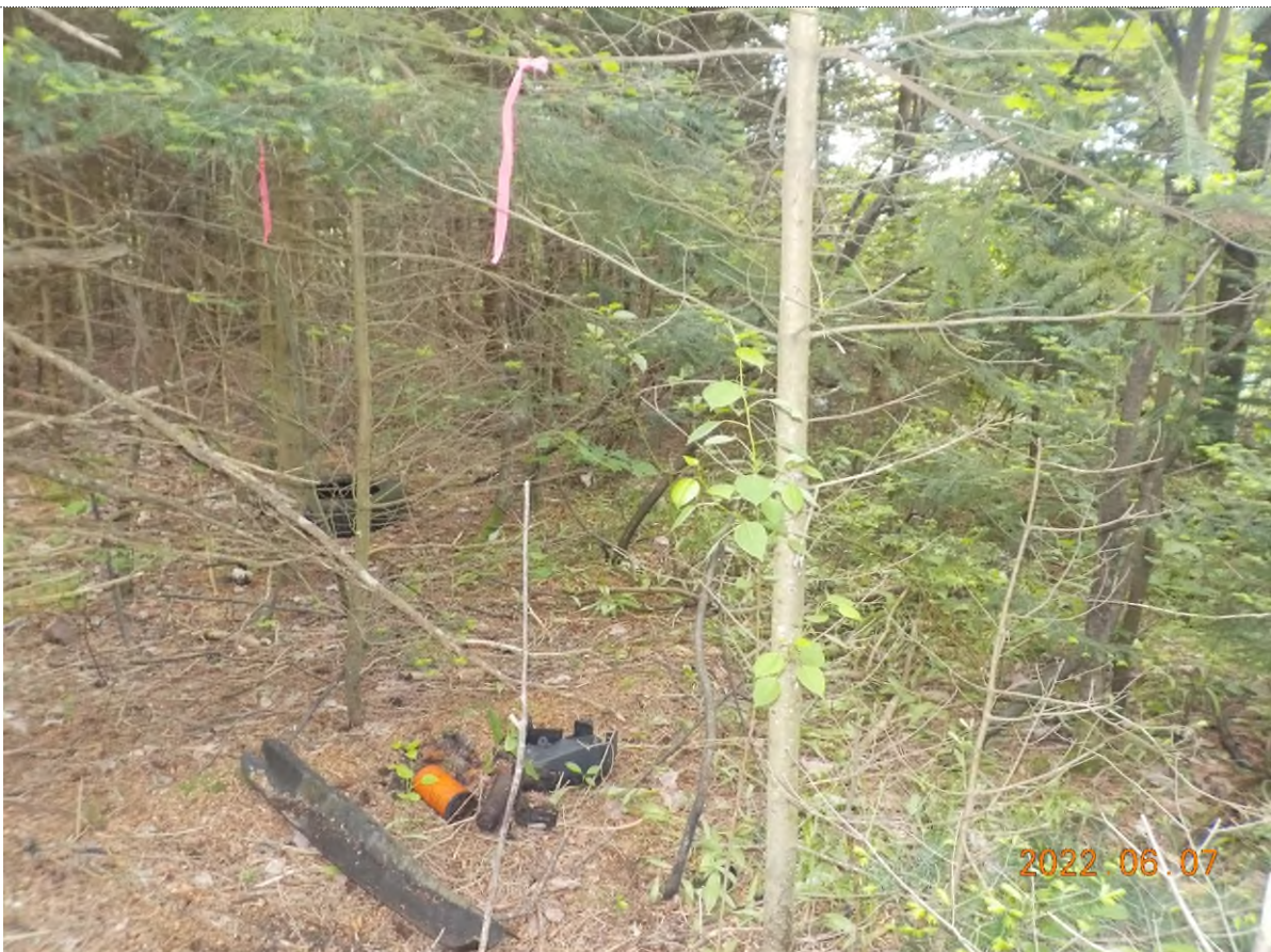
Figure 16: Pneus et déchets à ramasser dans le boisé (pts suppl. A)