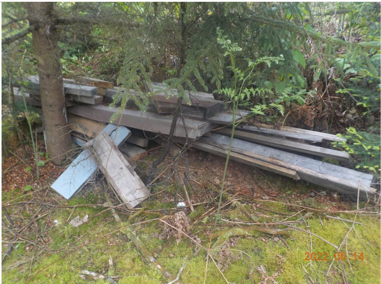
Figure 2: Débris à ramasser