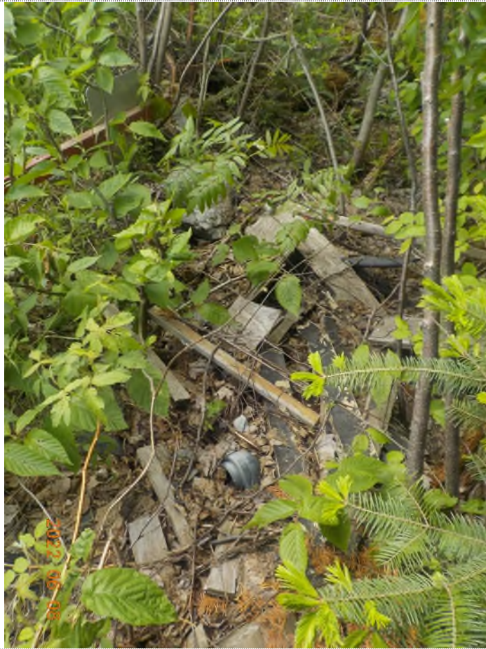
Figure 23: Débris à ramasser au point suppl. E