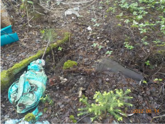
Figure 7: Débris à ramasser