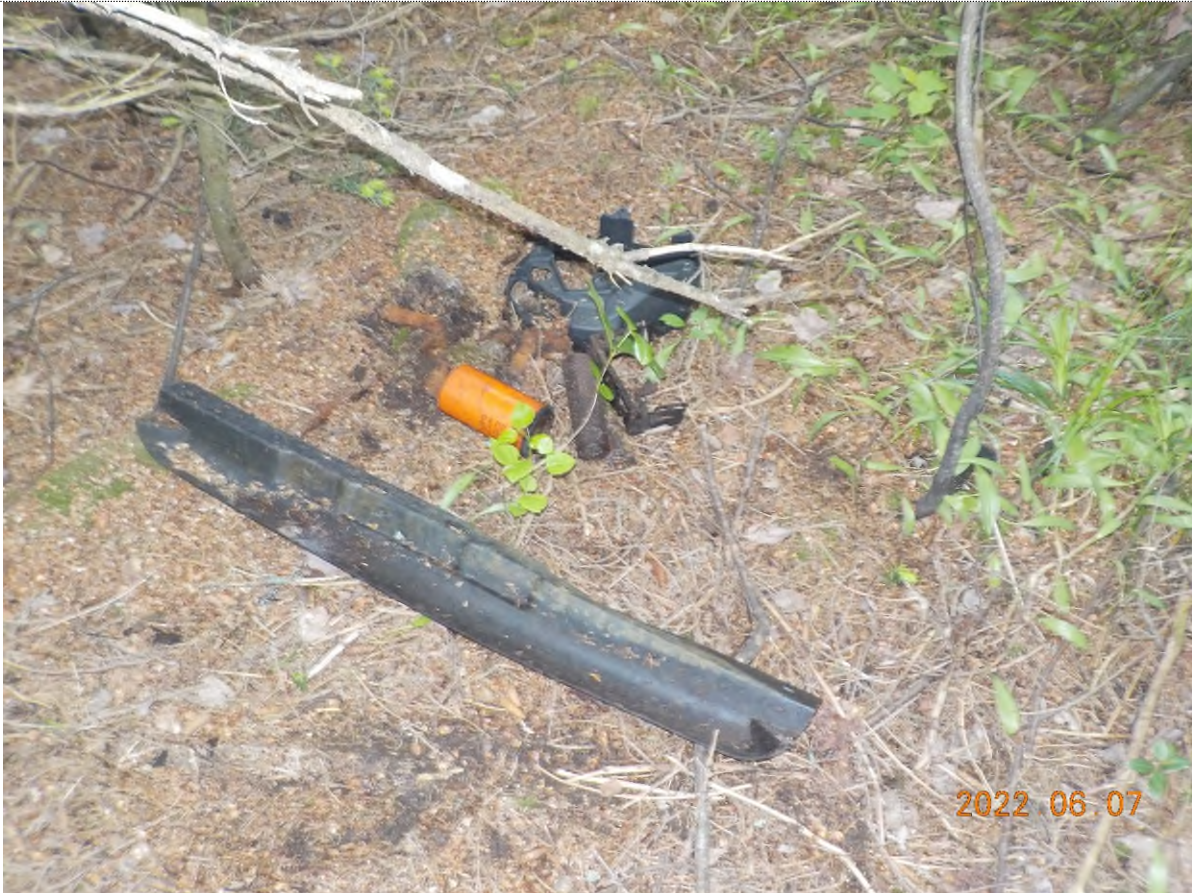
Figure 15: Déchets à ramasser dans le boisé (pts suppl. A)