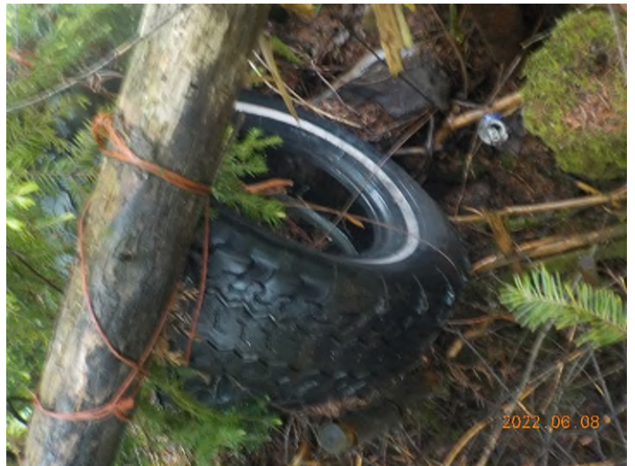
Figure 6: Débris à ramasser