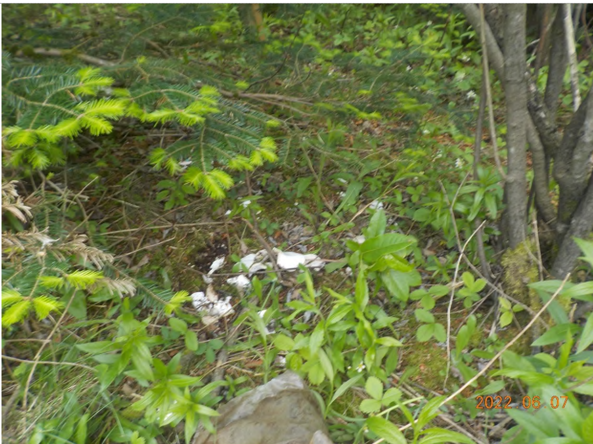
Figure 40: Déchets à ramasser (céramique) – pts suppl. D