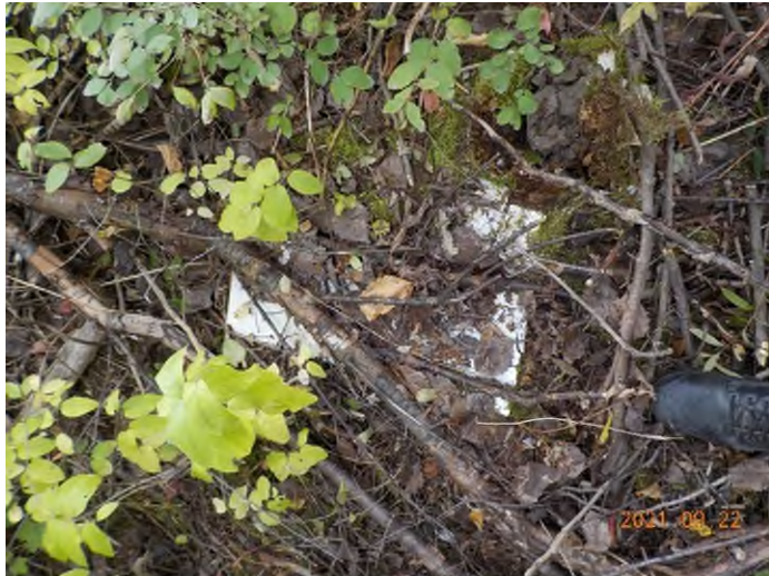
Figure 7: Débris à ramasser aux points suppl. A-B