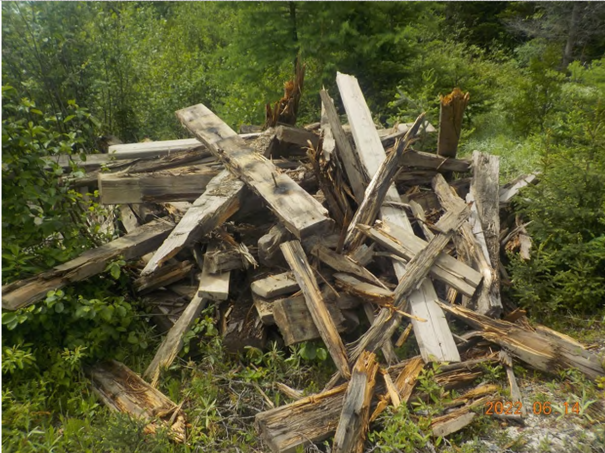
Figure 7: Débris à ramasser du point supplémentaire B