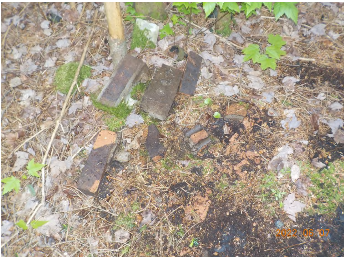
Figure 18: Déchets à ramasser (brique, bois et bardeaux enfouis sous matière végétale) – pts suppl. B