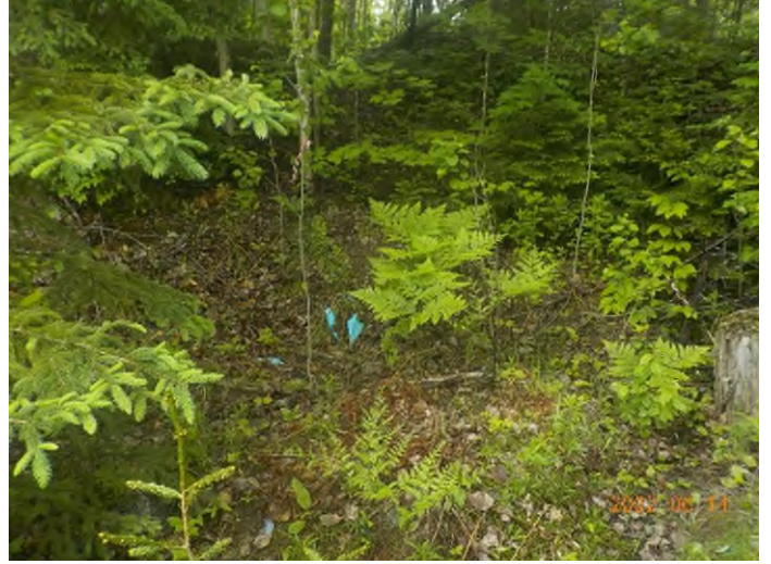
Figure 47: Emplacement des débris à ramasser au point supplémentaire H