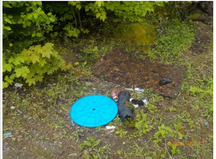
Figure 27: Débris à ramasser au point supplémentaire D