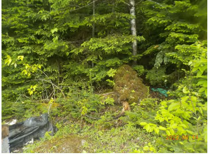
Figure 8: Débris à ramasser