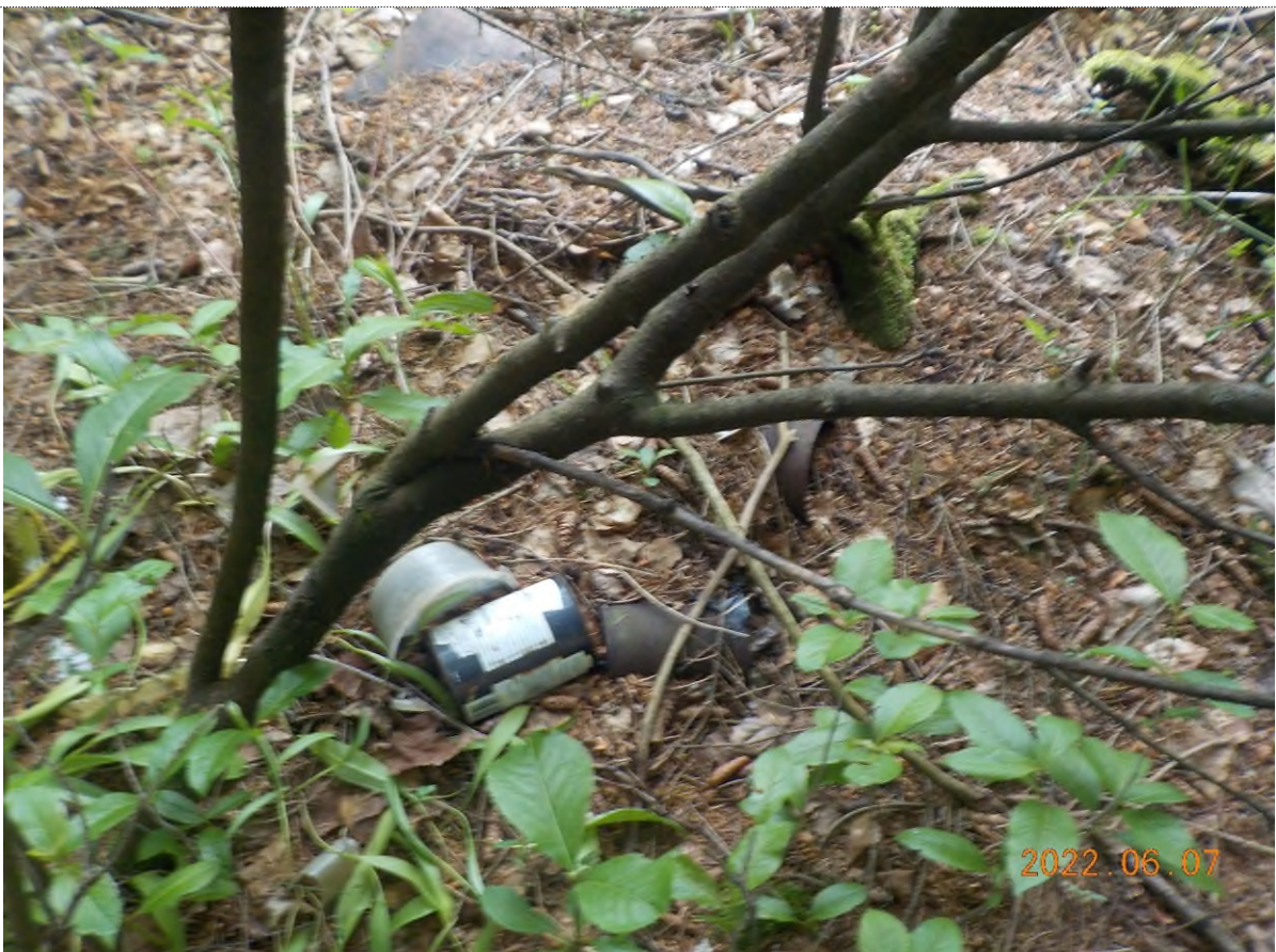
Figure 22: Déchets à ramasser (pts suppl. B)