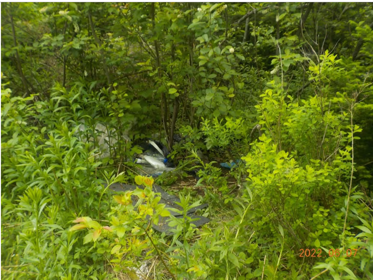
Figure 36: Déchets à ramasser (pts suppl. C)