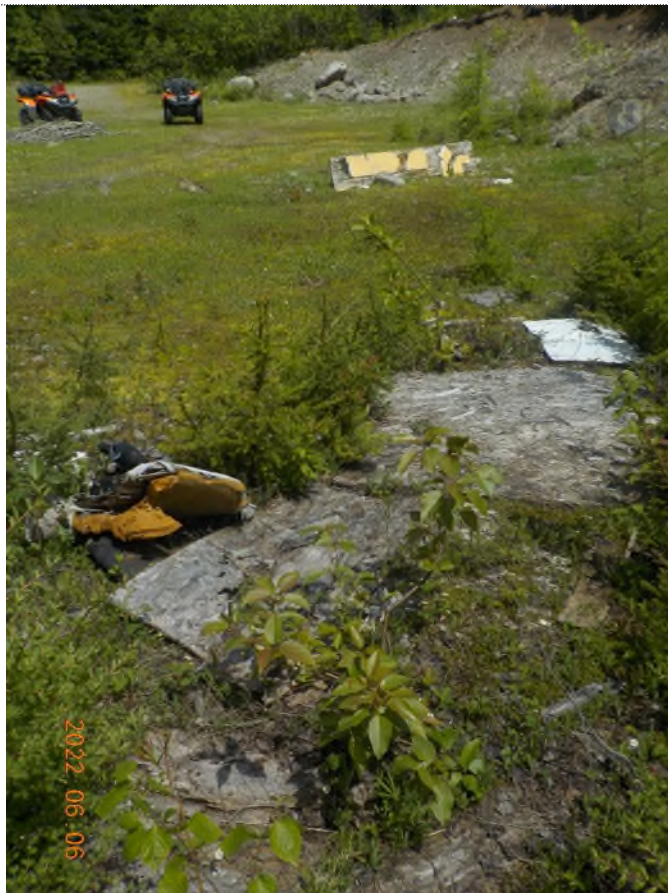
Figure 11: Autre vue du site principal à ramasser