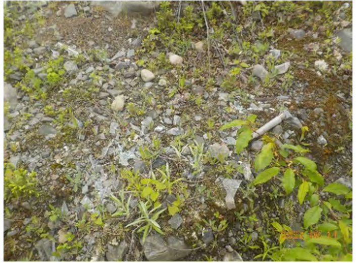
Figure 16: Débris à ramasser au point supplémentaire B