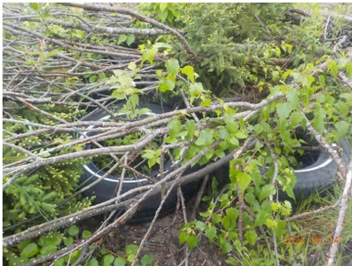
Figure 13: Débris à ramasser du point supplémentaire C