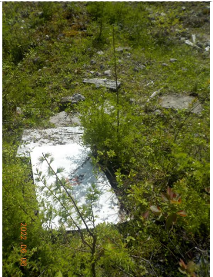
Figure 8: Débris à ramasser