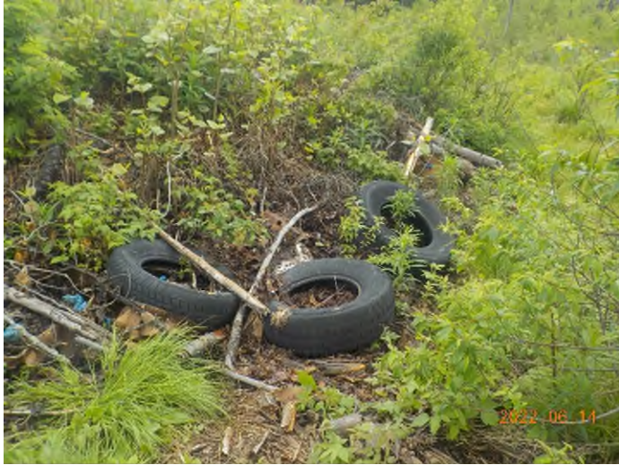
Figure 3: Débris à ramasser