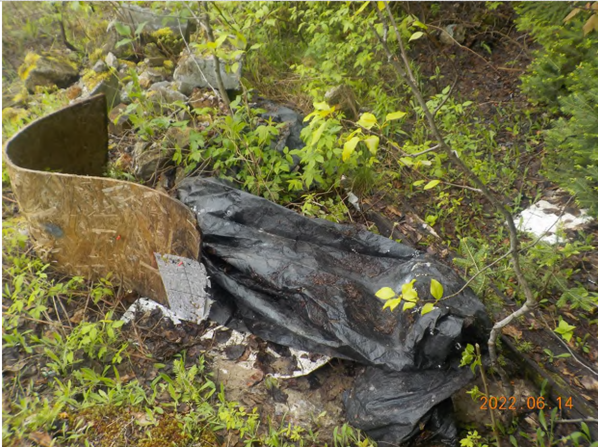
Figure 1: Débris à ramasser