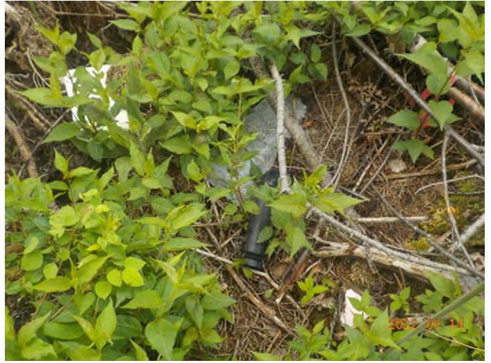
Figure 8: Débris à ramasser