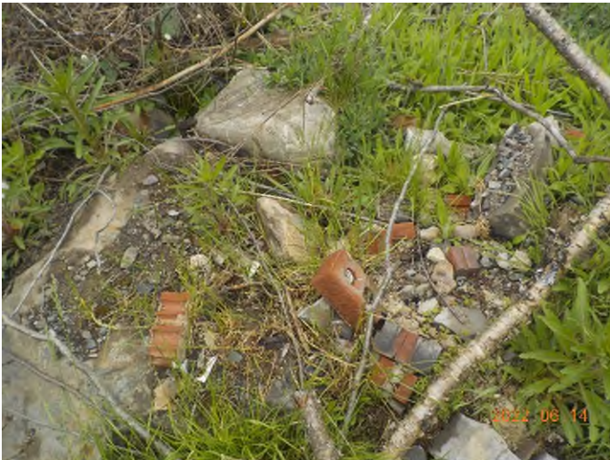
Figure 25: Débris à ramasser au point supplémentaire B