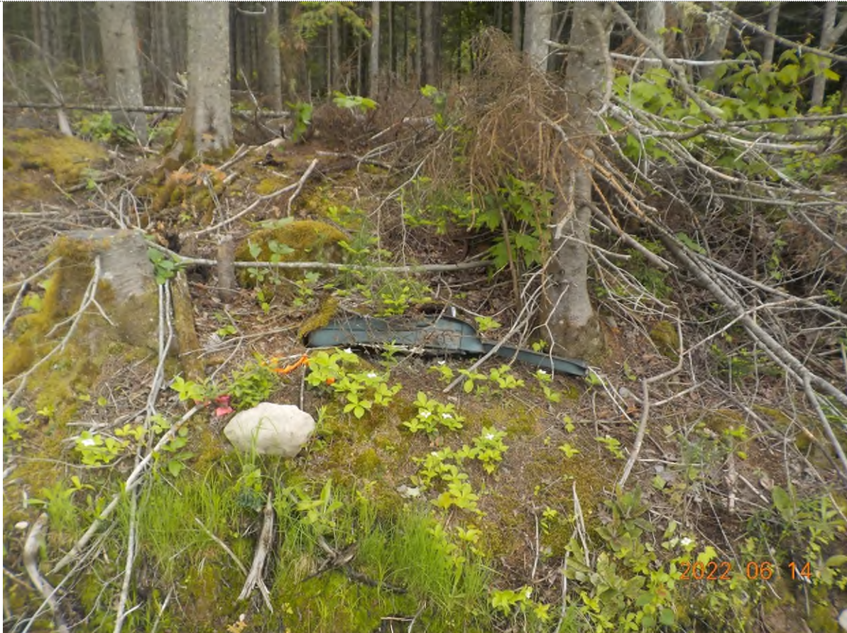
Figure 1: Débris à ramasser