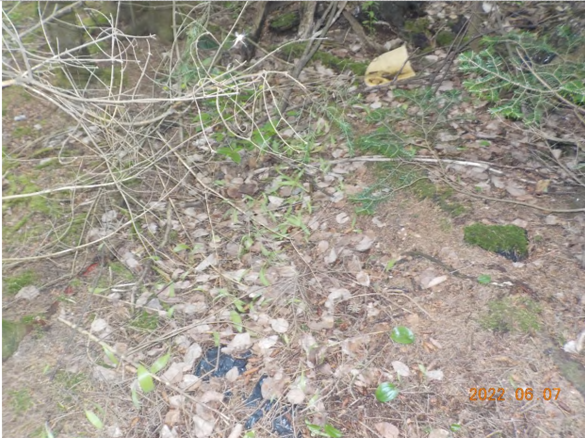
Figure 7: Déchets à ramasser dans le boisé (sous matière végétale)