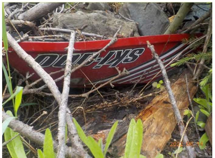
Figure 22: Débris à ramasser au point supplémentaire B