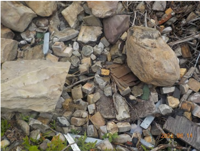
Figure 17: Débris à ramasser au point supplémentaire B