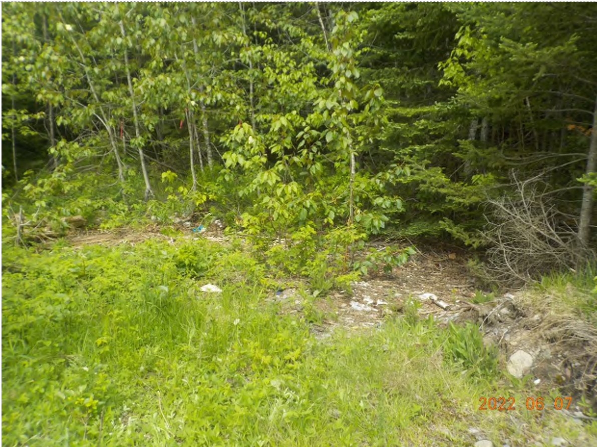
Figure 1: Vue du site à ramasser (débris compacté sous la matière végétale)