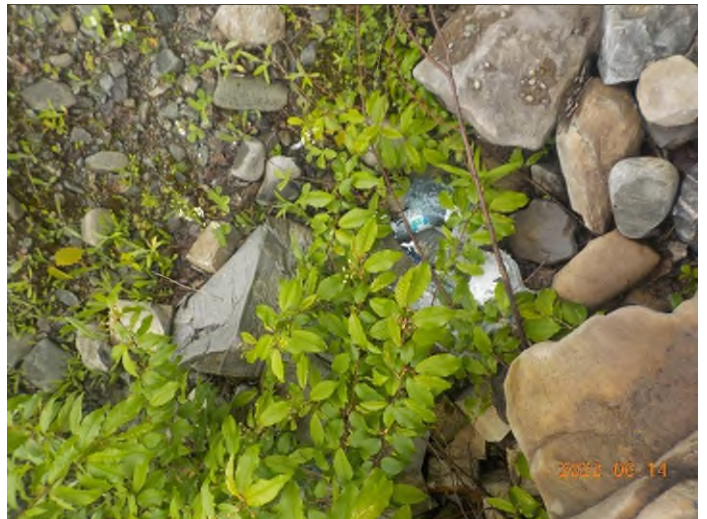
Figure 14: Débris à ramasser au point supplémentaire B