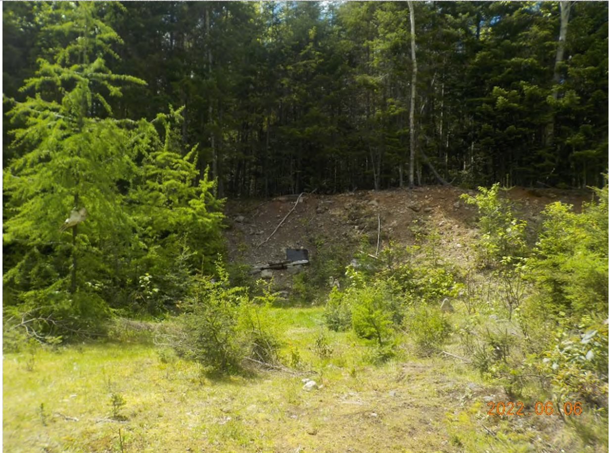
Figure 12: Vue du point supplémentaire A à ramasser