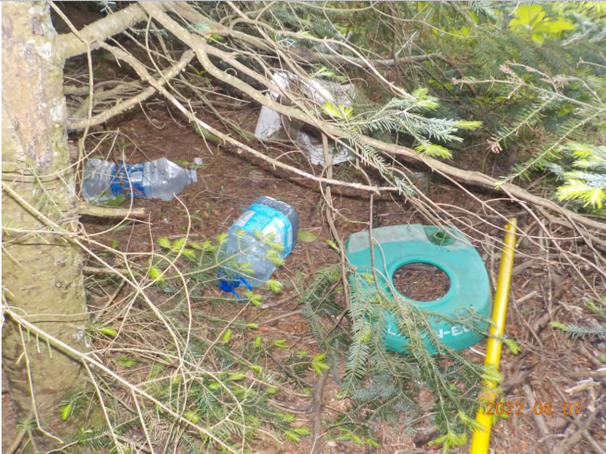
Figure 5: Déchets à ramasser dans le boisé