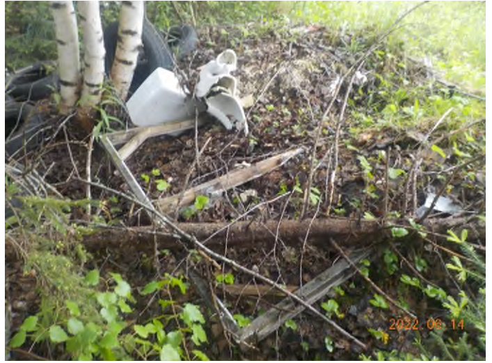
Figure 12: Débris à ramasser