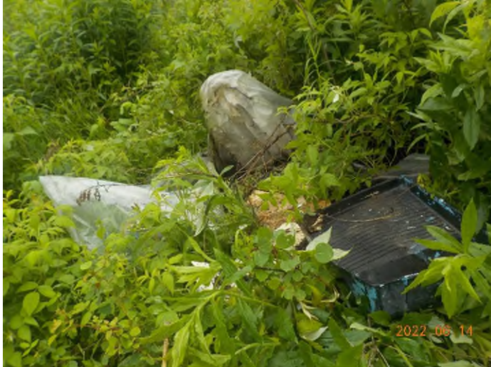
Figure 15: Débris à ramasser au point supplémentaire A