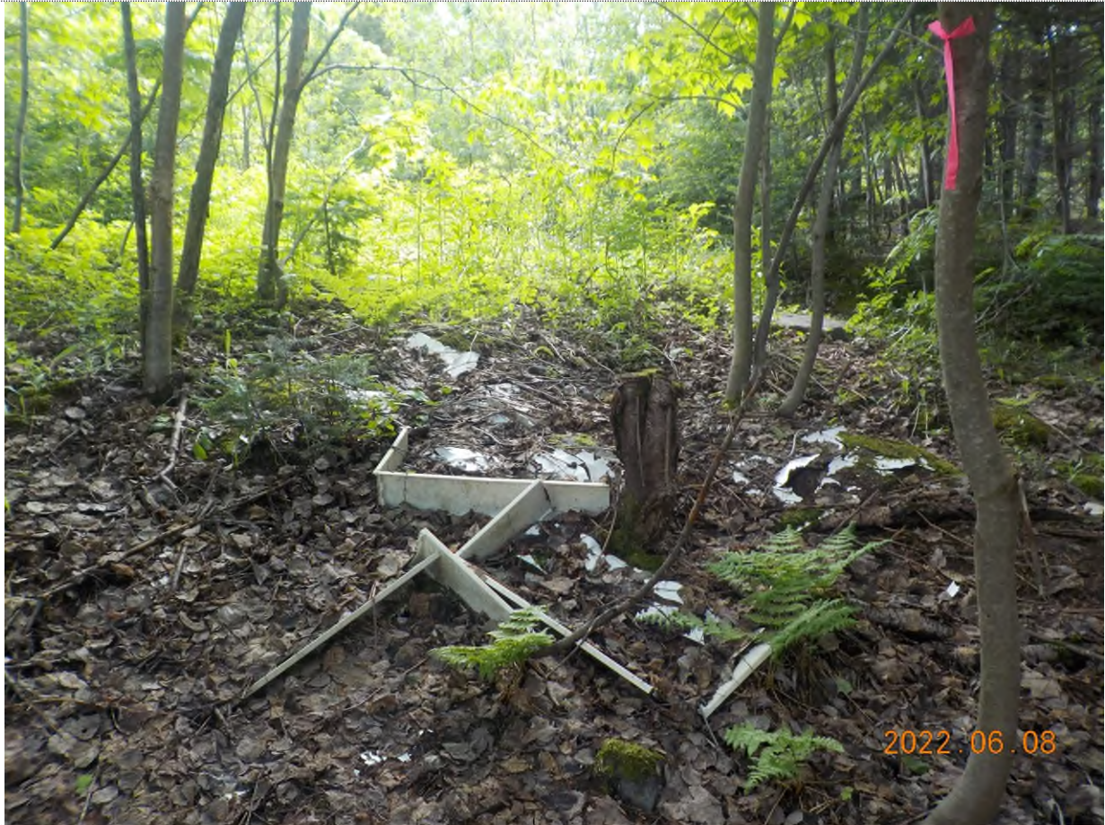
Figure 31: Débris à ramasser aux points supplémentaires J et K