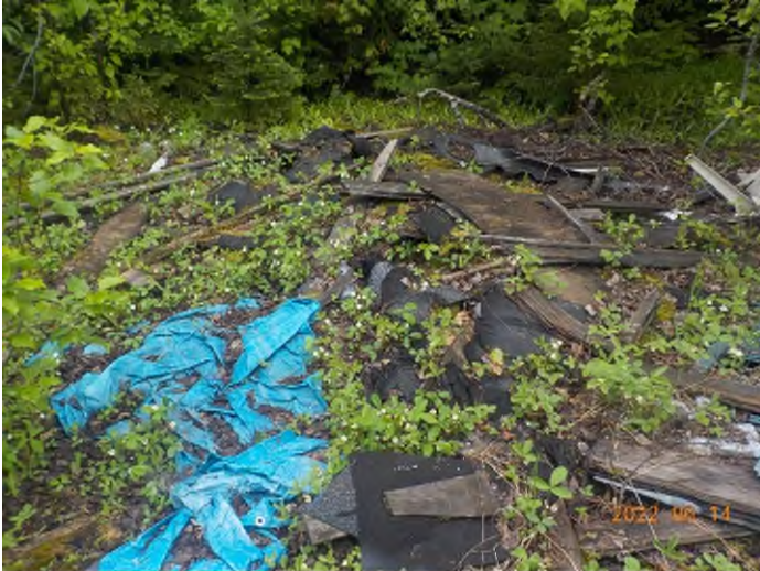
Figure 3: Débris à ramasser