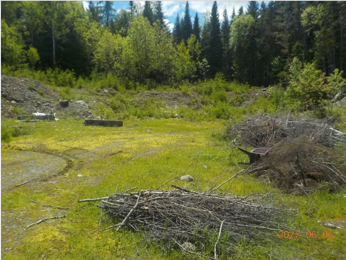
Figure 1: Vue du site principal à ramasser