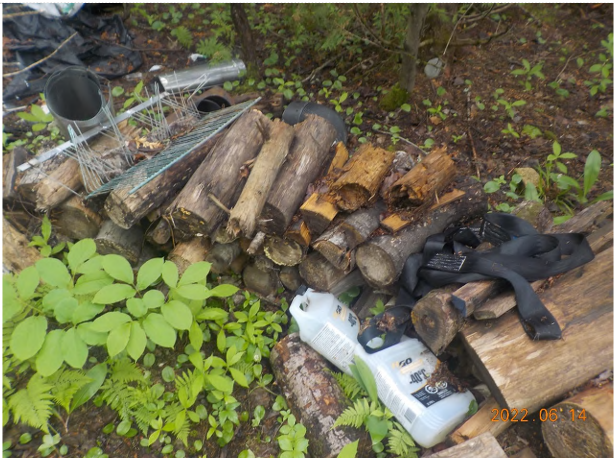
Figure 2: Débris à ramasser