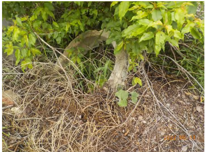
Figure 26: Débris à ramasser au point supplémentaire B