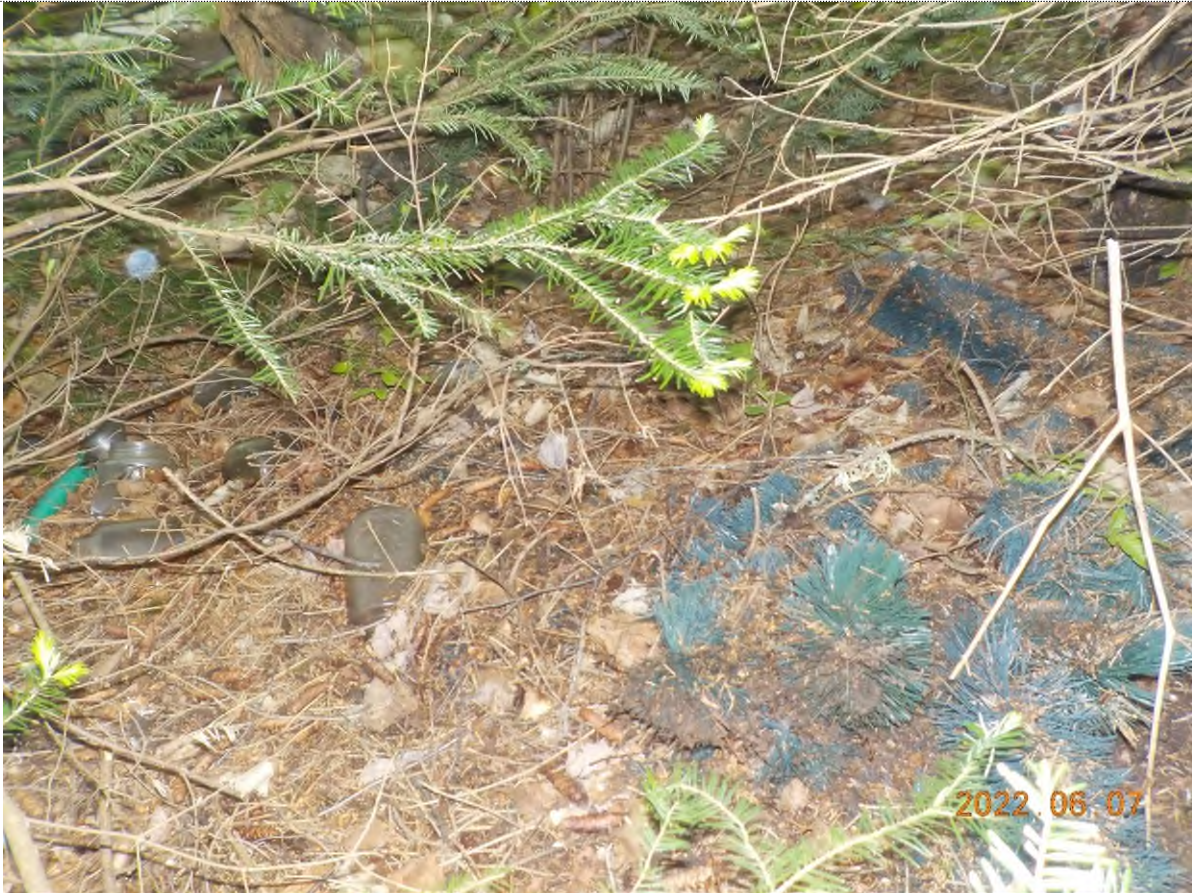
Figure 23: Déchets à ramasser enfouis sous matière végétale (pts suppl.B)