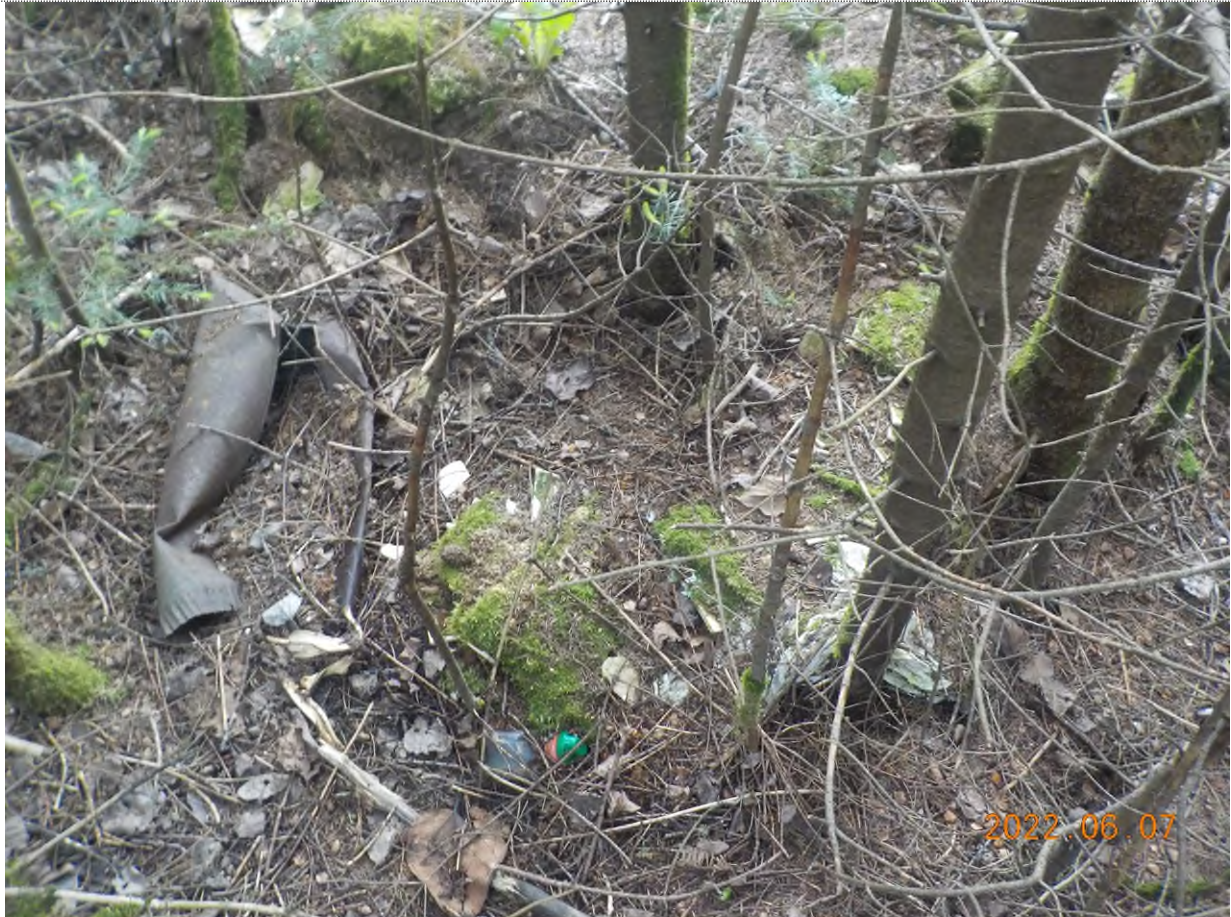
Figure 20: Débris à ramasser au point supplémentaire B