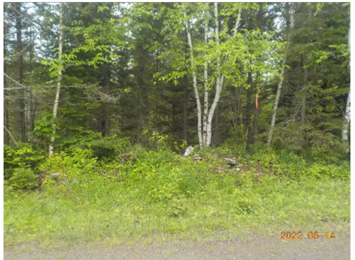
Figure 14: Emplacement des débris à ramasser