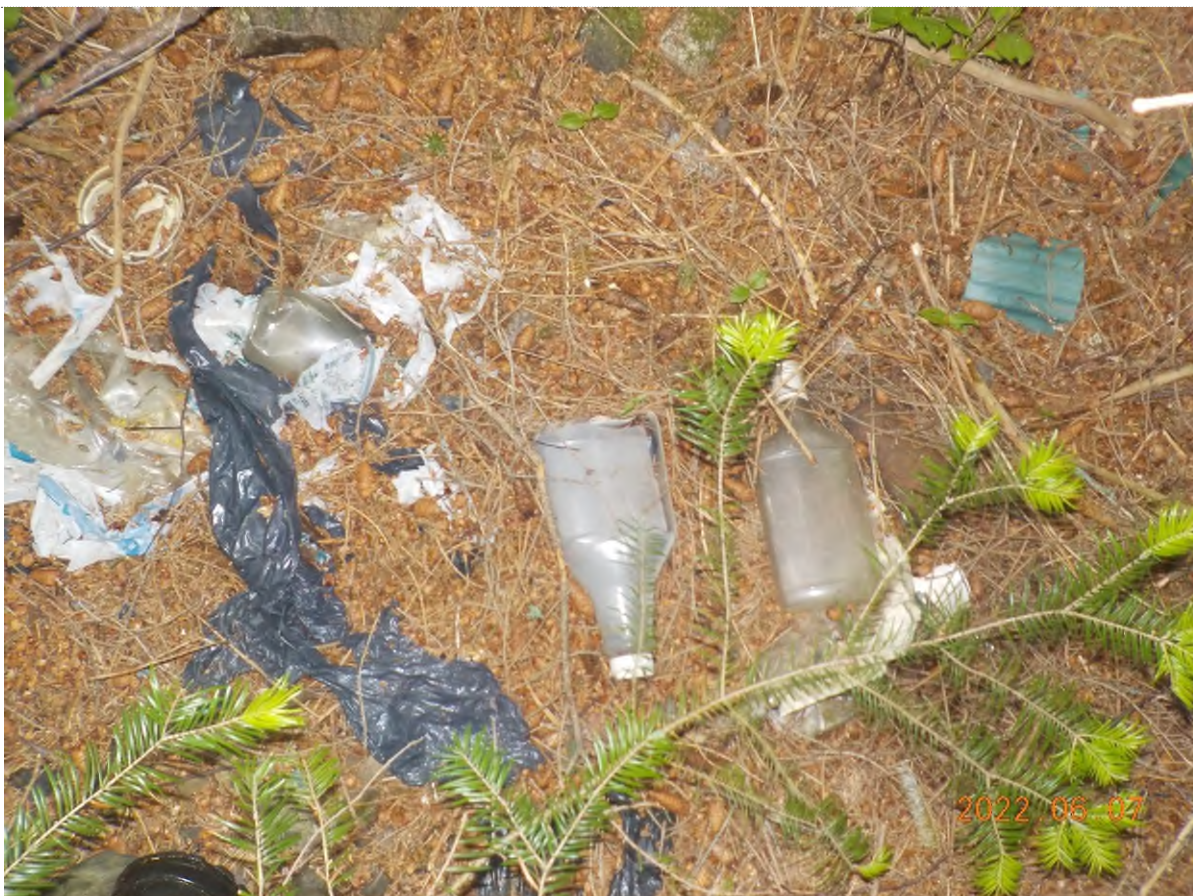
Figure 30: Déchets à ramasser sous matière végétale (pts suppl. C)