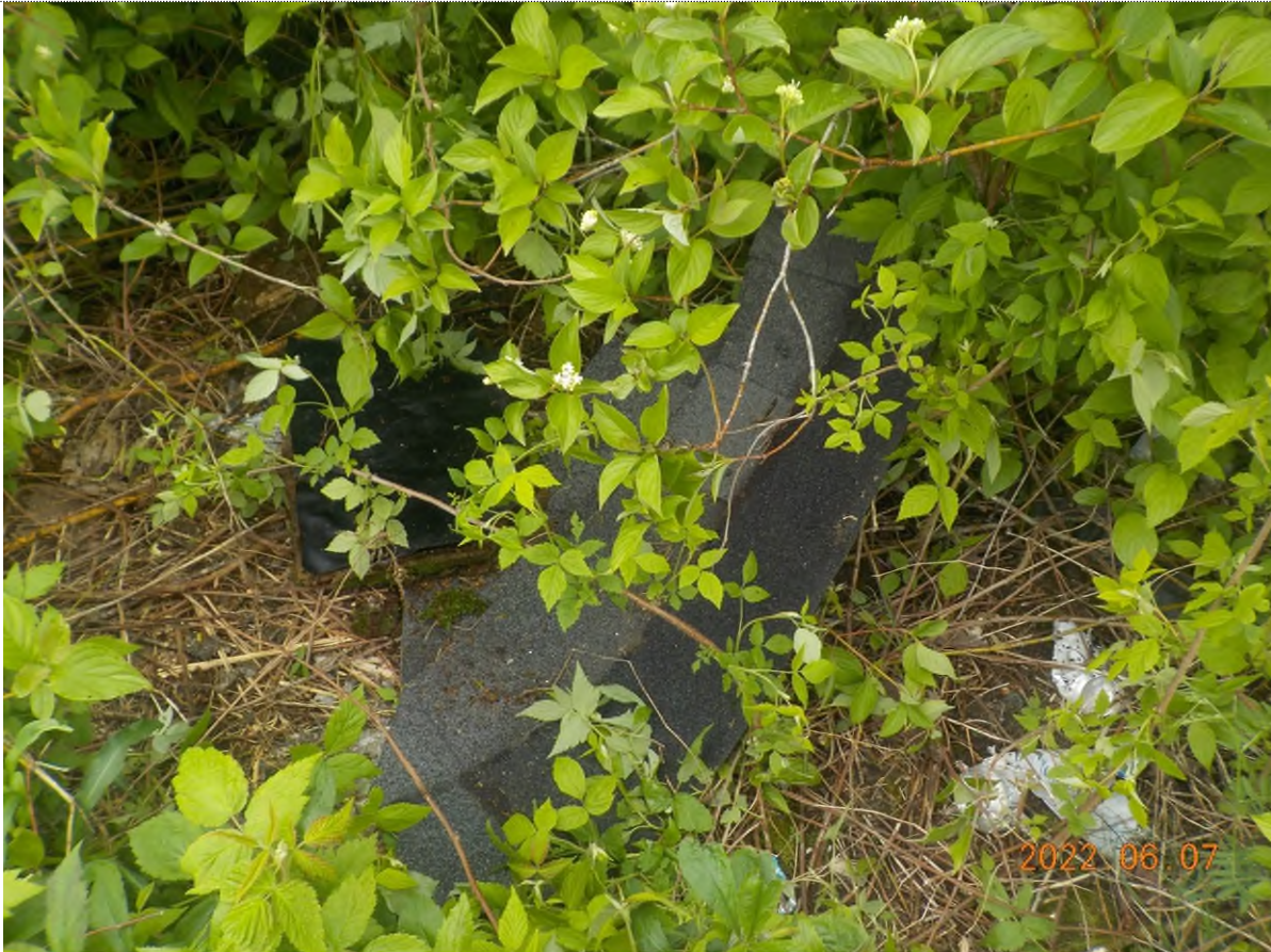
Figure 31: Déchets à ramasser (pts suppl. C)