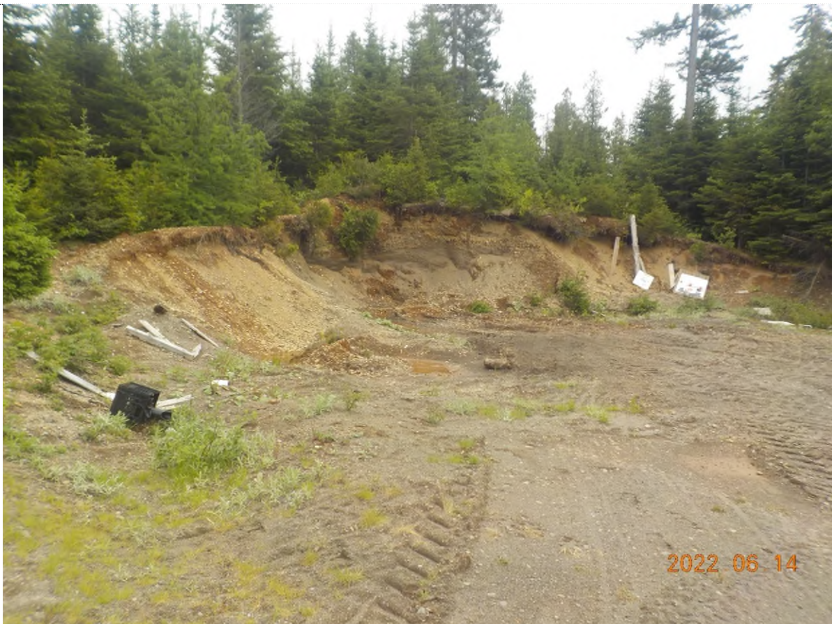
Figure 4: Emplacement des débris à ramasser