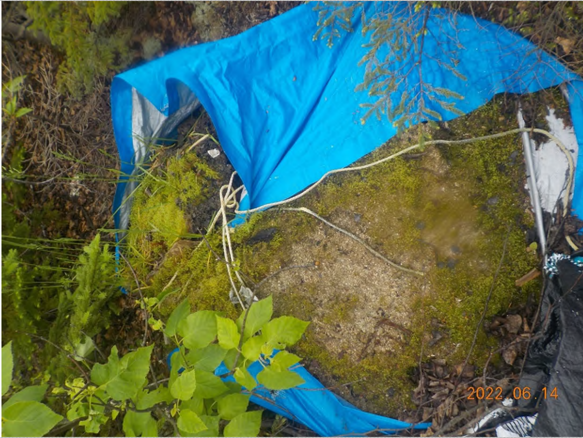
Figure 39: Ex. : Débris à ramasser du point supplémentaire J