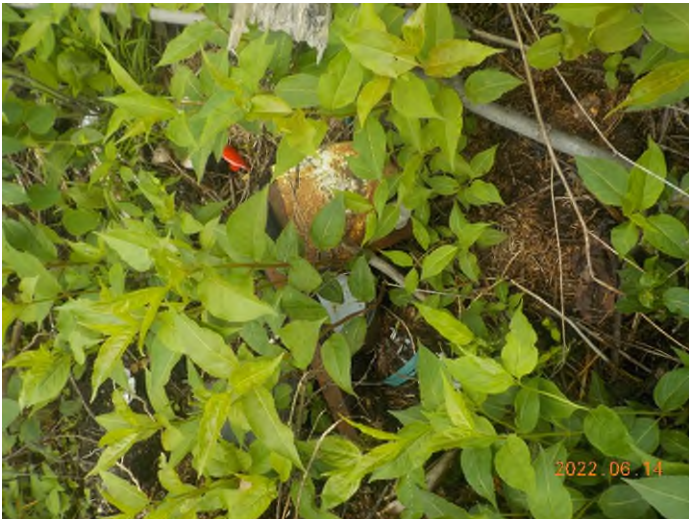
Figure 5: Débris à ramasser