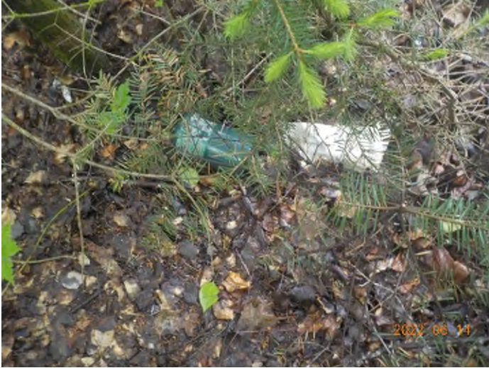
Figure 7: Débris à ramasser