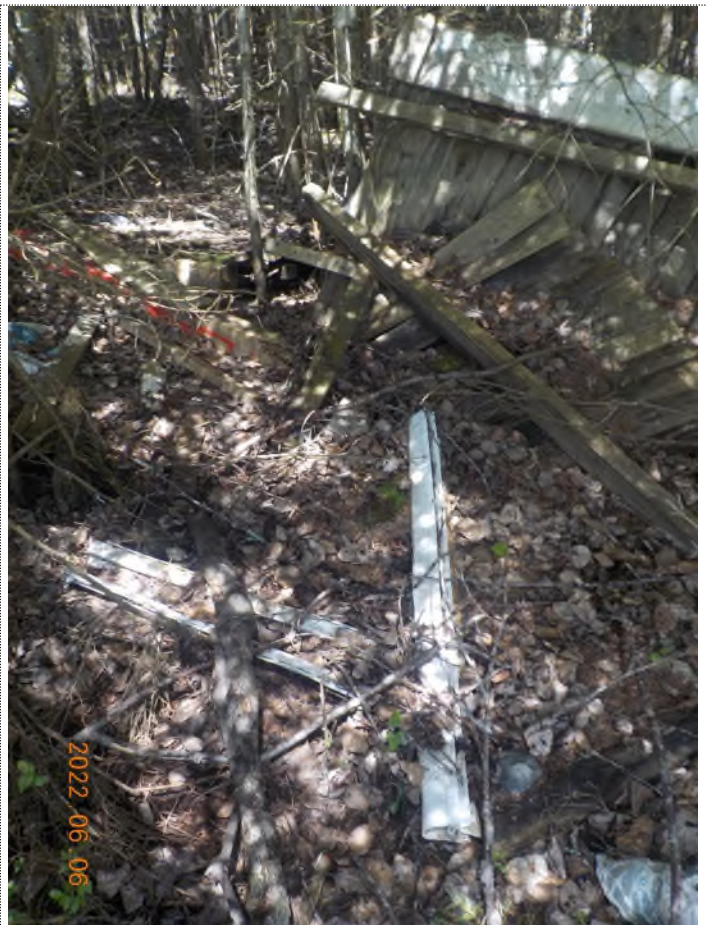
Figure 16: Débris à ramasser pts suppl. B