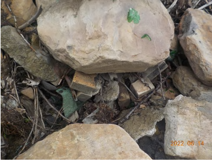
Figure 15: Débris à ramasser au point supplémentaire B