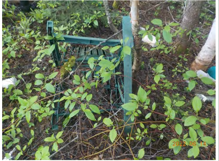
Figure 8: Débris à ramasser