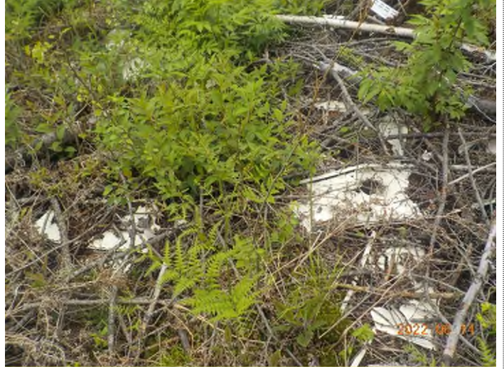
Figure 4: Débris à ramasser