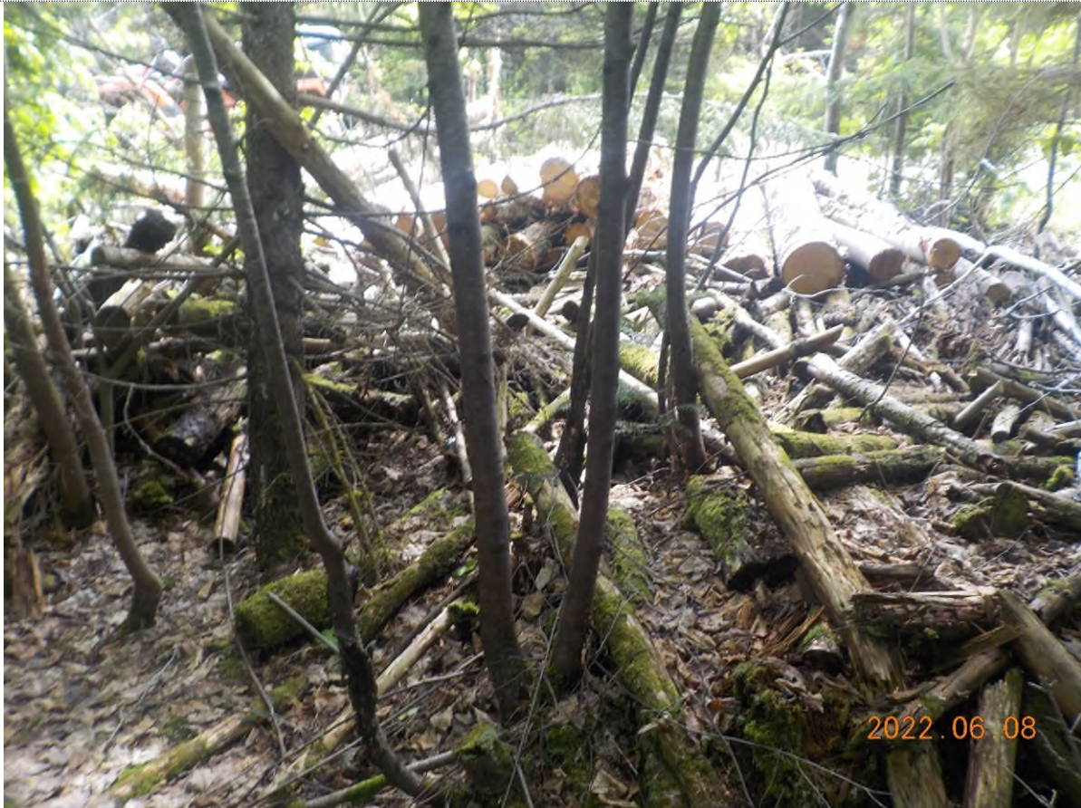
Figure 21: Vue du site point suppl. E