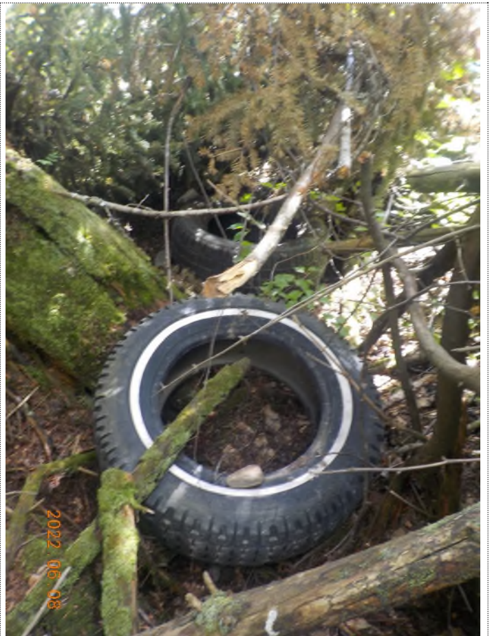
Figure 14: Débris à ramasser au point suppl. C