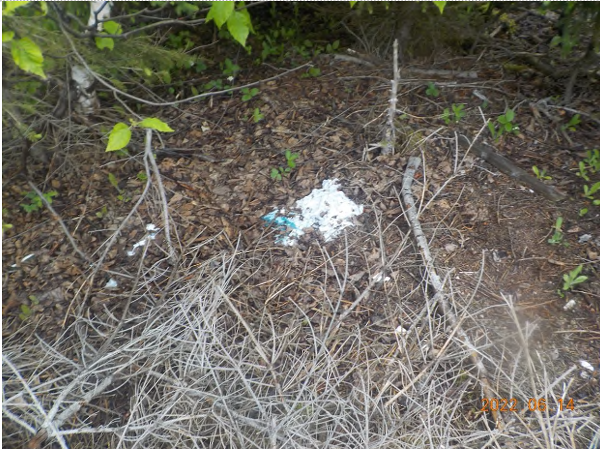
Figure 1: Débris à ramasser