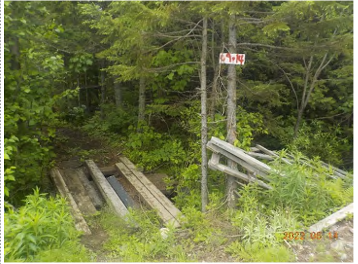
Figure 8: Débris à ramasser