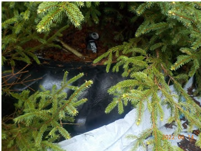
Figure 29: Débris à ramasser du point supplémentaire H