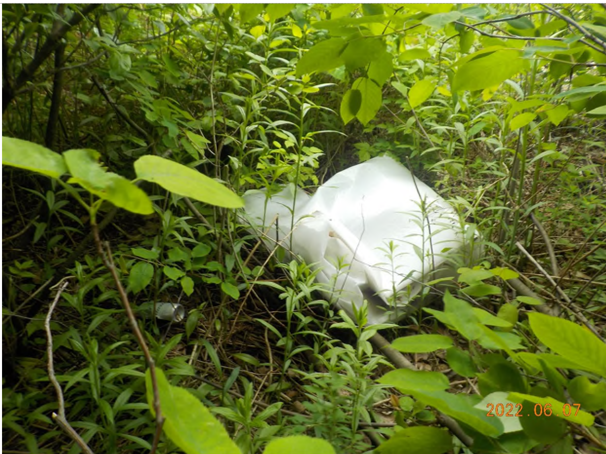
Figure 8: Déchets à ramasser dans le boisé