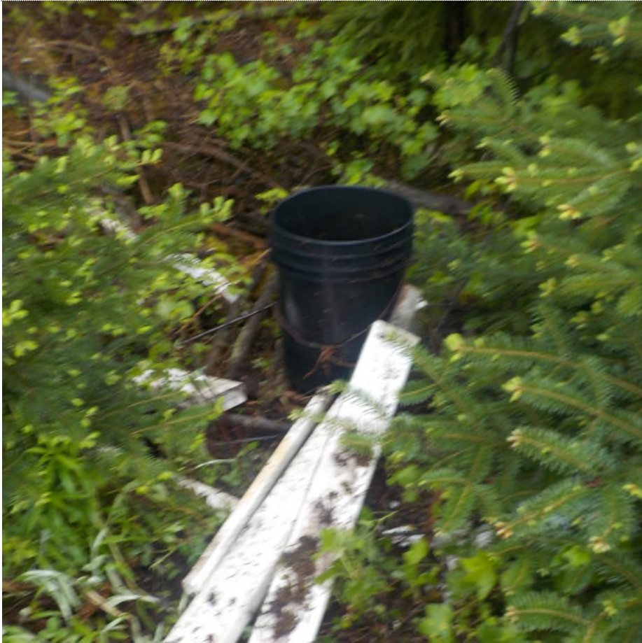
Figure 7: Débris à ramasser