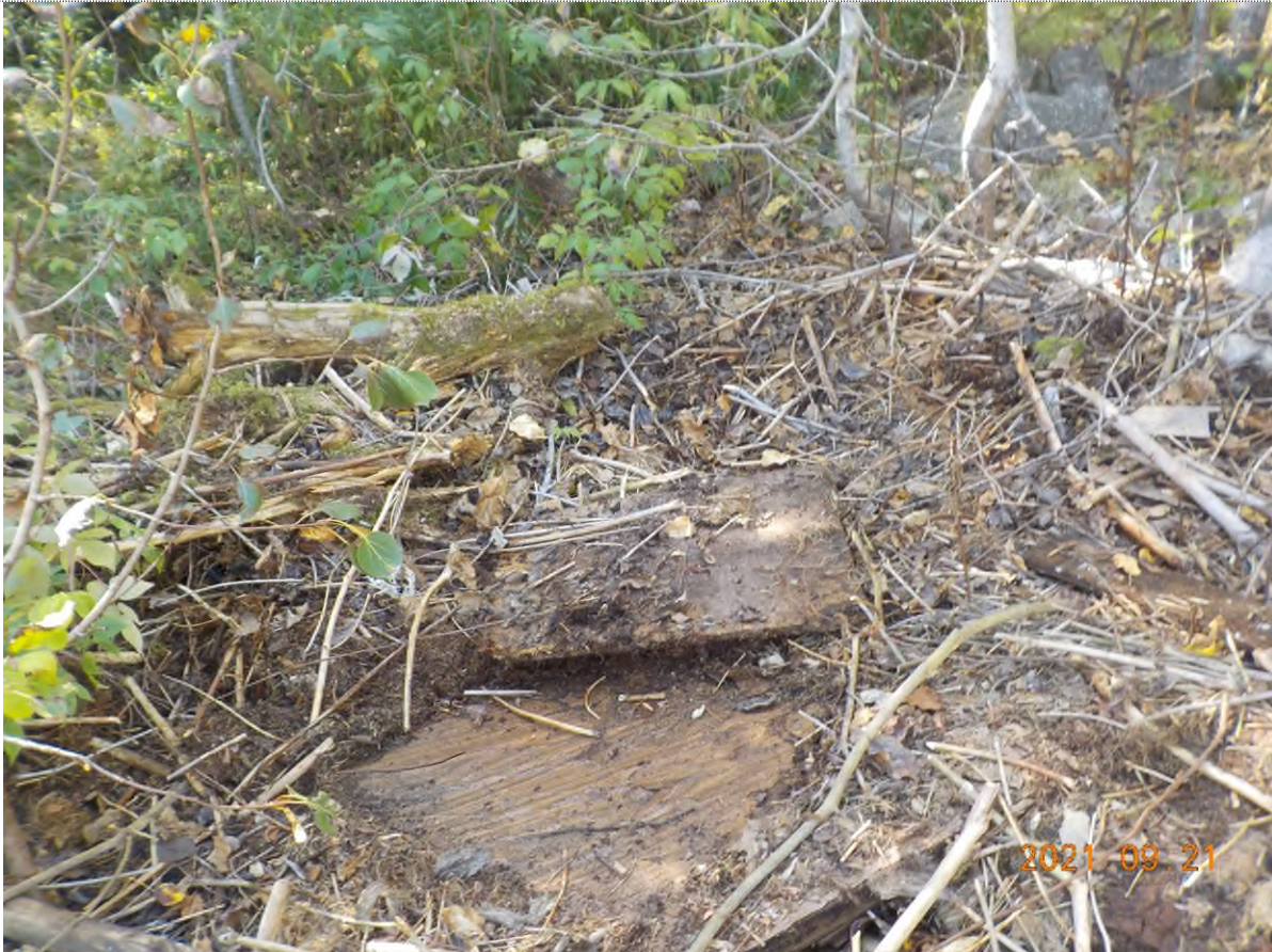
Figure 3: Vue des débris compacté sous la matière végétale