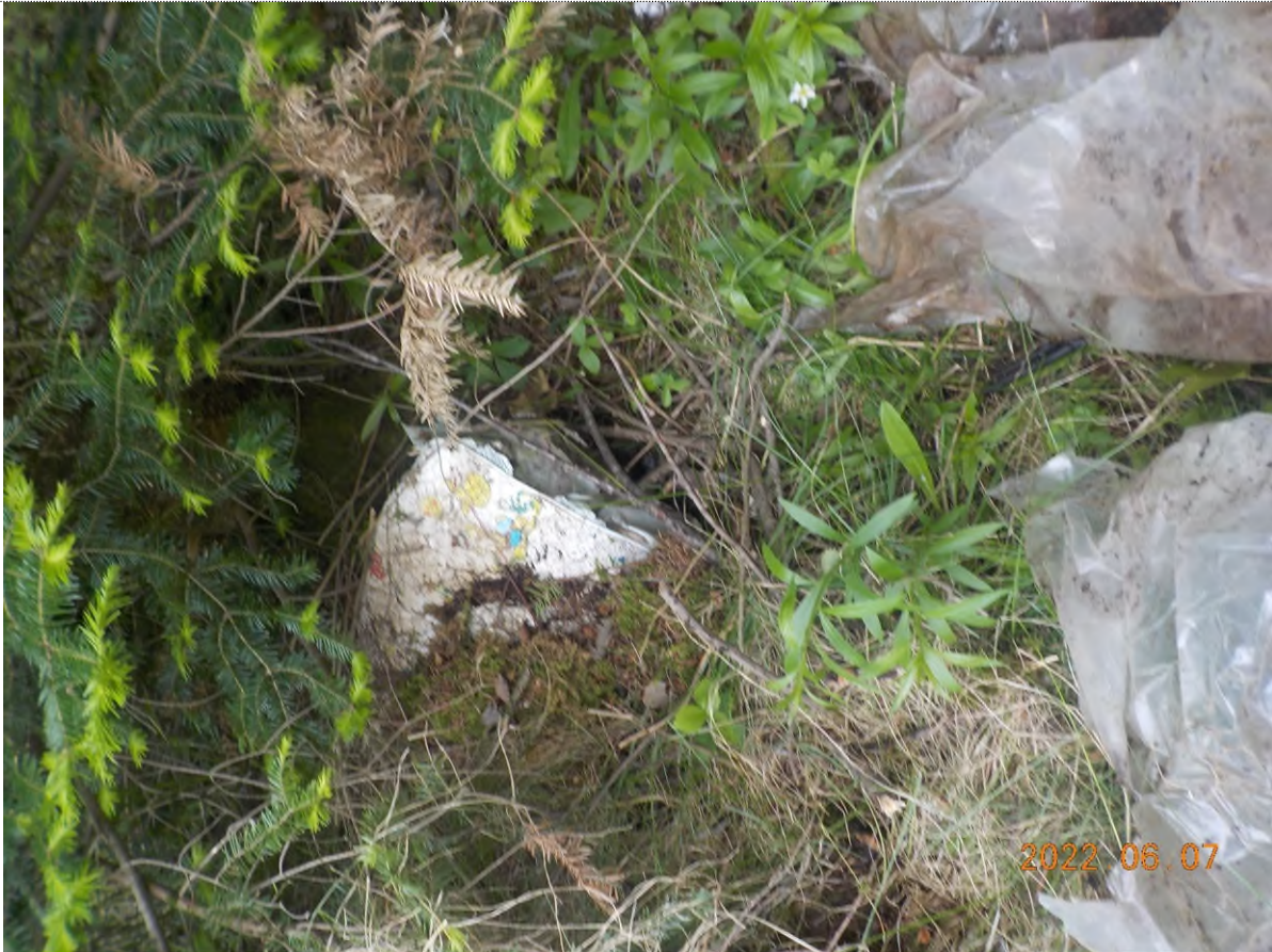
Figure 39: Déchets à ramasser (plastique, matelas pour enfant, métal) – pts suppl. D