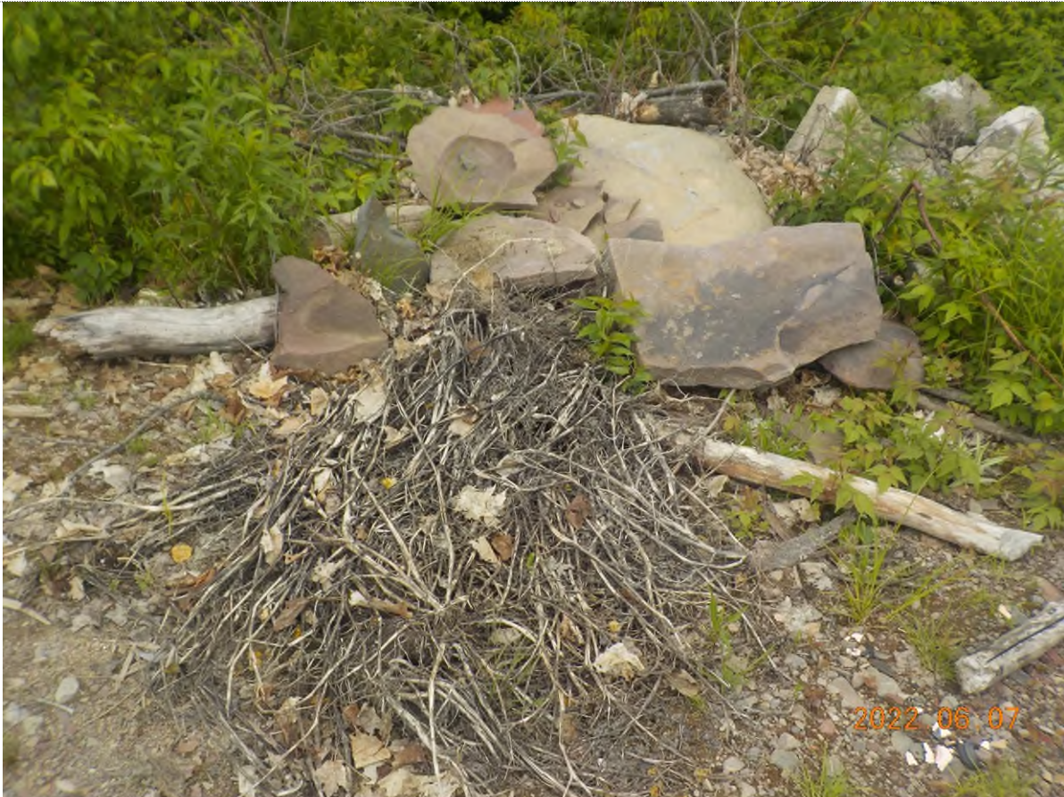
Figure 3: Matière végétale à ramasser