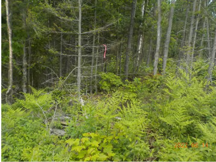
Figure 11: Débris à ramasser au point supplémentaire A