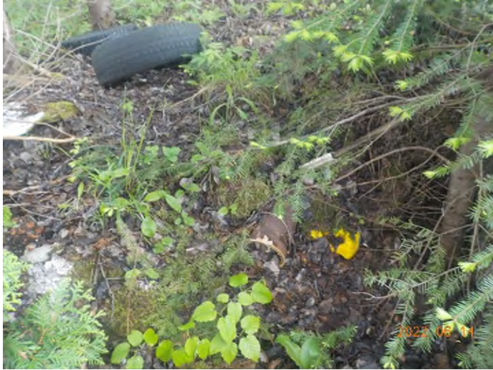
Figure 11: Débris à ramasser