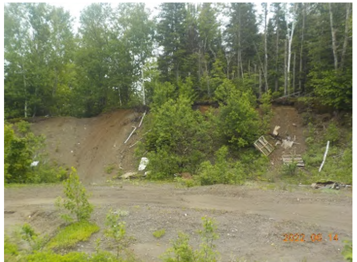
Figure 41: Emplacement des débris à ramasser au point supplémentaire F