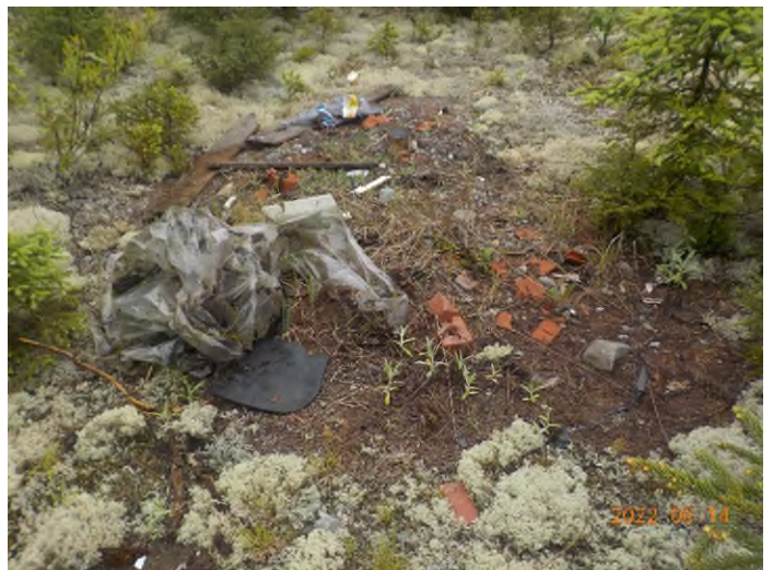
Figure 22: Débris à ramasser du point supplémentaire E