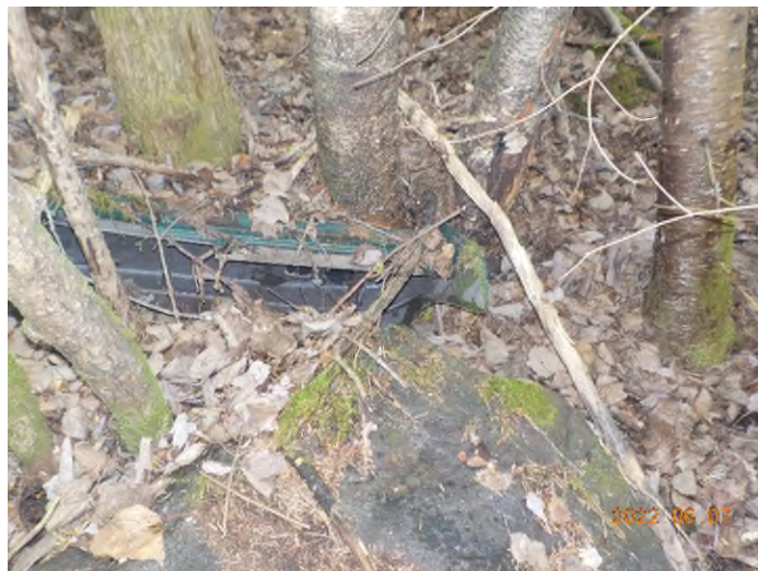
Figure 18: Pièces de voiture enfouis à ramasser (pts suppl.A)