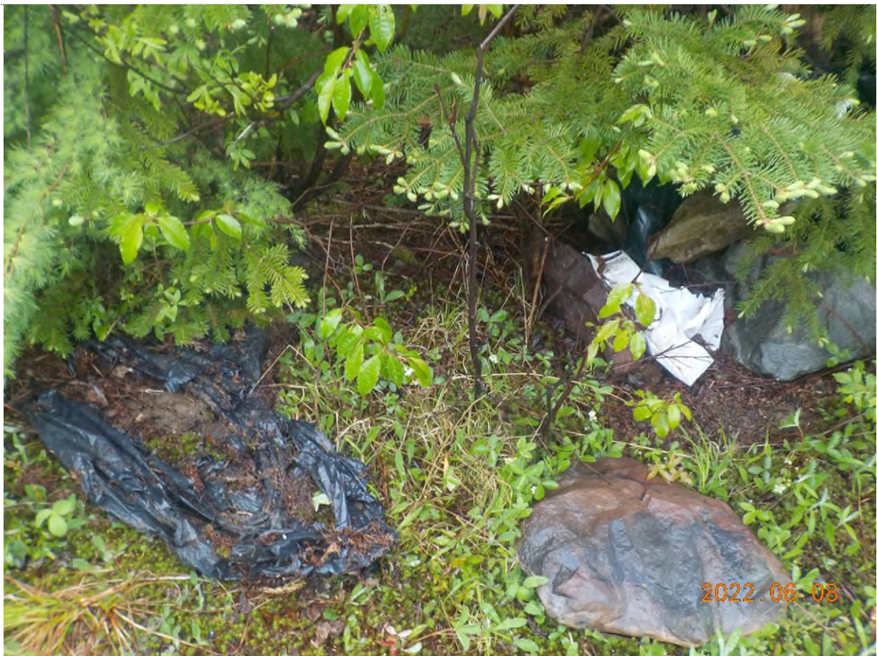
Figure 2: Débris à ramasser