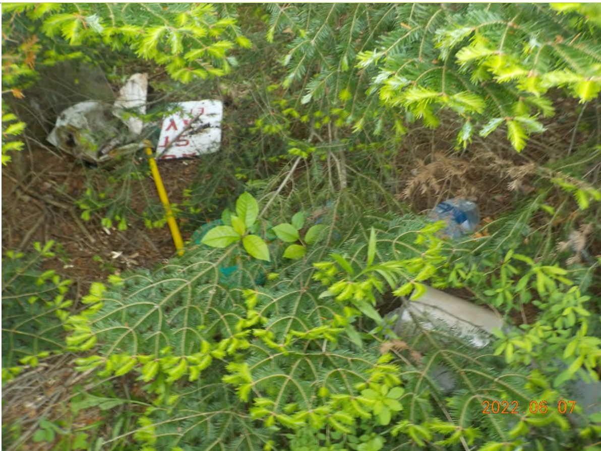
Figure 4: Déchets à ramasser sous les branches