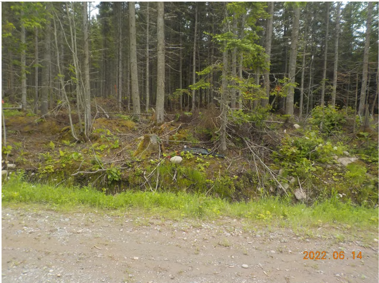
Figure 4: Emplacement des débris à ramasser