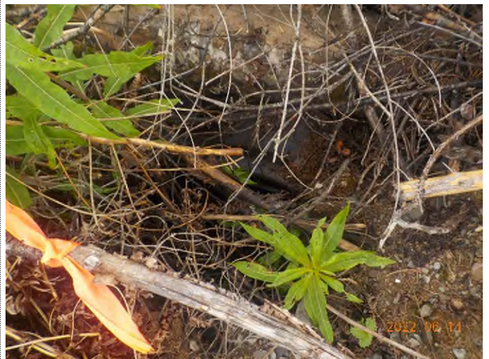
Figure 14: Débris à ramasser enfouis sous les talus