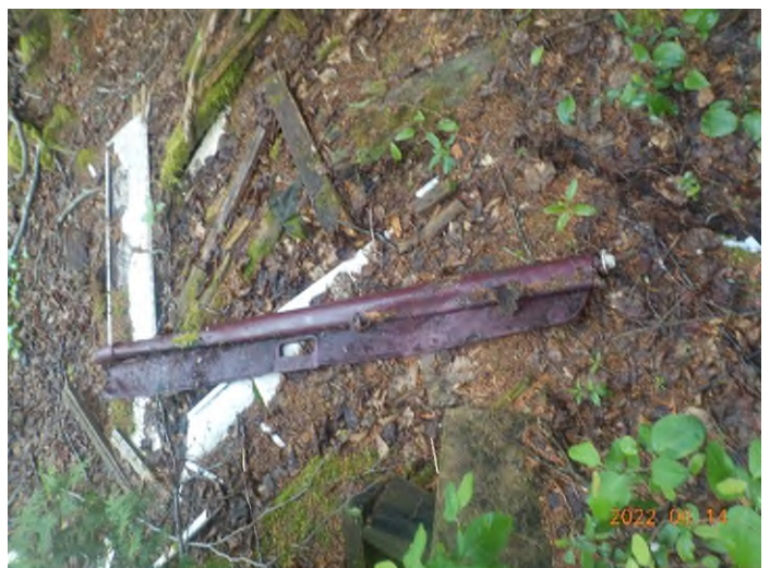
Figure 34: Débris à ramasser du point supplémentaire I