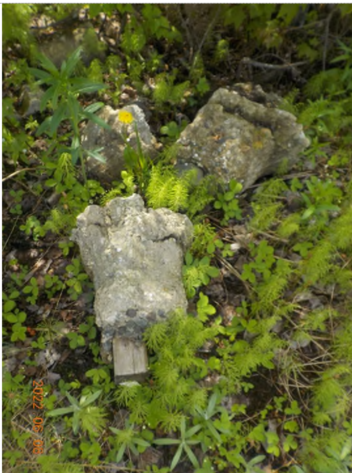
Figure 2: Débris à ramasser au point principal