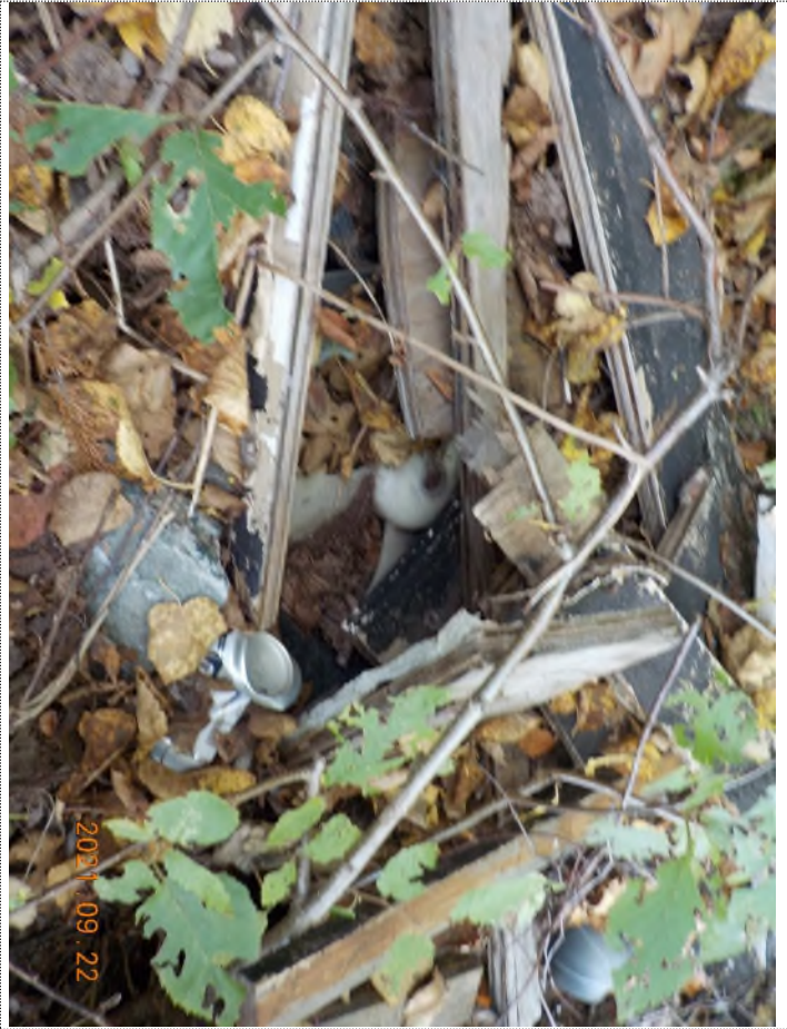
Figure 24: Débris à ramasser au point suppl. E