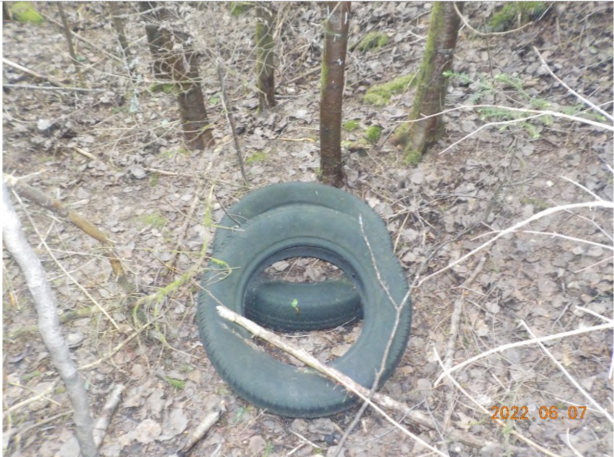
Figure 25: Pneus à ramasser au point supplémentaire C