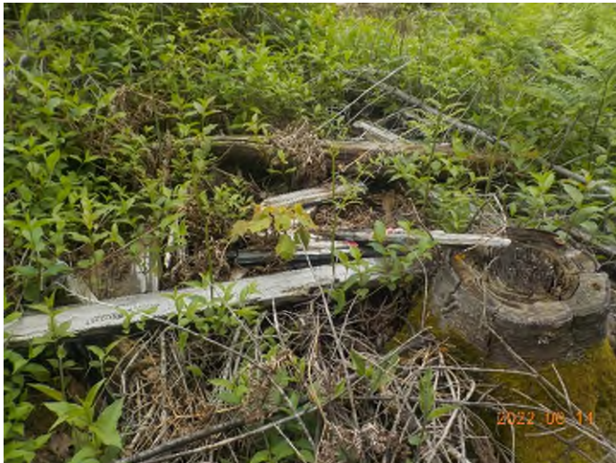
Figure 9: Débris à ramasser au point supplémentaire A