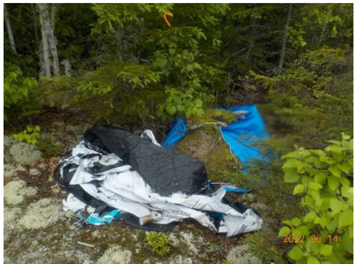
Figure 38: Débris à ramasser du point supplémentaire J