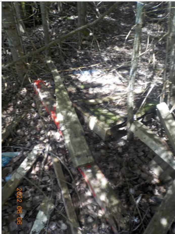
Figure 15: Débris à ramasser pts suppl. B