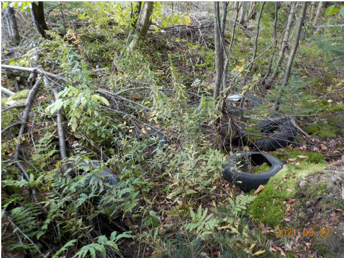
Figure 4: Débris à ramasser aux points suppl. A-B