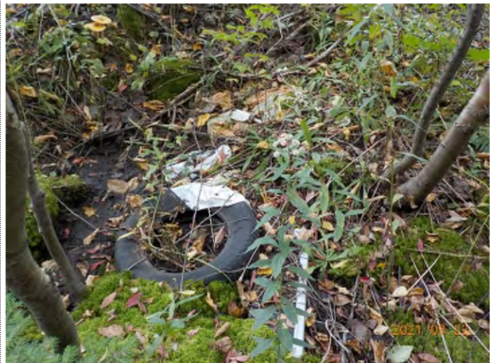
Figure 10: Débris à ramasser aux points suppl. A-B