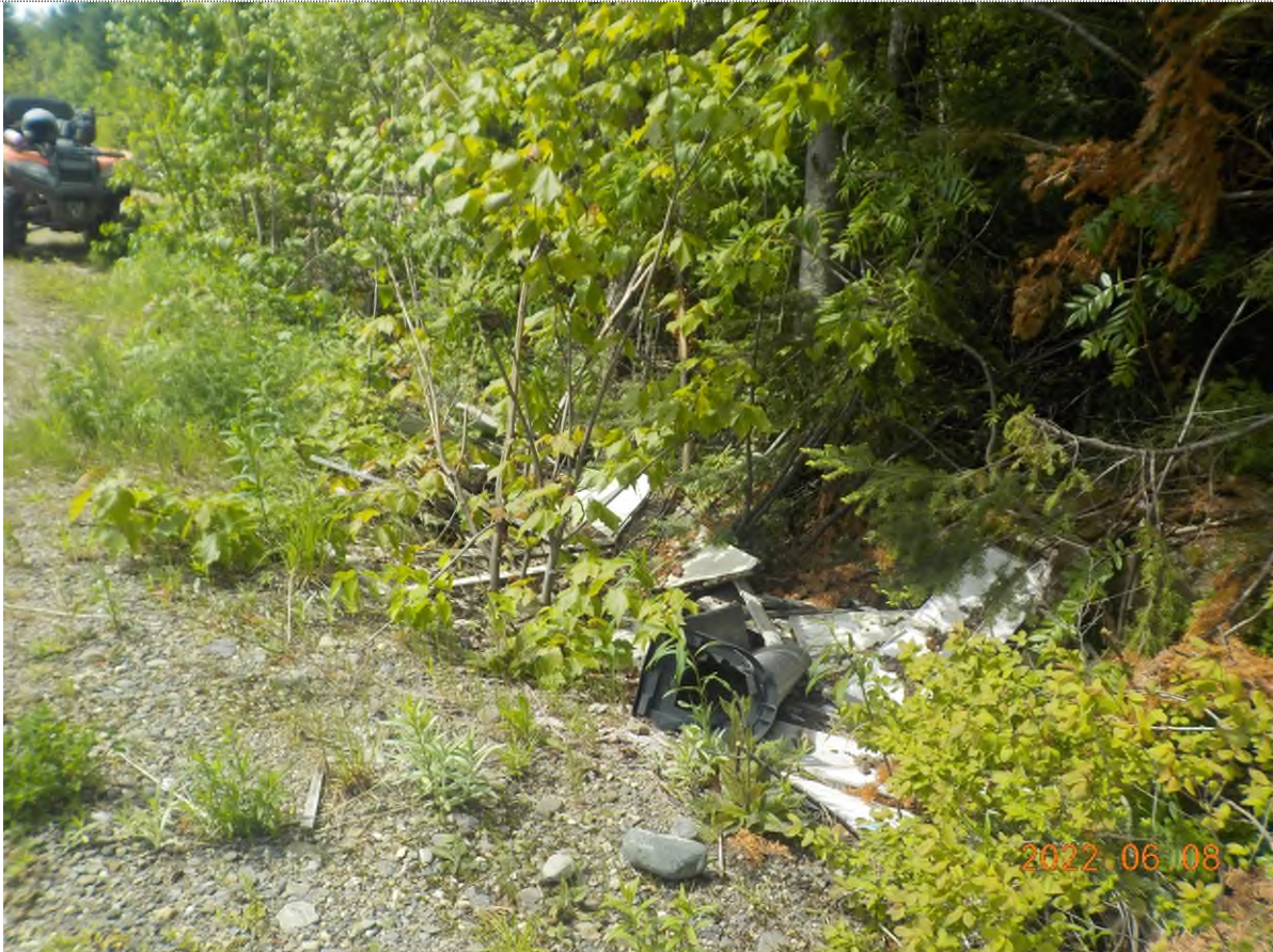
Figure 17: Vue du site point suppl. D