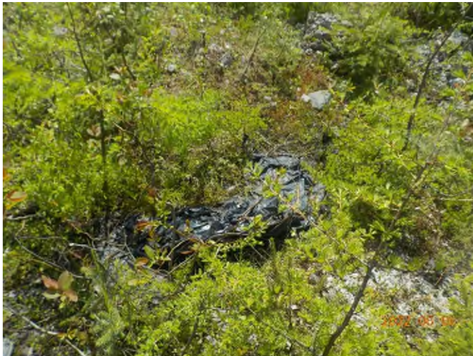
Figure 7: Débris à ramasser