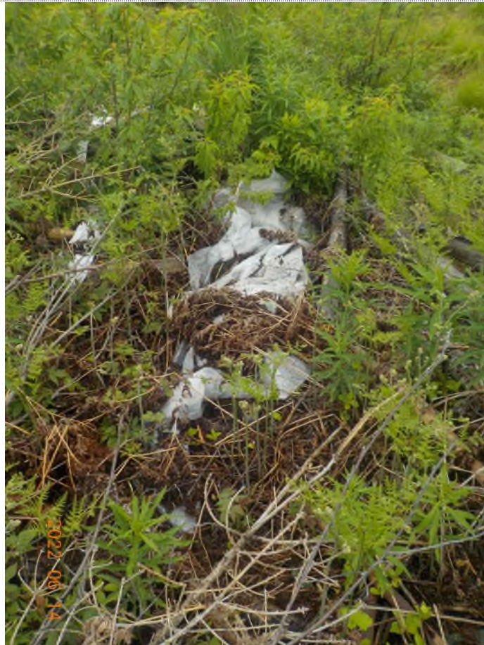
Figure 10: Débris à ramasser (enfouis dans le sol)