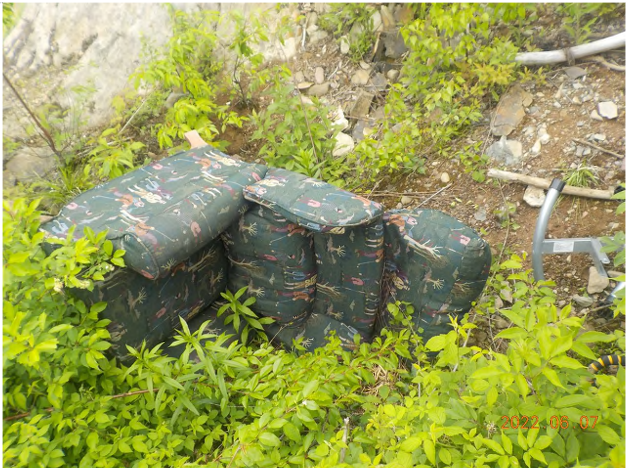
Figure 4: Fauteuil à ramasser au point supplémentaire A