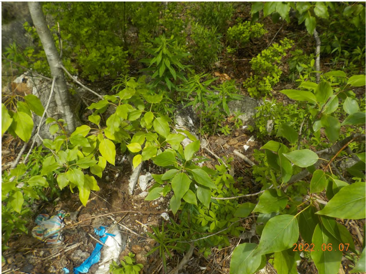
Figure 8: Débris à ramasser sur le site principal