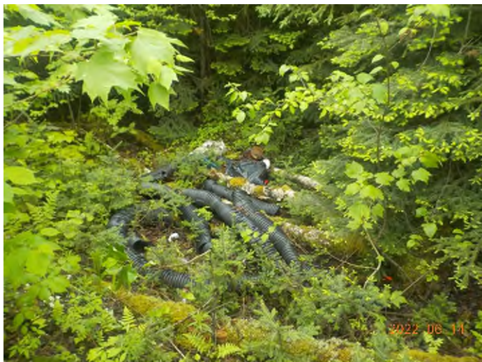
Figure 32: Débris à ramasser au point supplémentaire E