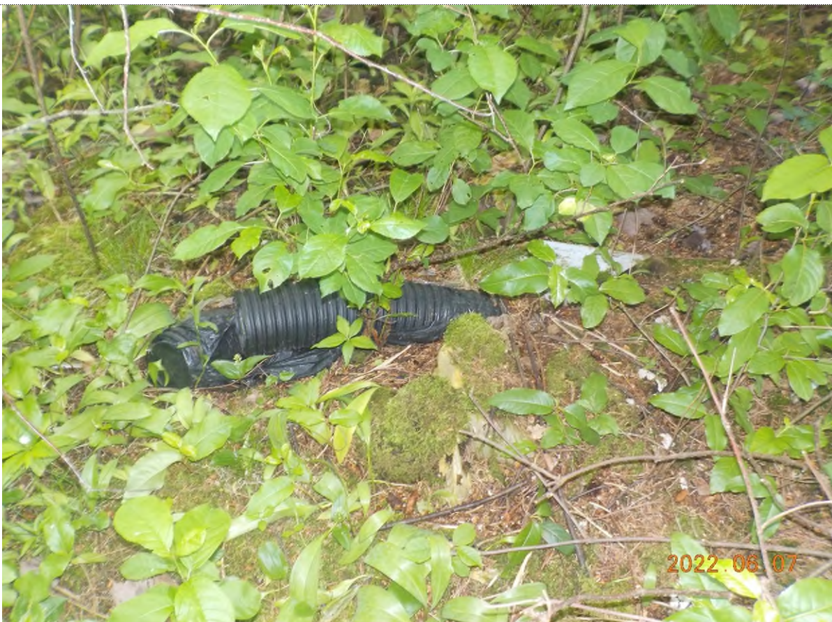
Figure 26: Déchets à ramasser (pts suppl.C)