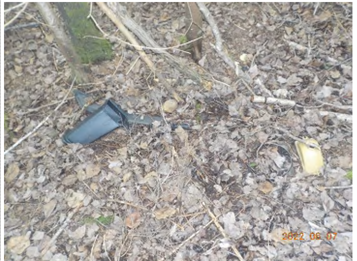
Figure 19: Pièces de voiture enfouis à ramasser (pts suppl.A)