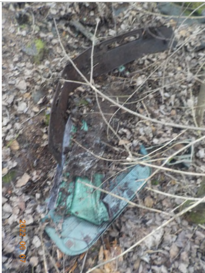
Figure 14: Pièces de voiture enfouis à ramasser (pts suppl.A)