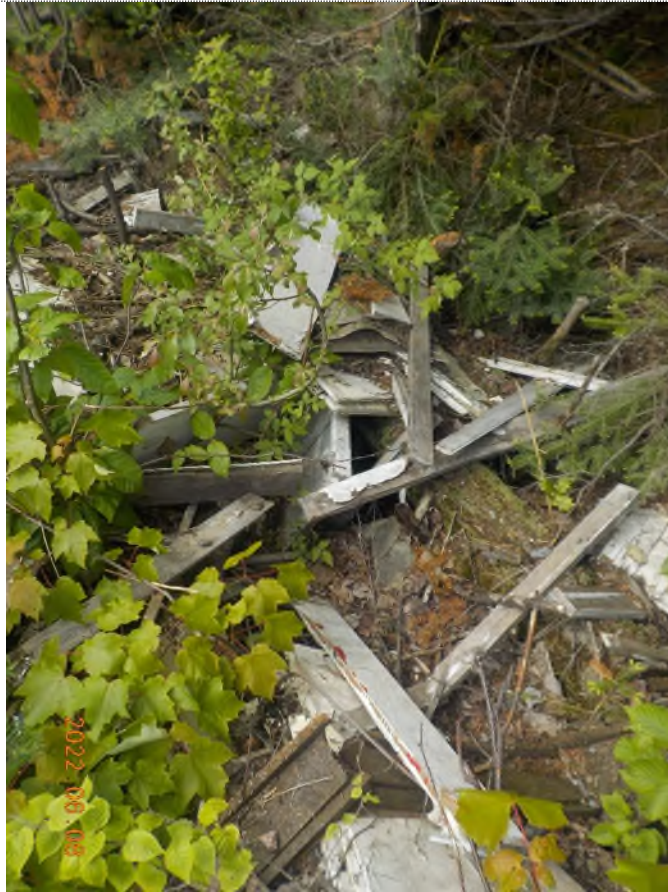
Figure 19: Vue du site point suppl. D