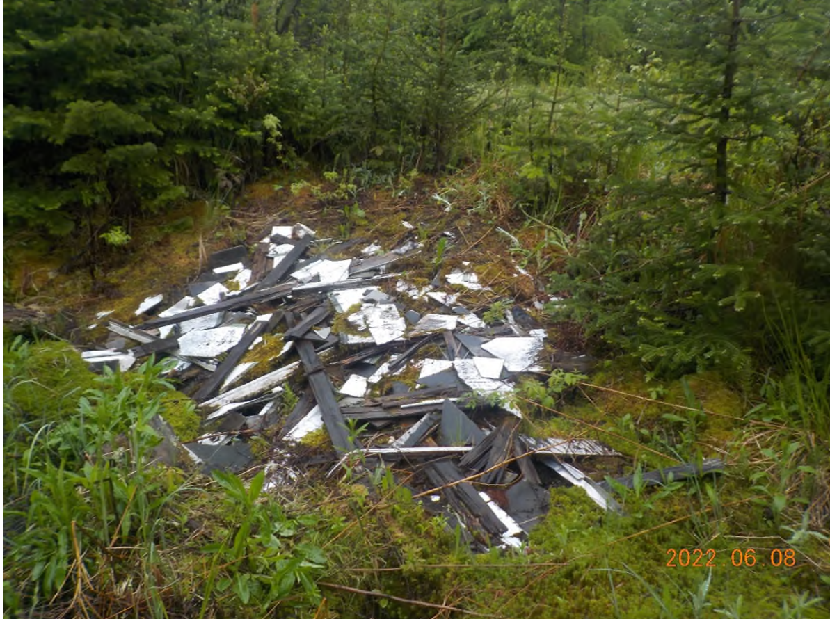
Figure 1: Débris à ramasser