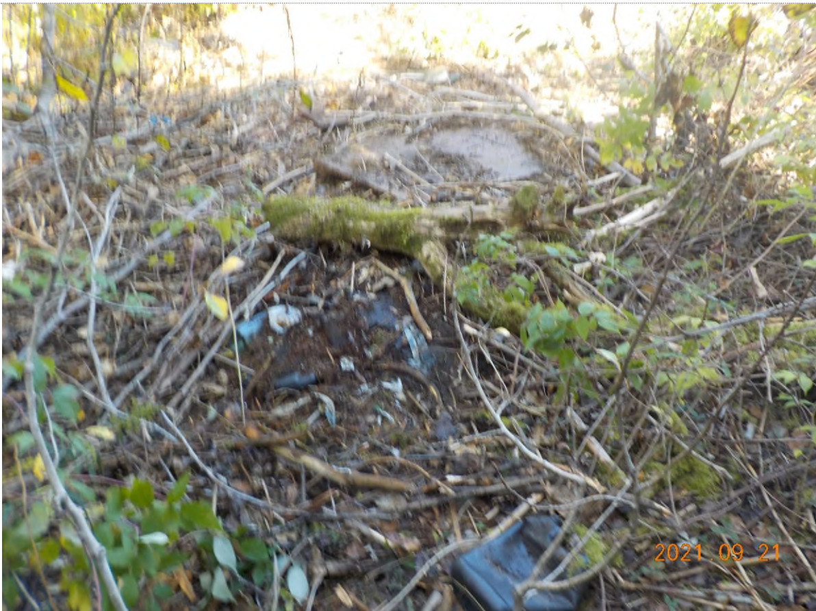
Figure 4: Vue des débris compacté sous la matière végétale (idée de l'épaisseur)