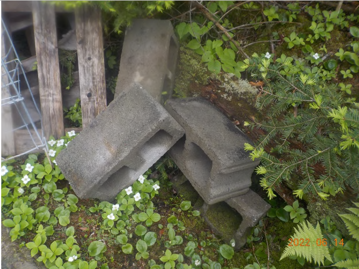
Figure 3: Débris à ramasser