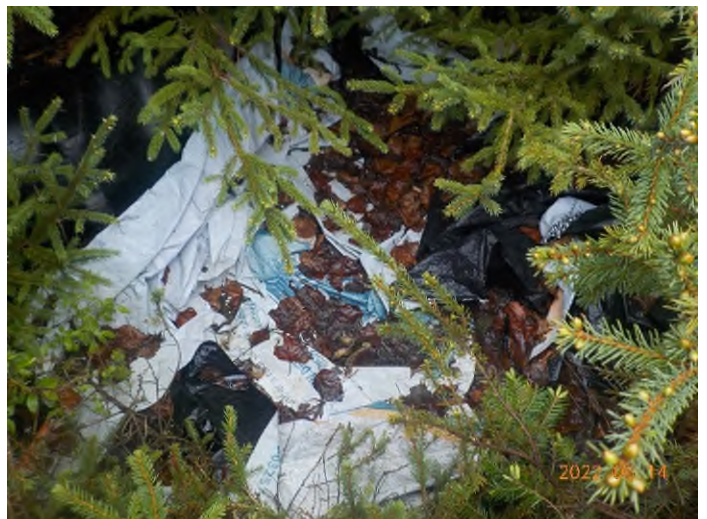
Figure 30: Débris à ramasser du point supplémentaire H