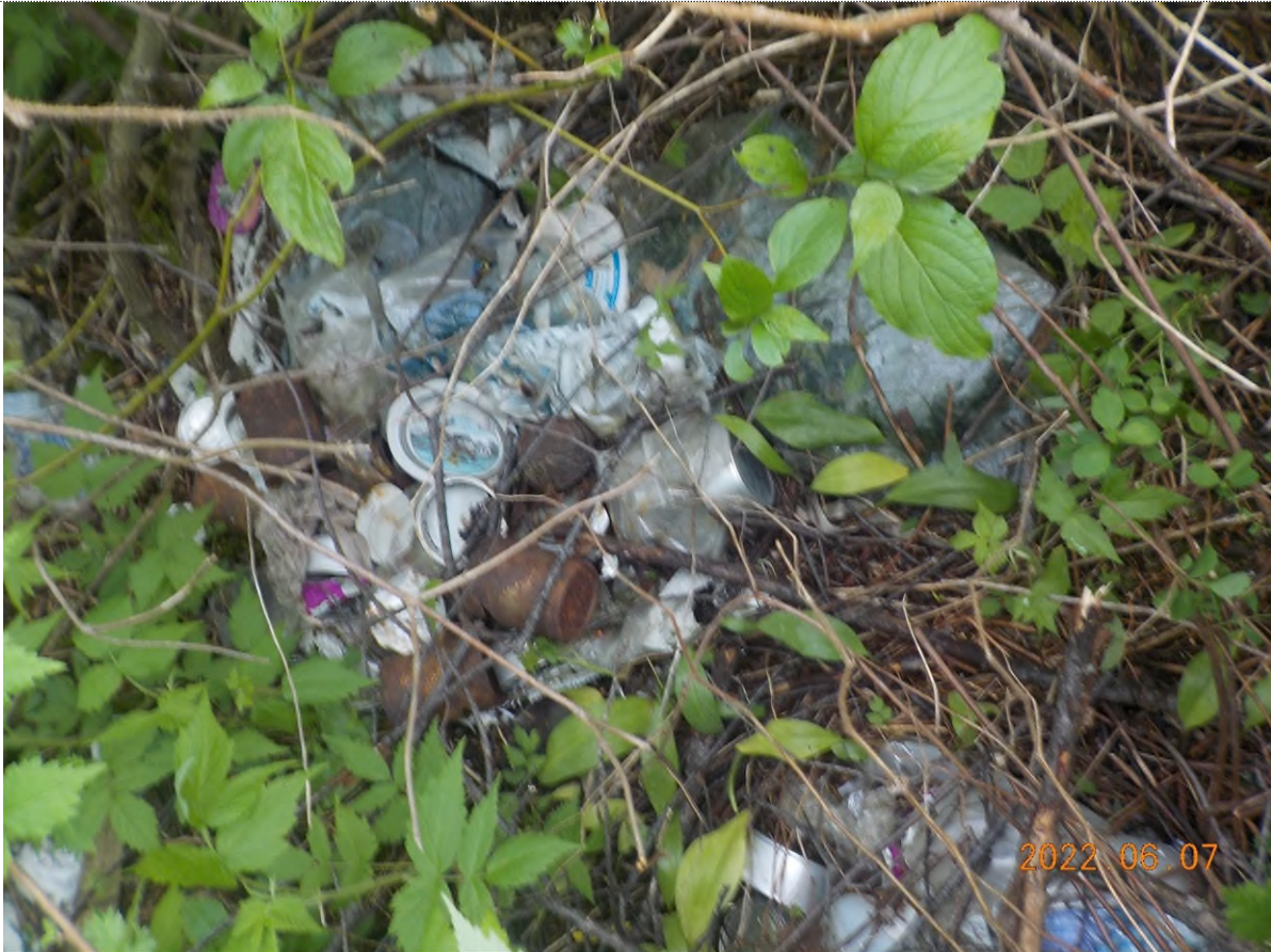
Figure 25: Déchets à ramasser (pts suppl.C)