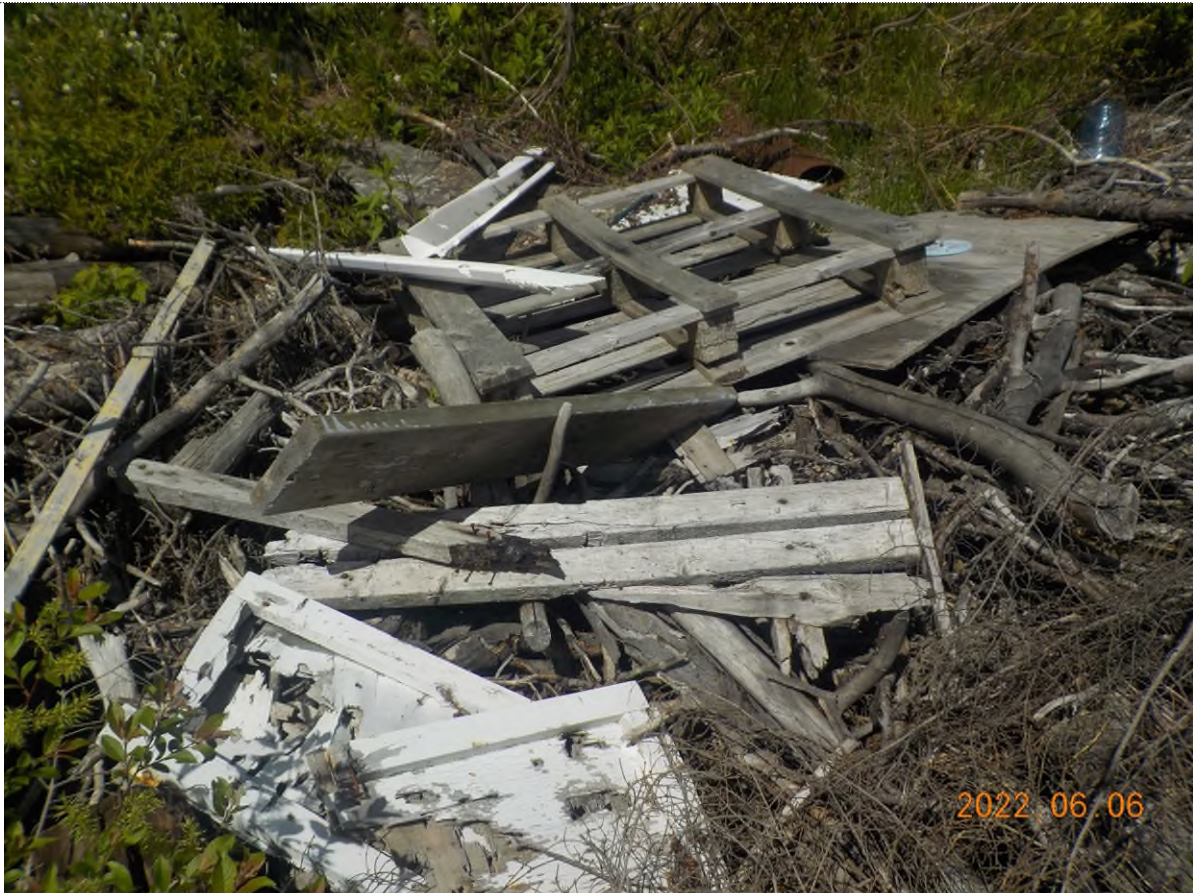
Figure 3: Débris à ramasser