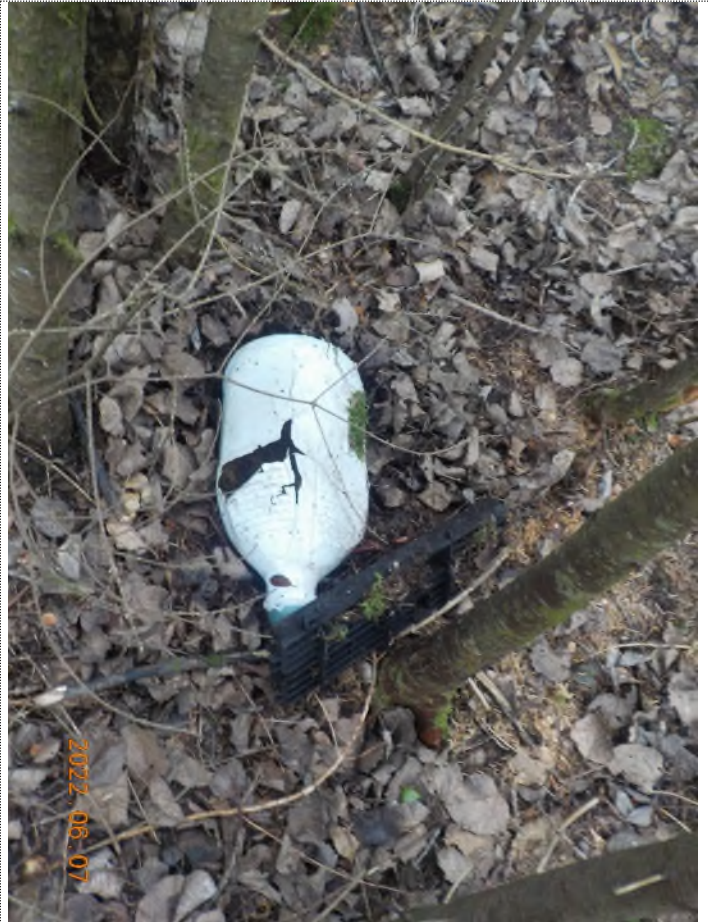
Figure 24: Débris à ramasser au point supplémentaire B