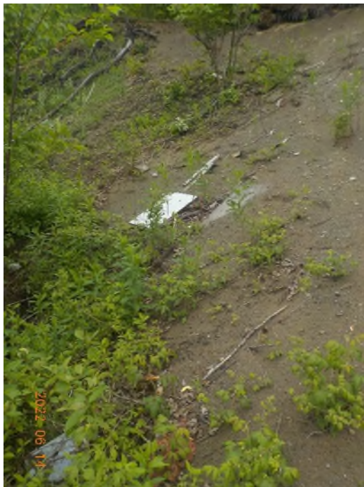
Figure 50: Débris à ramasser au point supplémentaire F