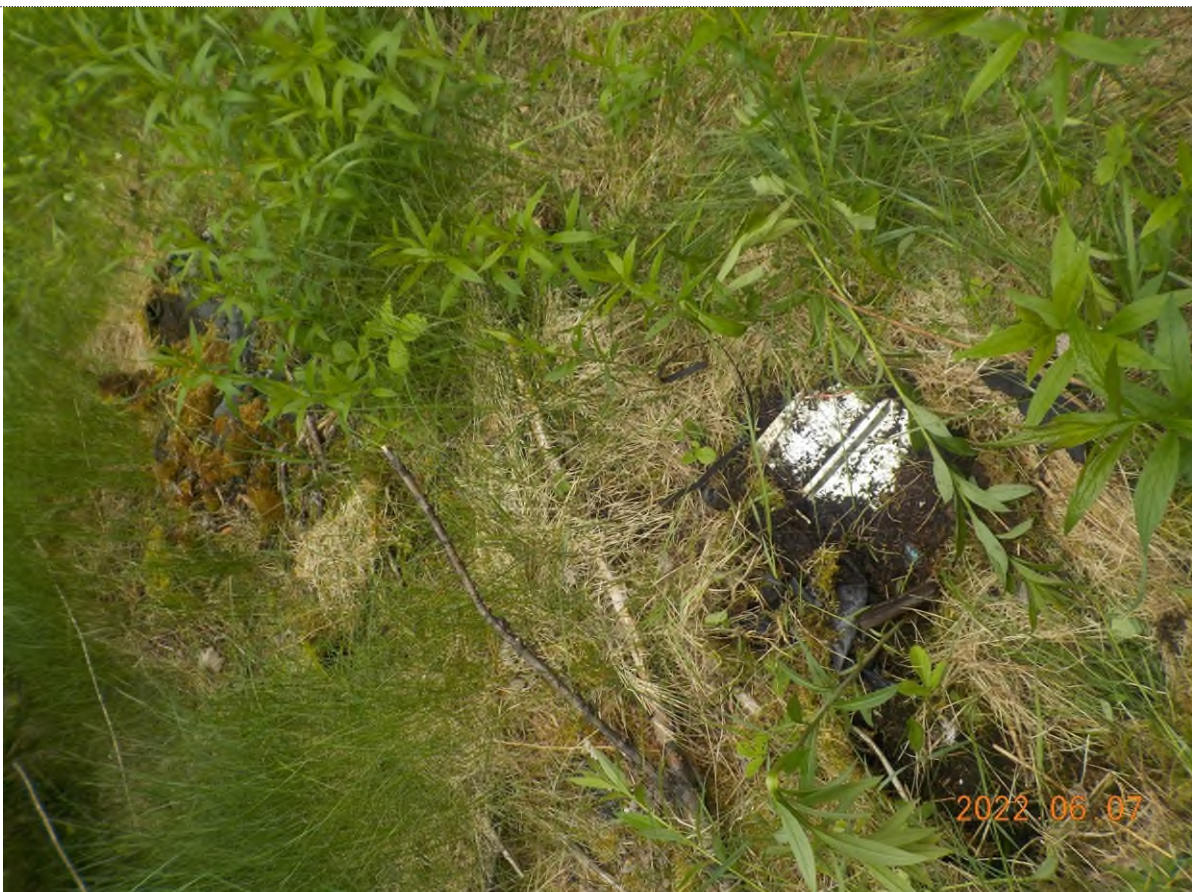
Figure 38: Vue rapprochée des déchets à ramasser sous matière végétale (pts suppl. D)