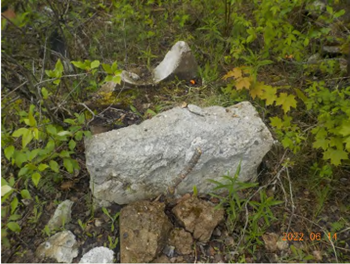
Figure 3: Débris à ramasser