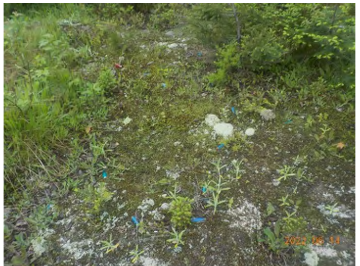
Figure 14: Débris à ramasser du point supplémentaire C