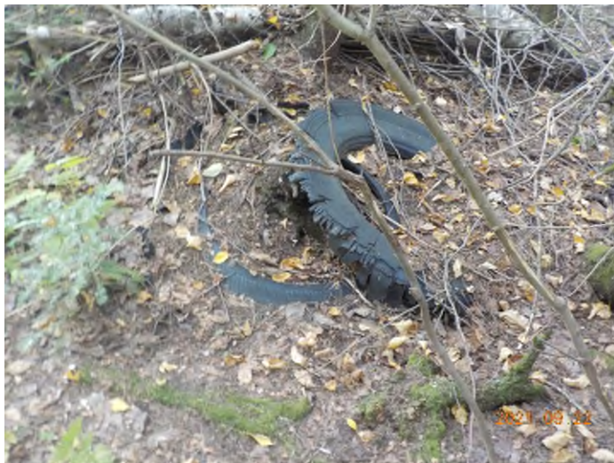
Figure 32: Débris à ramasser aux points supplémentaires J et K