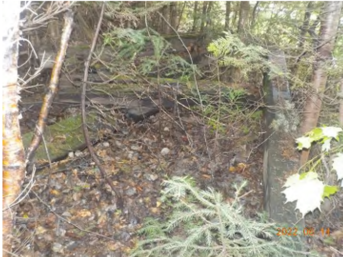
Figure 33: Débris à ramasser au point supplémentaire E