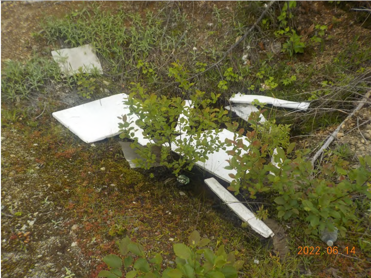
Figure 5: Débris à ramasser