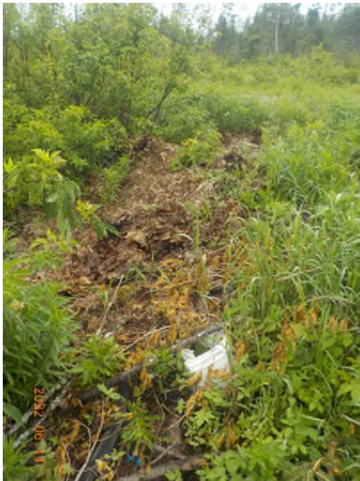
Figure 5: Débris à ramasser sous matières végétale et branches