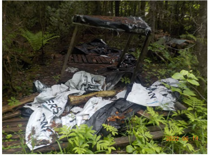
Figure 4: Débris à ramasser