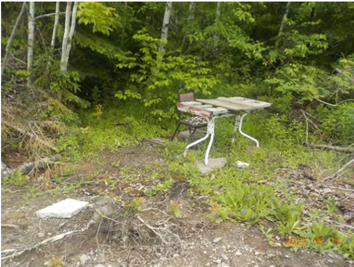
Figure 9: Débris à ramasser au point supplémentaire A