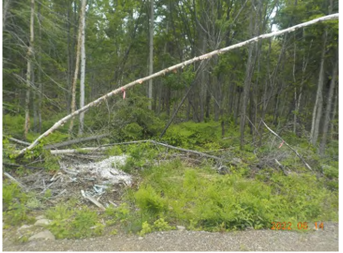
Figure 12: Débris à ramasser au point supplémentaire B