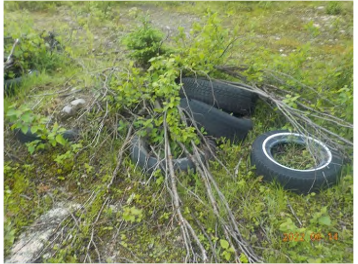
Figure 12: Débris à ramasser du point supplémentaire C