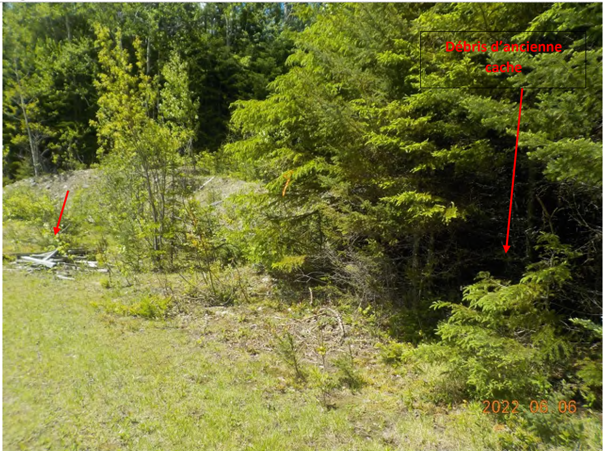
Figure 10: Emplacement des débris à ramasser du point supplémentaire B