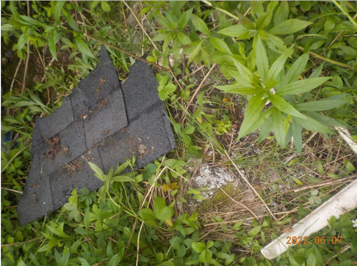
Figure 33: Déchets à ramasser (pts suppl. C)