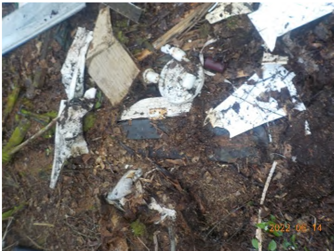
Figure 37: Débris à ramasser du point supplémentaire I