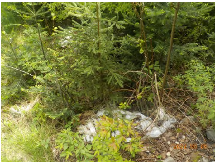
Figure 13: Débris à ramasser pts suppl. A