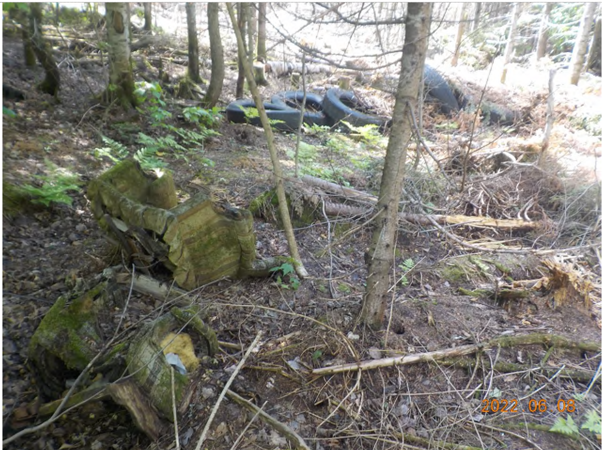
Figure 30: Débris à ramasser aux points supplémentaires J et K