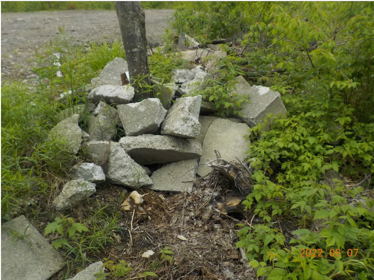
Figure 1: Blocs de béton à ramasser