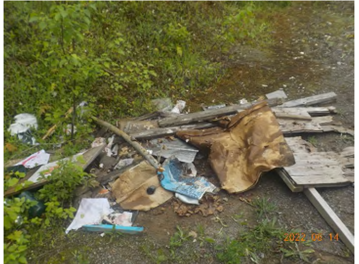
Figure 34: Débris à ramasser au point supplémentaire F