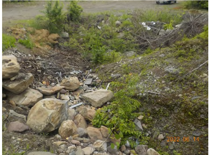
Figure 12: Débris à ramasser au point supplémentaire B