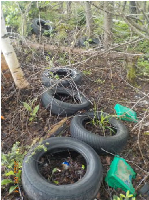
Figure 9: Débris à ramasser