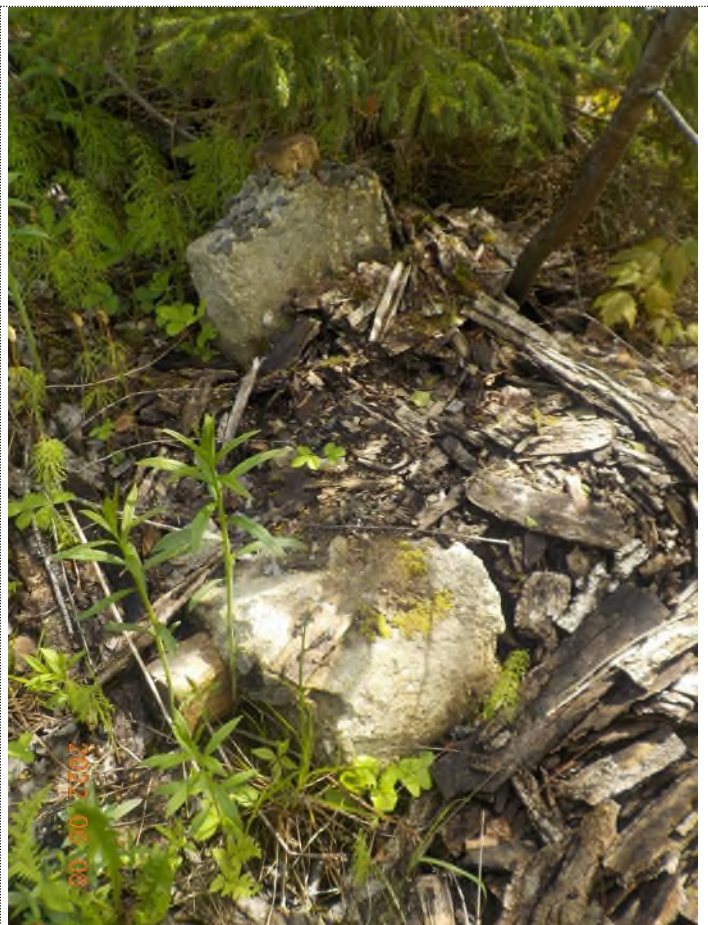
Figure 3: Débris à ramasser au point principal