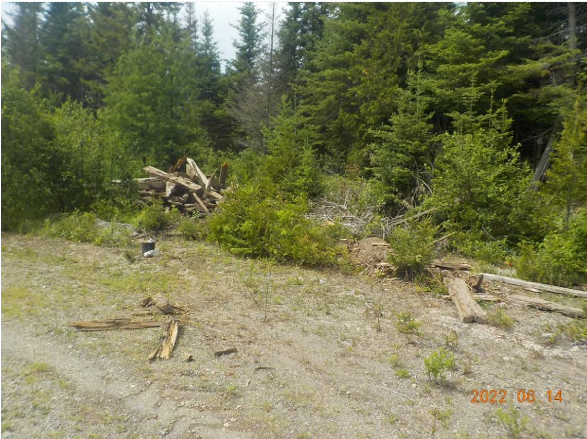
Figure 30: Emplacement des débris à ramasser du point supplémentaire B