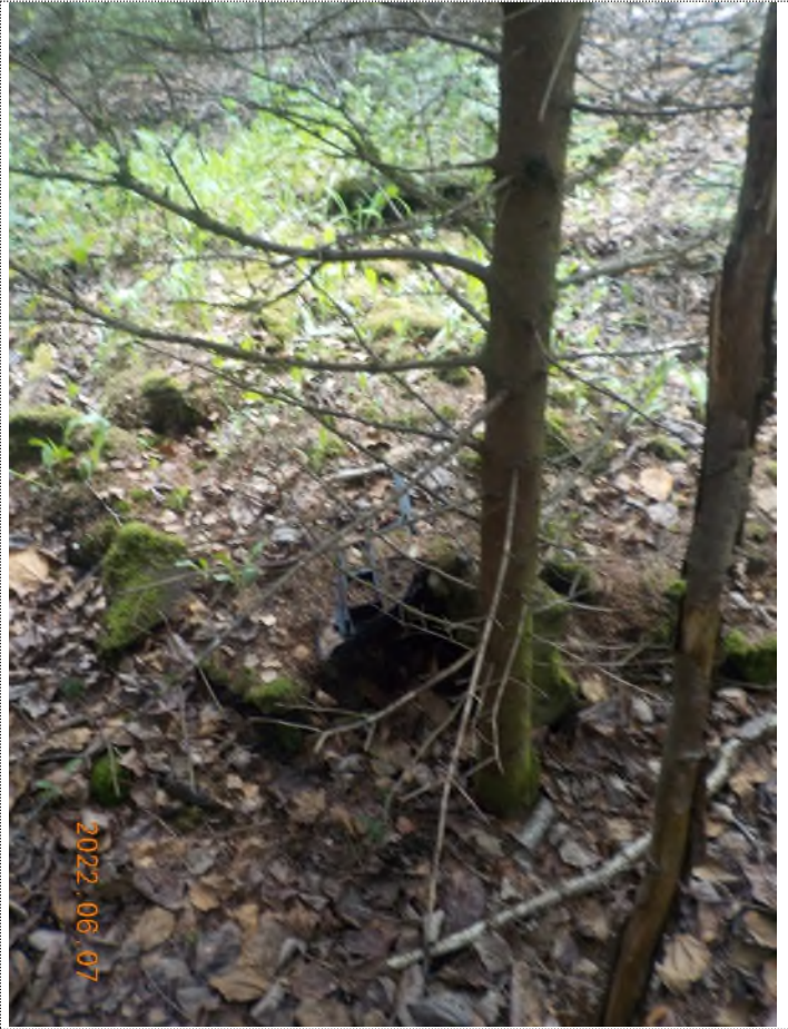
Figure 17: Pièces de voiture enfouis à ramasser (pts suppl.A)