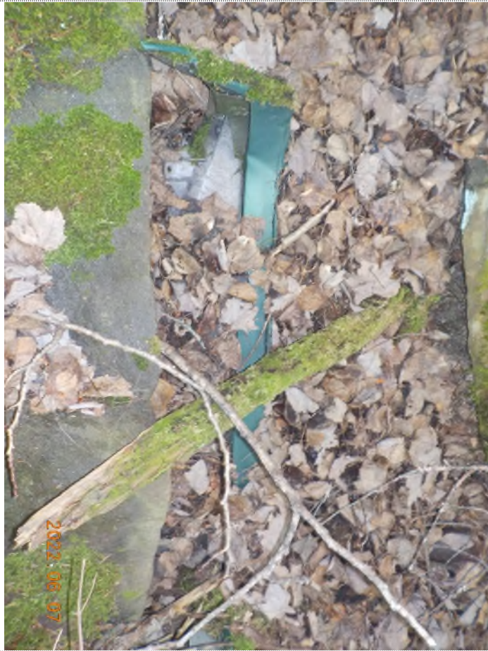
Figure 16: Pièces de voiture enfouis à ramasser (pts suppl.A)