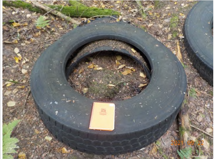
Figure 35: Débris à ramasser aux points supplémentaires J et K