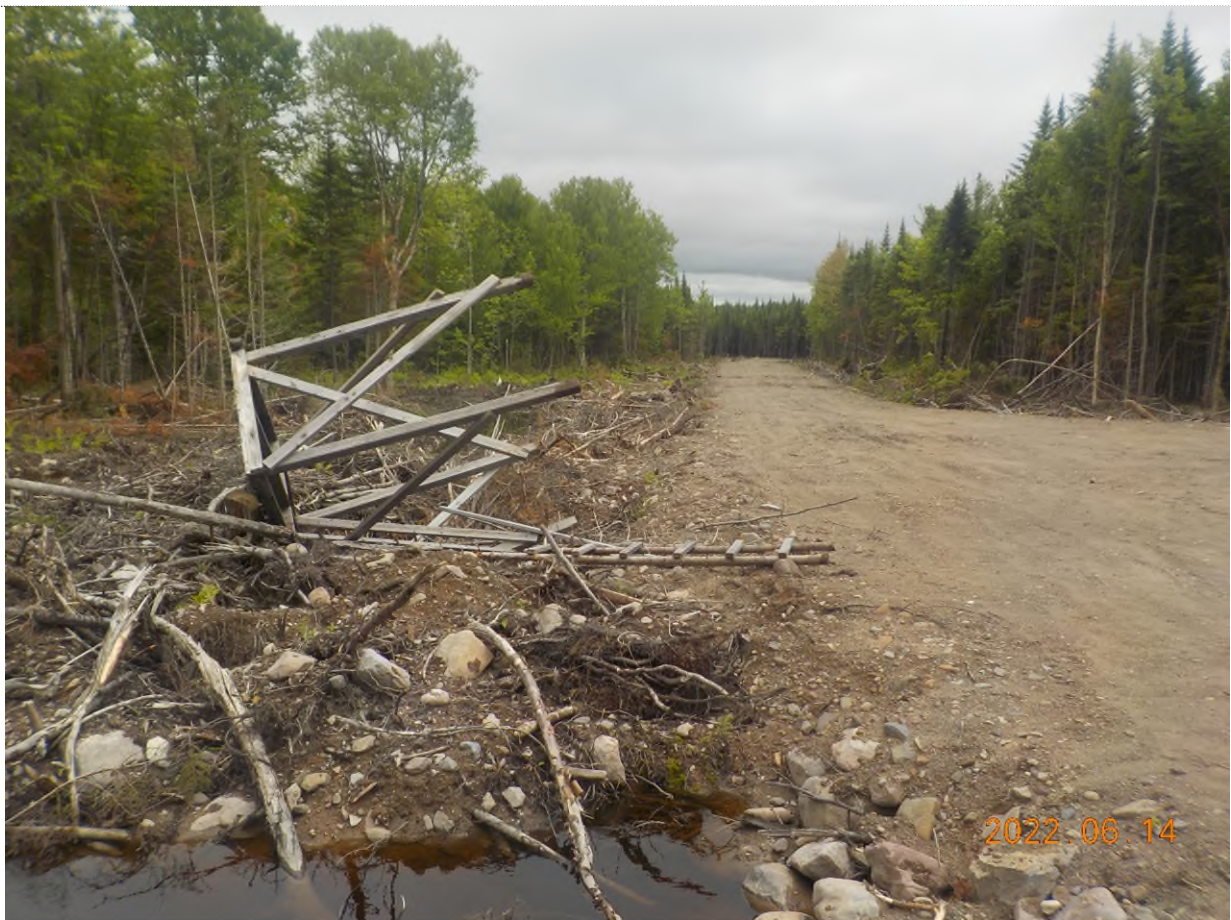
Figure 2: Structure écrasée à ramasser