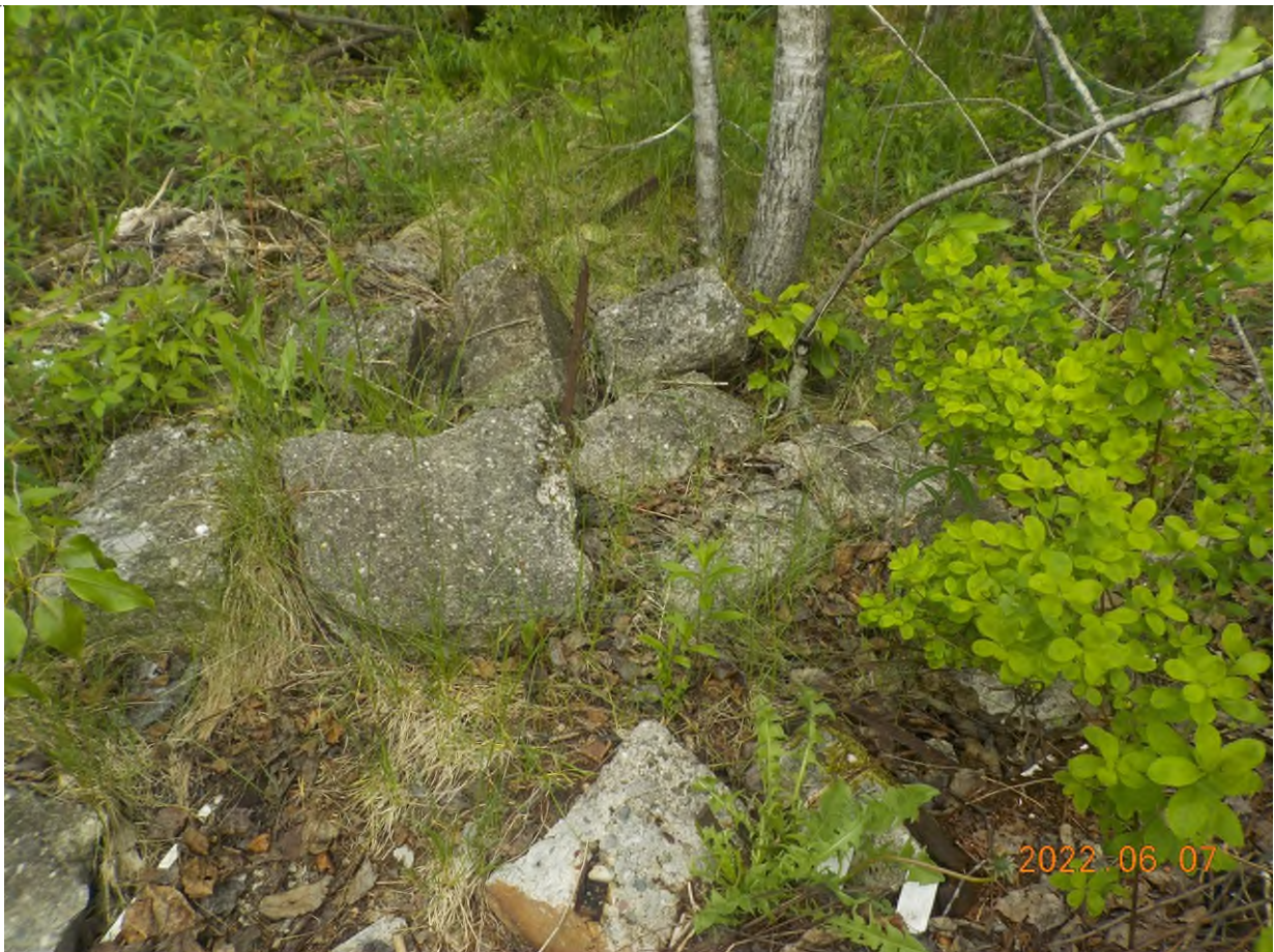
Figure 10: Blocs de béton à ramasser sur le site principal