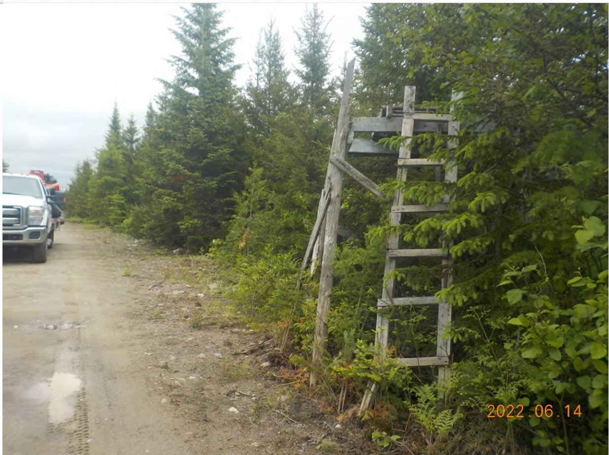
Figure 2: Structure abandonnée à ramasser