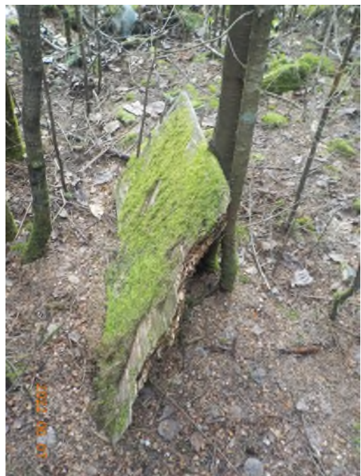
Figure 22: Débris à ramasser au point supplémentaire B