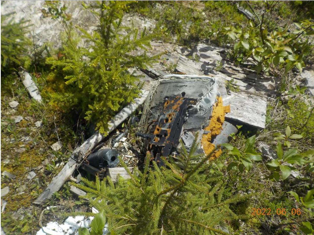
Figure 6: Débris à ramasser