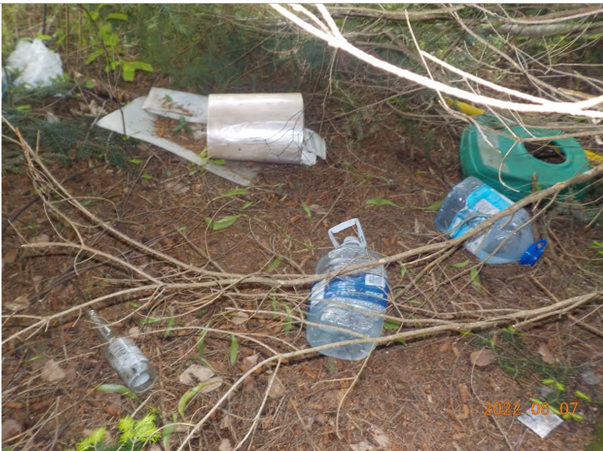
Figure 6: Déchets à ramasser dans le boisé