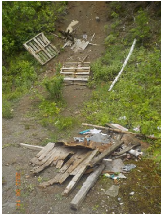
Figure 36: Débris à ramasser au point supplémentaire F