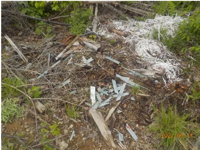
Figure 13: Débris à ramasser au point supplémentaire B