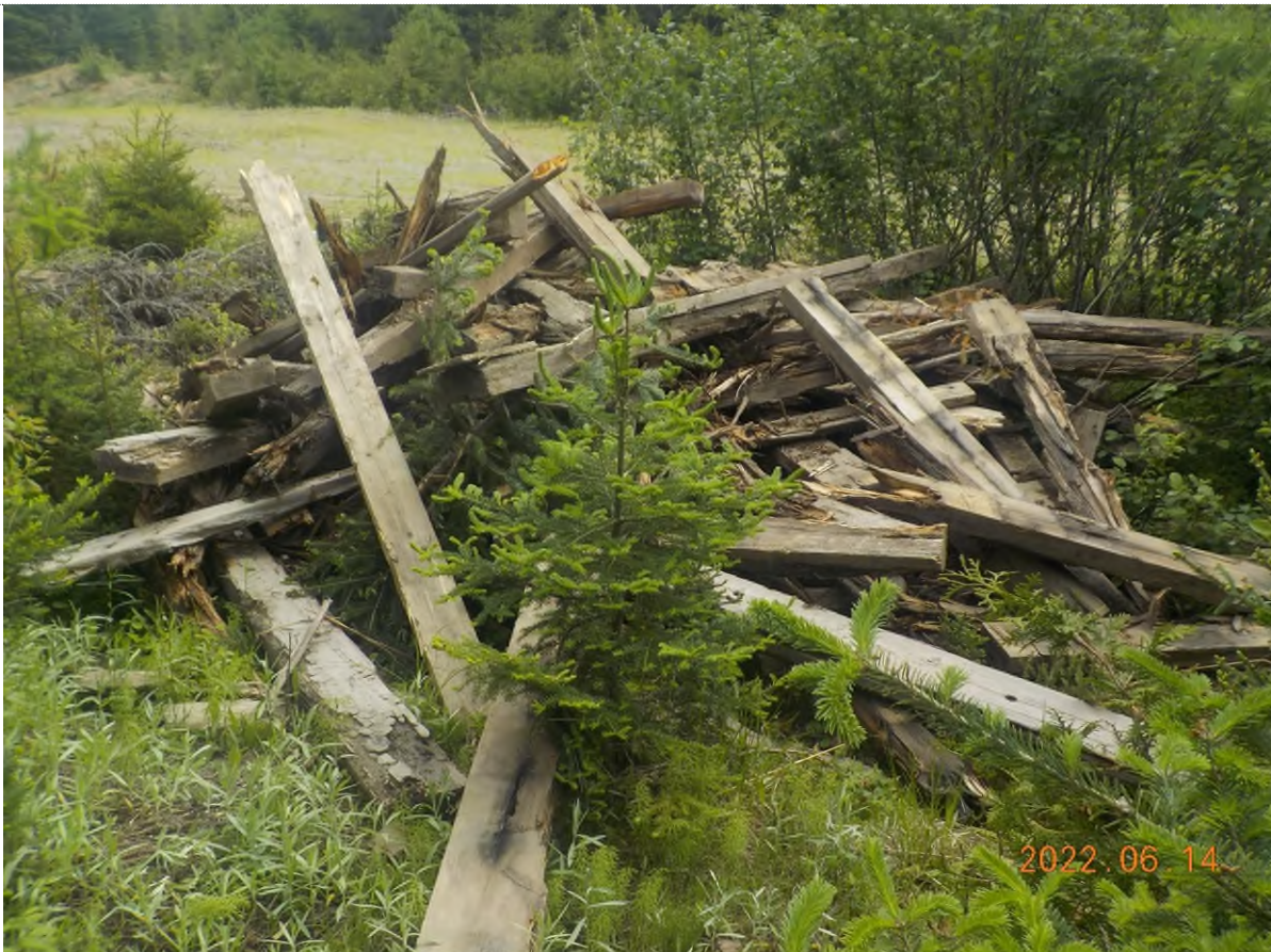
Figure 8: Débris à ramasser du point supplémentaire B