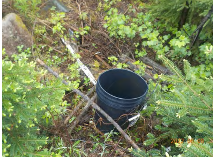
Figure 4: Débris à ramasser