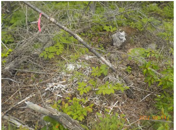
Figure 14: Débris à ramasser au point supplémentaire B