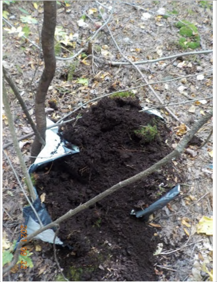
Figure 29: Débris à ramasser au point suppl. I