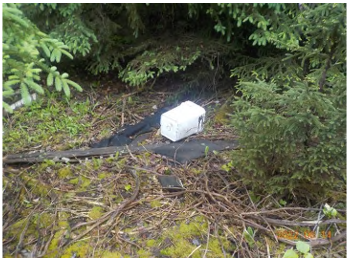
Figure 6: Débris à ramasser