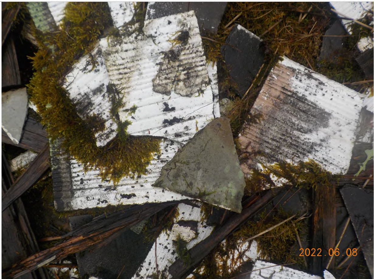
Figure 2: Vue rapprochée des débris