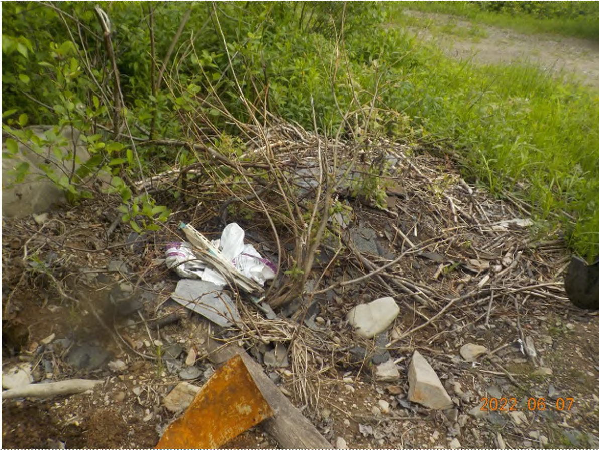
Figure 1: Site à ramasser