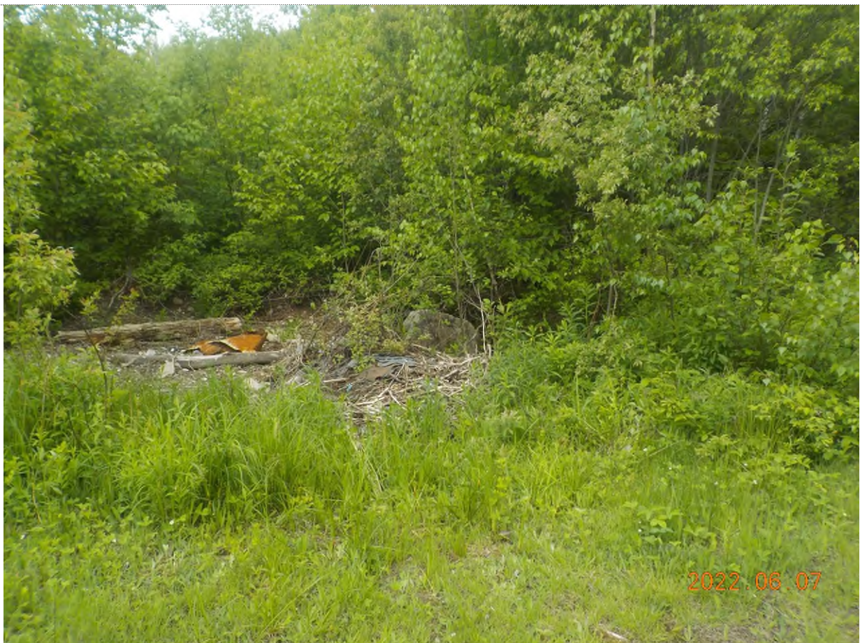
Figure 4: Vue du site à ramasser