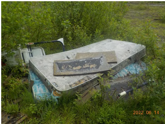
Figure 9: Débris à ramasser du point supplémentaire B