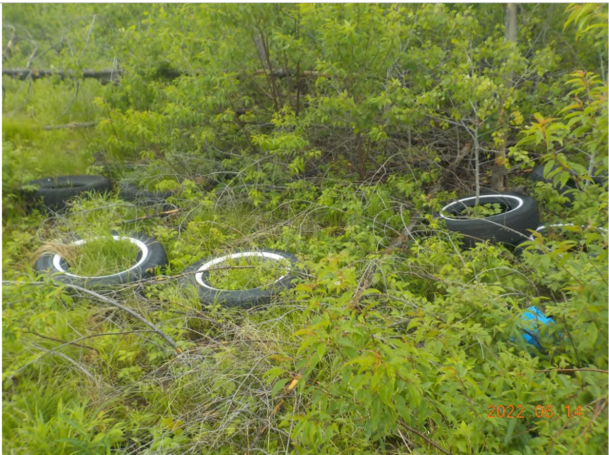
Figure 2: Débris à ramasser