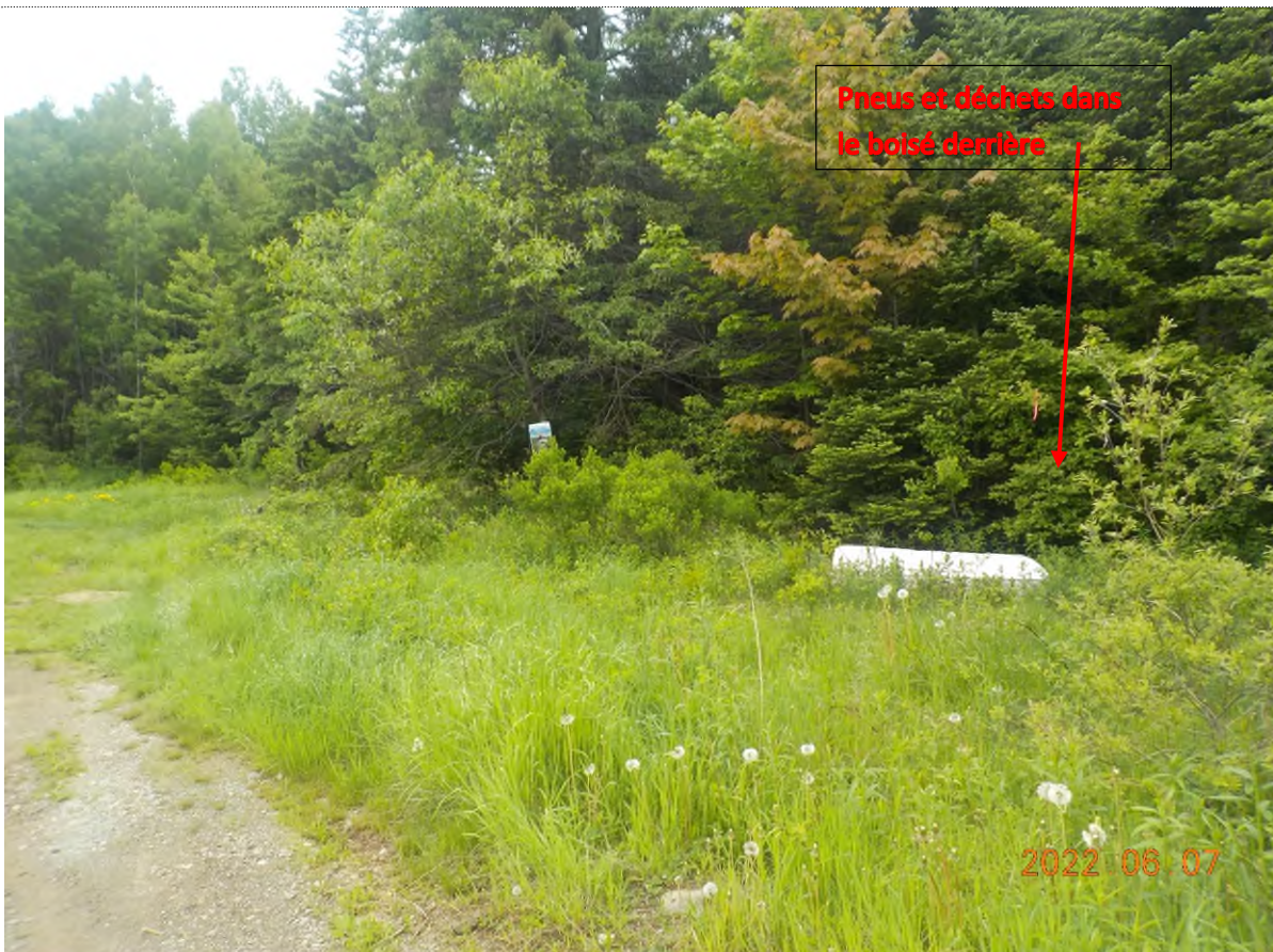
Figure 10: Emplacement déchets à ramasser (pts suppl. A)