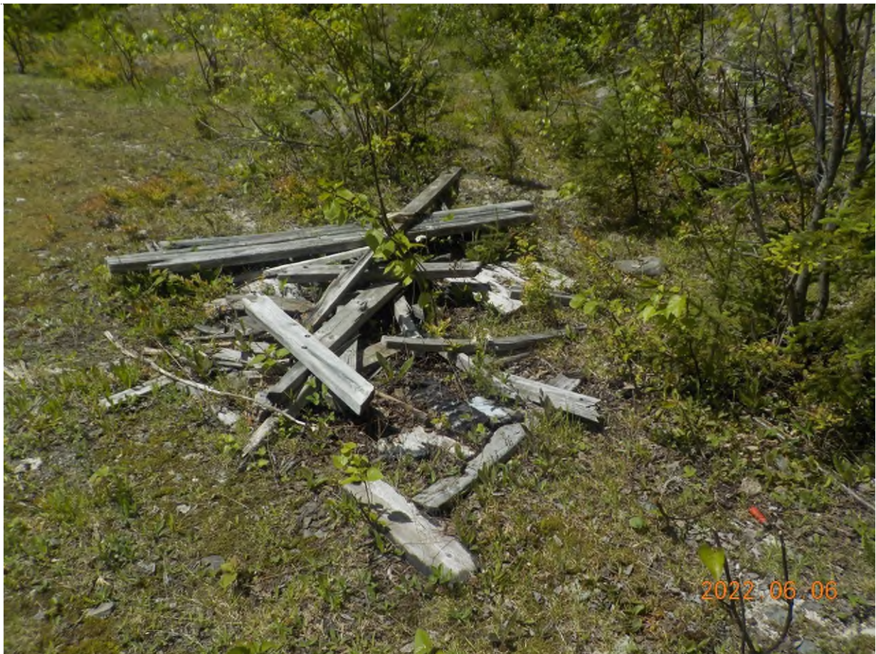
Figure 23: Débris à ramasser au point supplémentaire B