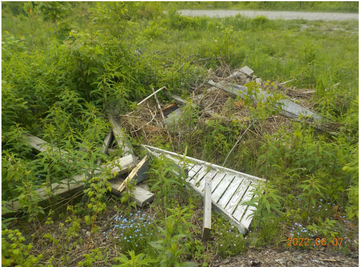
Figure 2: Débris d'ancienne plate-forme à ramasser