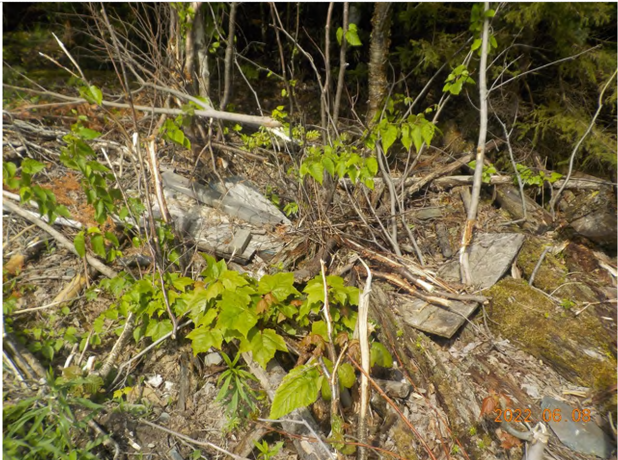
Figure 25: Débris à ramasser au point supplémentaire F