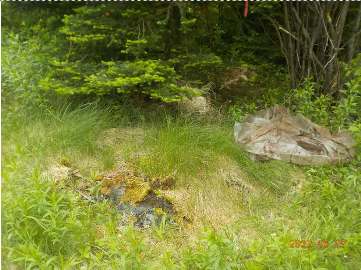
Figure 37: Déchets à ramasser (tas de bardeaux, tôle et autres débris sous matière végétale) – pts suppl. D