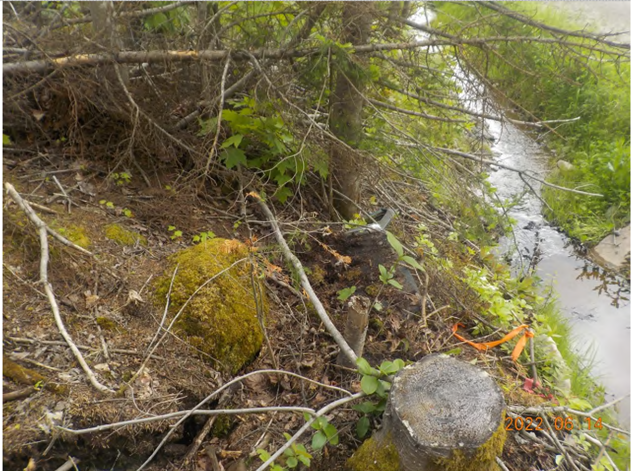
Figure 3: Débris à ramasser