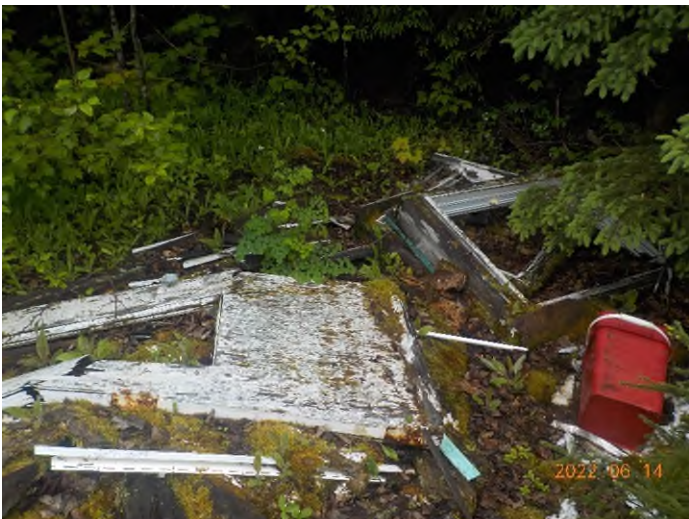
Figure 5: Débris à ramasser