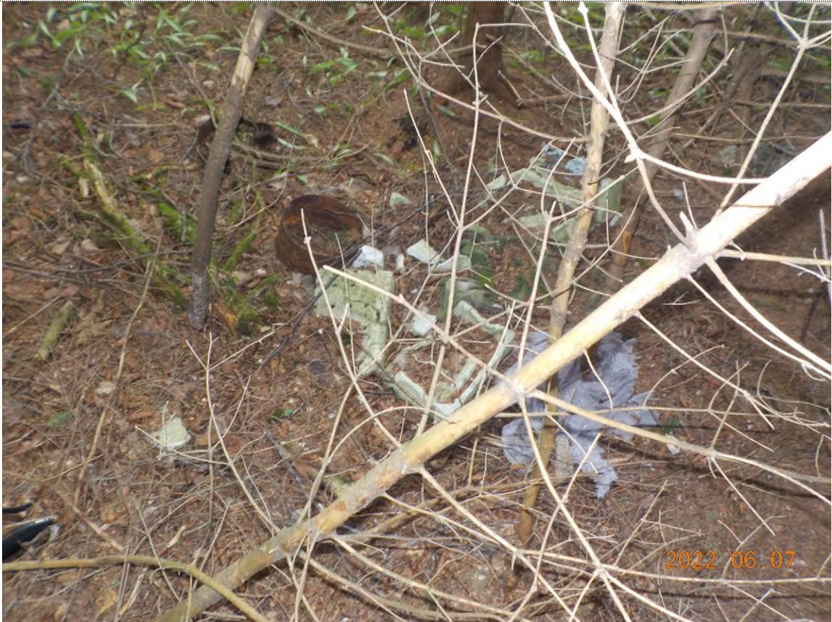
Figure 21: Déchets à ramasser (pts suppl. B)