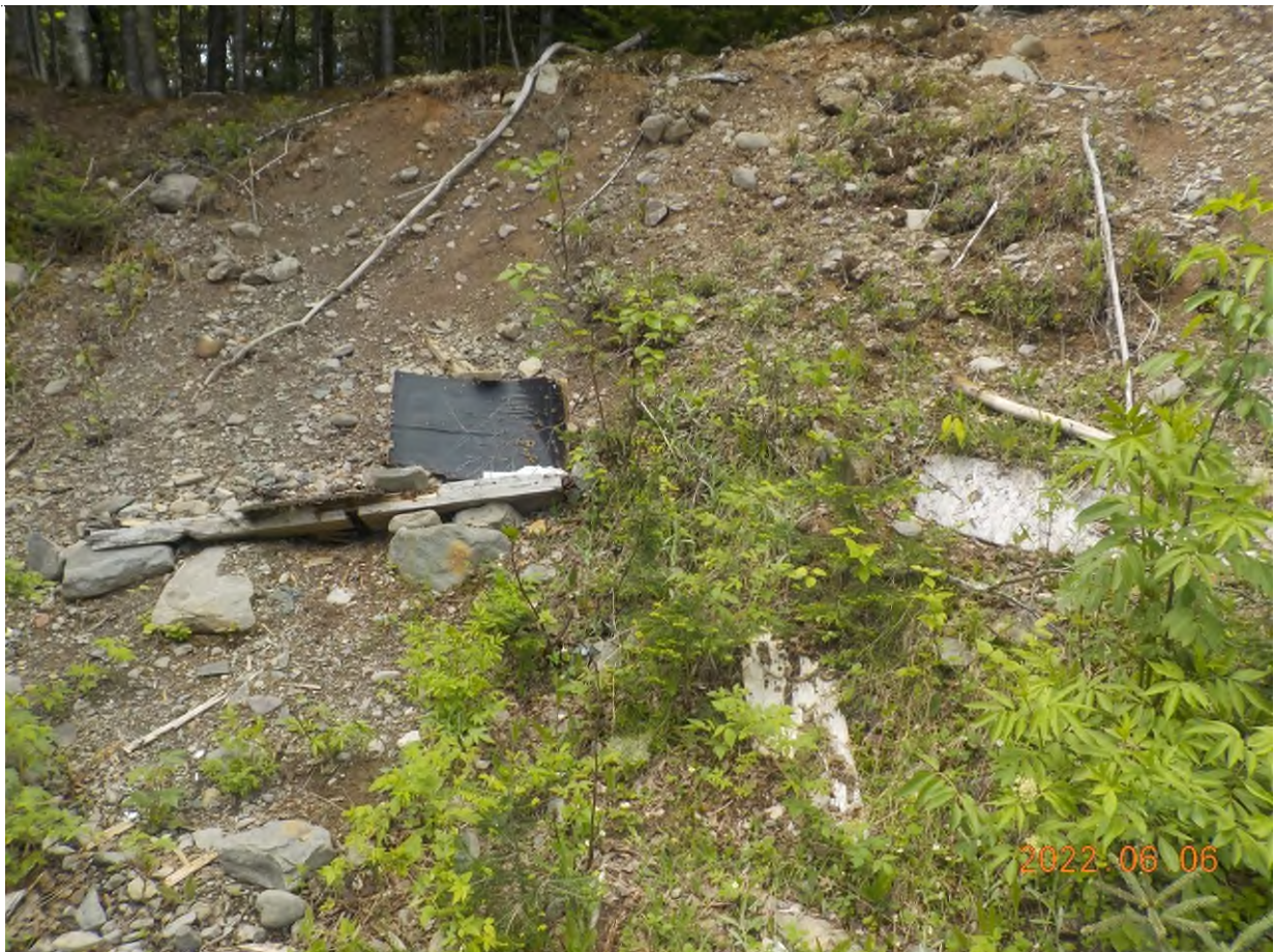
Figure 5: Débris à ramasser du point supplémentaire A