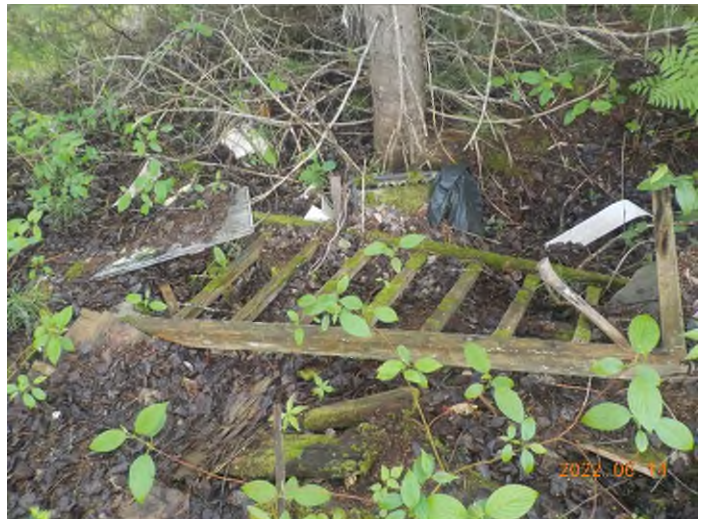
Figure 6: Débris à ramasser