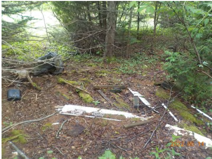
Figure 31: Débris à ramasser du point supplémentaire I