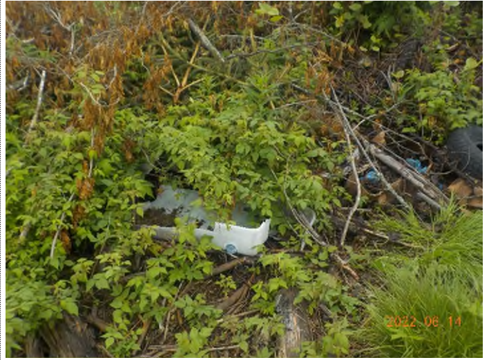
Figure 4: Débris à ramasser enfouis sous branches et matière végétale