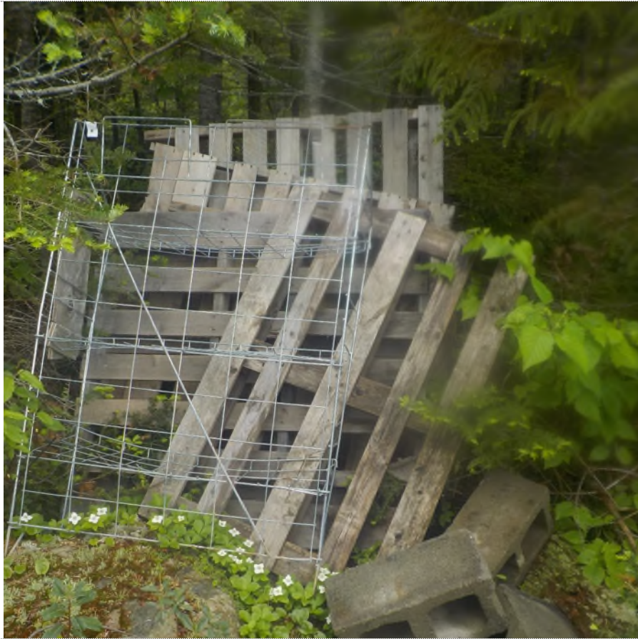
Figure 1: Débris à ramasser