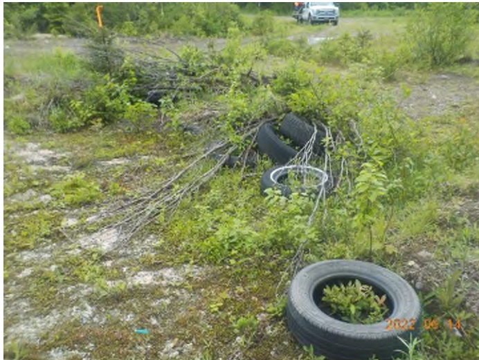
Figure 11: Débris à ramasser du point supplémentaire C