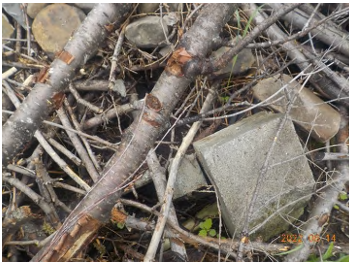
Figure 21: Débris à ramasser au point supplémentaire B