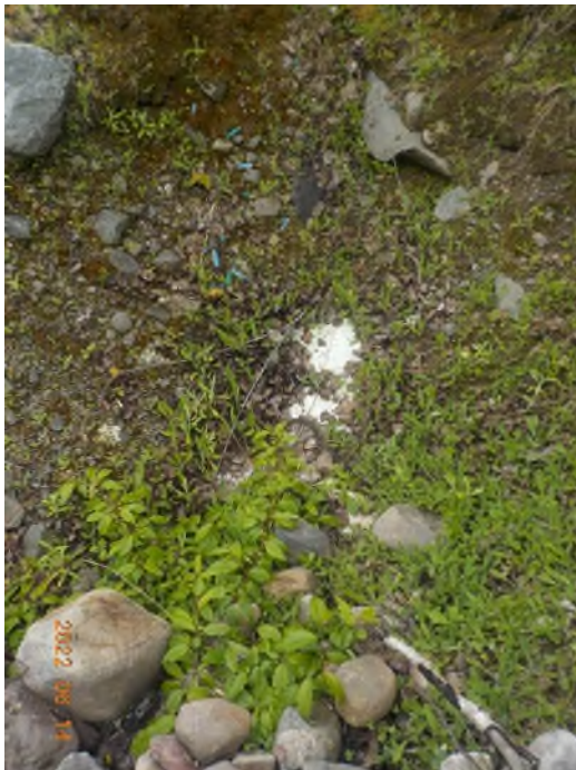
Figure 13: Débris à ramasser au point supplémentaire B