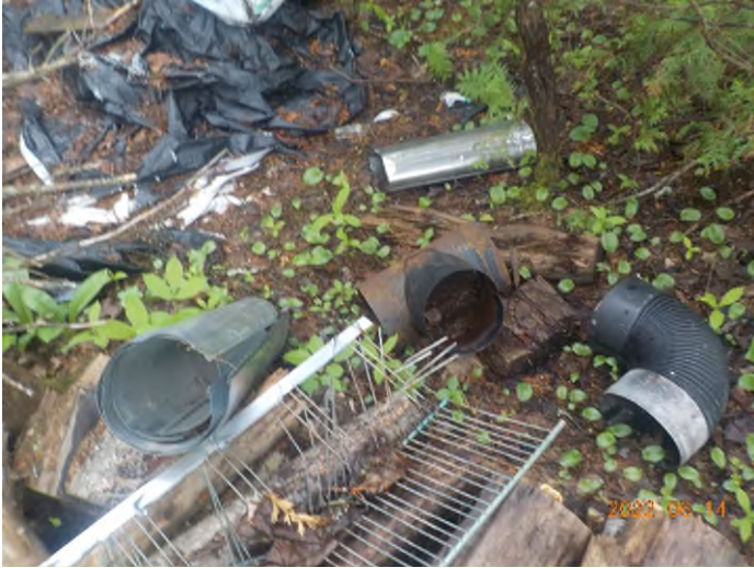
Figure 3: Débris à ramasser