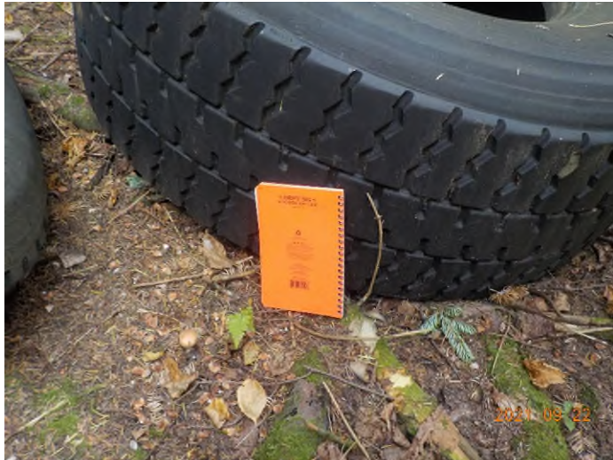
Figure 34: Débris à ramasser aux points supplémentaires J et K