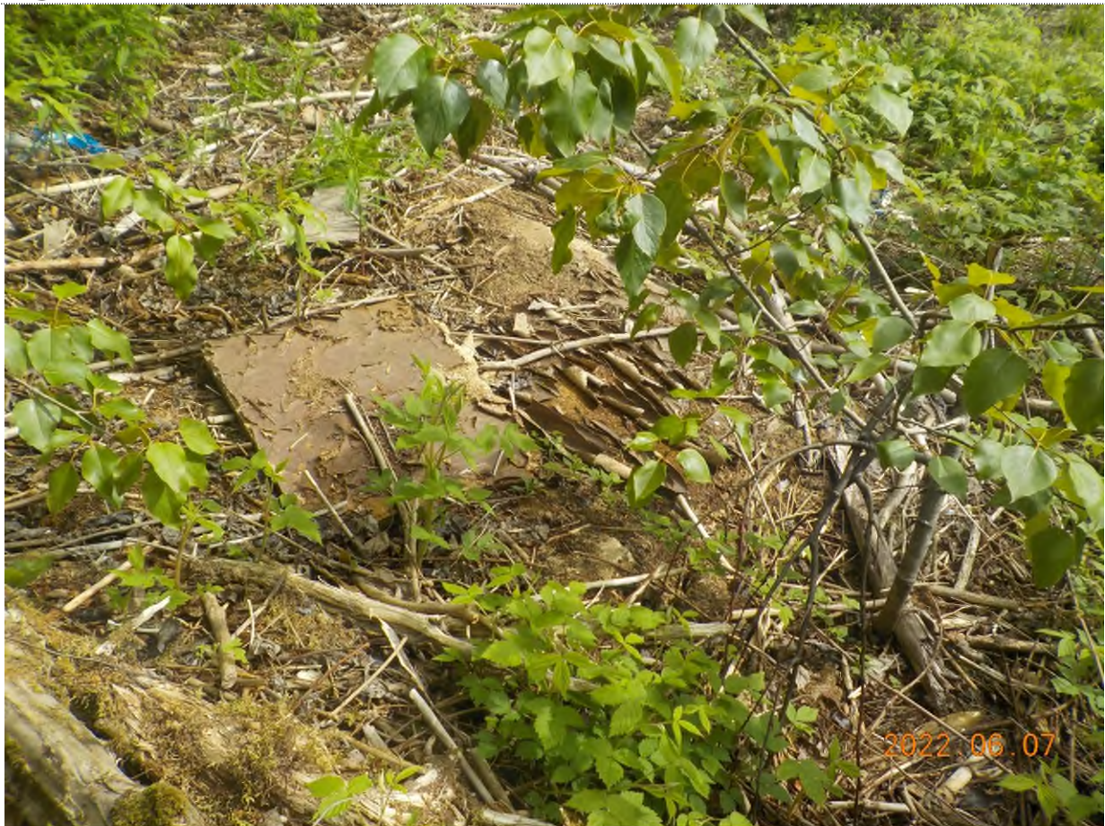
Figure 7: Débris à ramasser sur le site principal