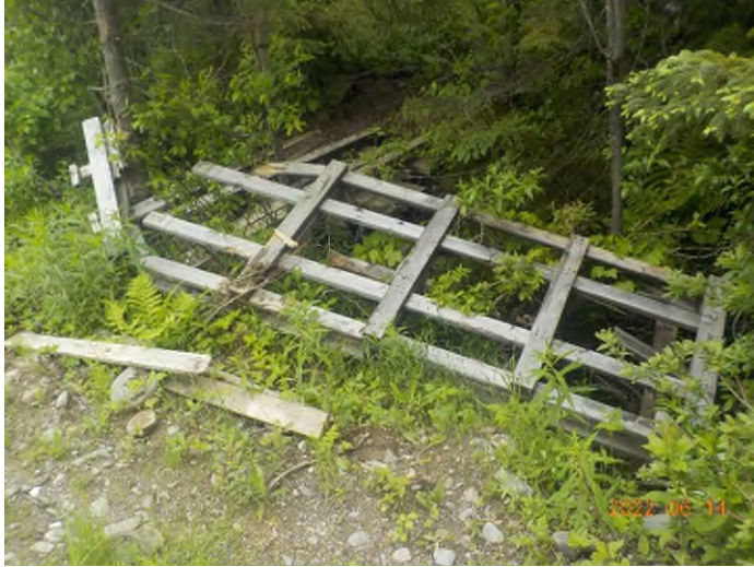
Figure 7: Débris à ramasser