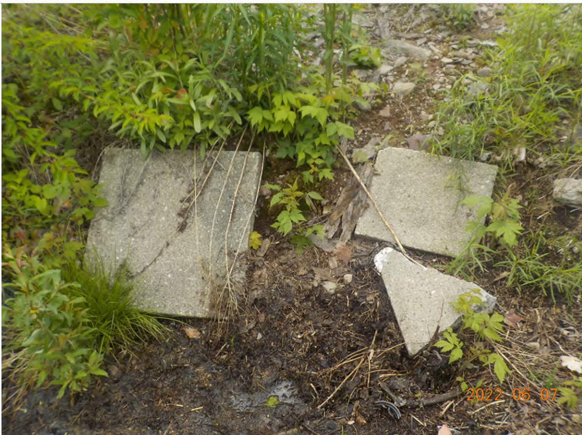
Figure 2: Dalles de béton à ramasser