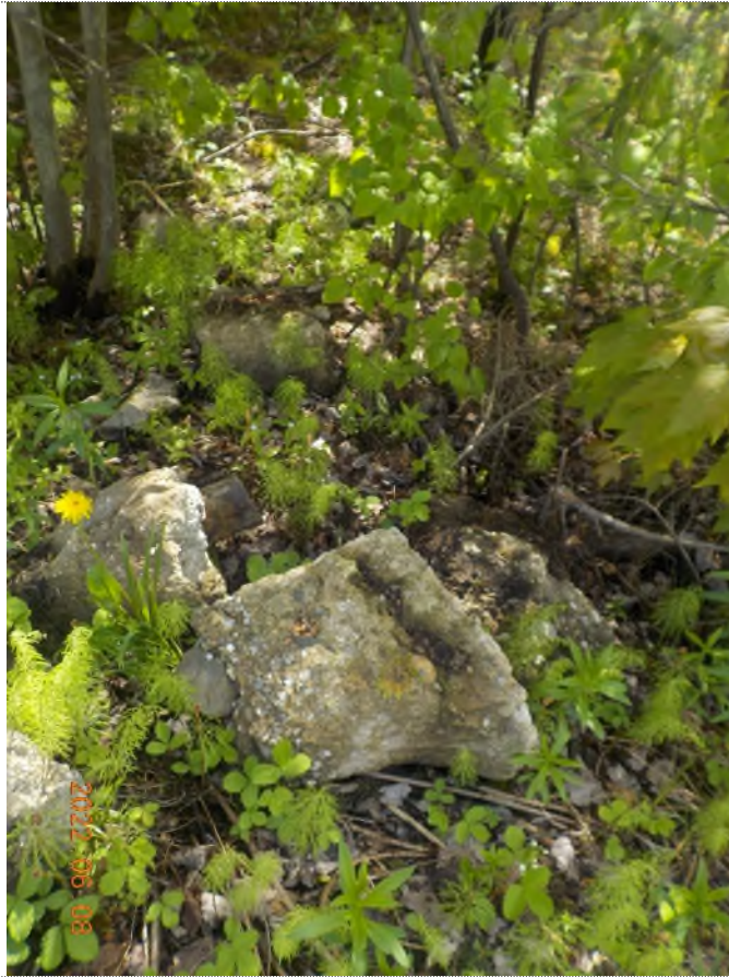
Figure 1: Débris à ramasser au point principal (blocs de béton et asphalte)