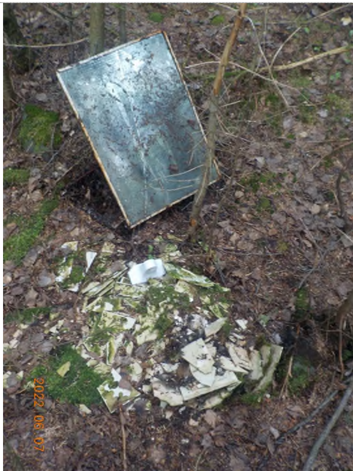
Figure 21: Débris à ramasser au point supplémentaire B