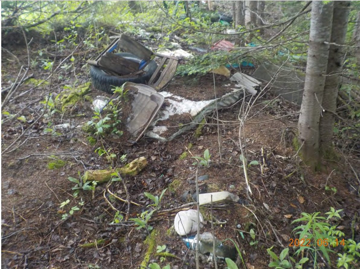
Figure 1: Débris à ramasser