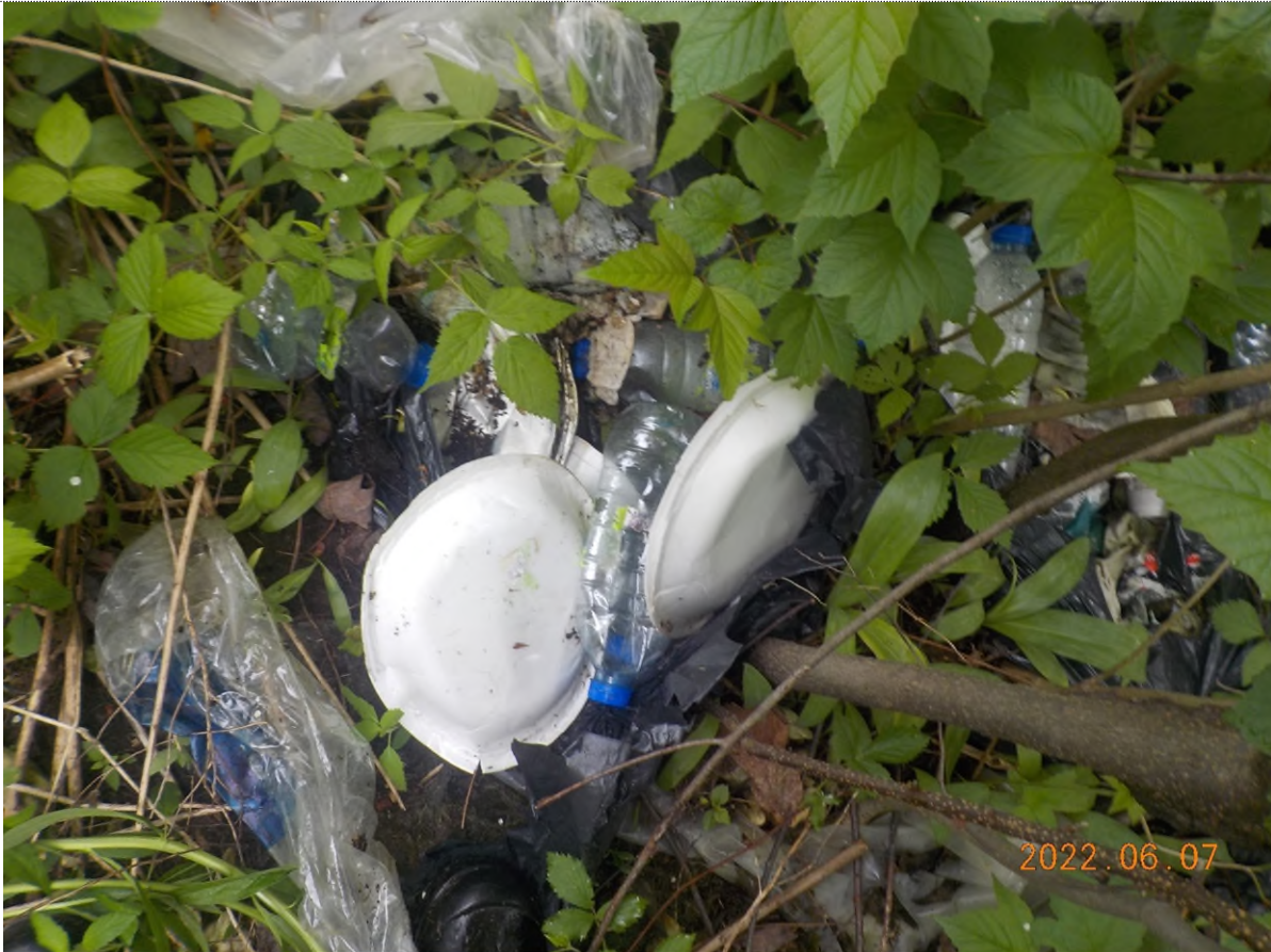
Figure 35: Déchets à ramasser (pts suppl. C)