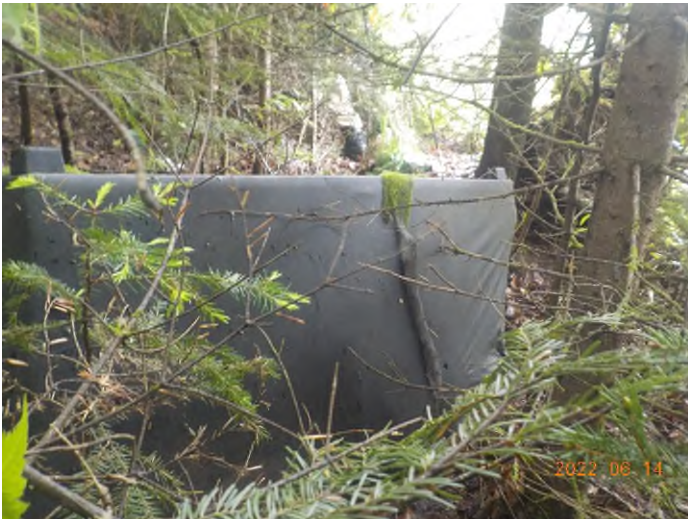
Figure 5: Débris à ramasser