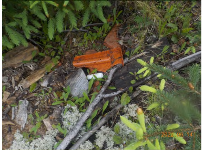
Figure 20: Débris à ramasser du point supplémentaire D