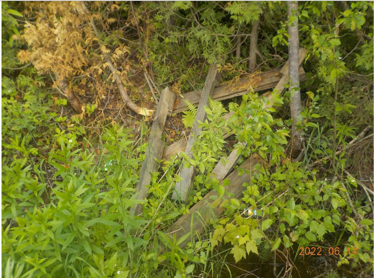
Figure 9: Débris à ramasser au point supplémentaire A