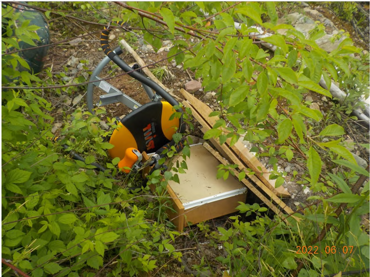
Figure 5: Débris à ramasser au point supplémentaire A