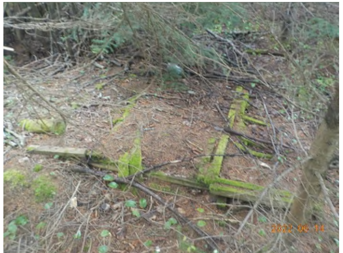
Figure 32: Débris à ramasser du point supplémentaire I