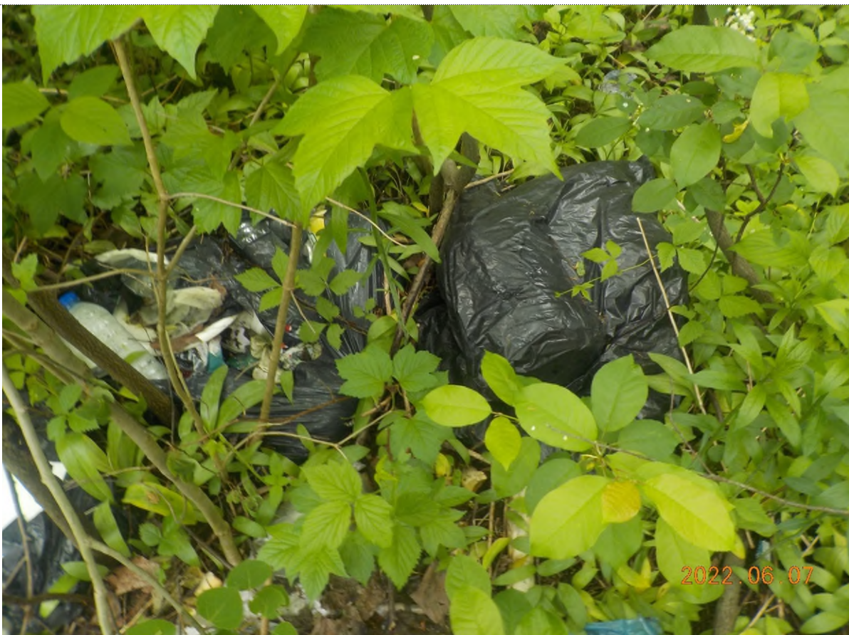
Figure 34: Déchets à ramasser (pts suppl. C)