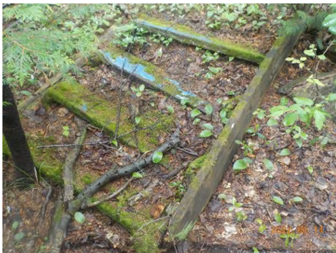
Figure 33: Débris à ramasser du point supplémentaire I