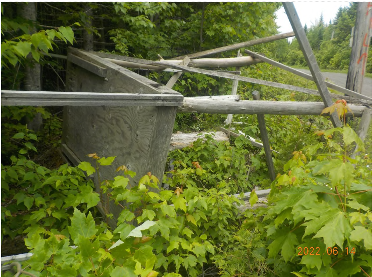
Figure 2: Structure écrasée à ramasser