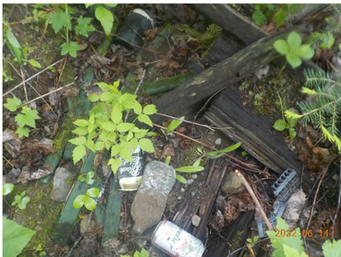
Figure 74: Débris à ramasser au point supplémentaire H