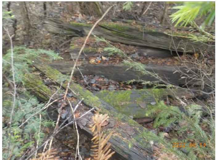
Figure 33: Débris à ramasser au point supplémentaire E