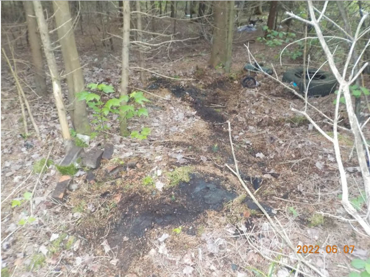
Figure 19: Vue des déchets à ramasser (pts suppl. B)