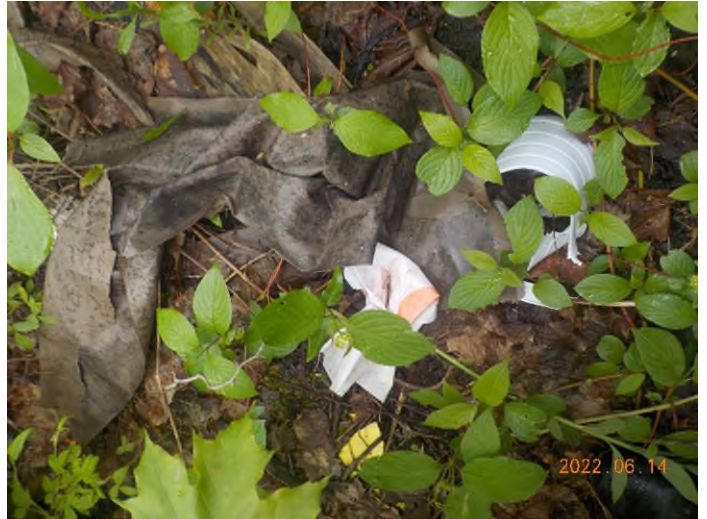
Figure 39: Débris à ramasser au point supplémentaire F