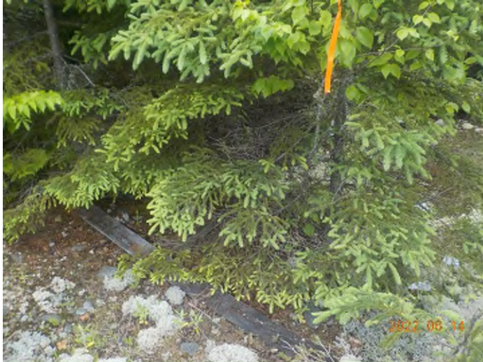
Figure 15: Débris à ramasser du point supplémentaire C