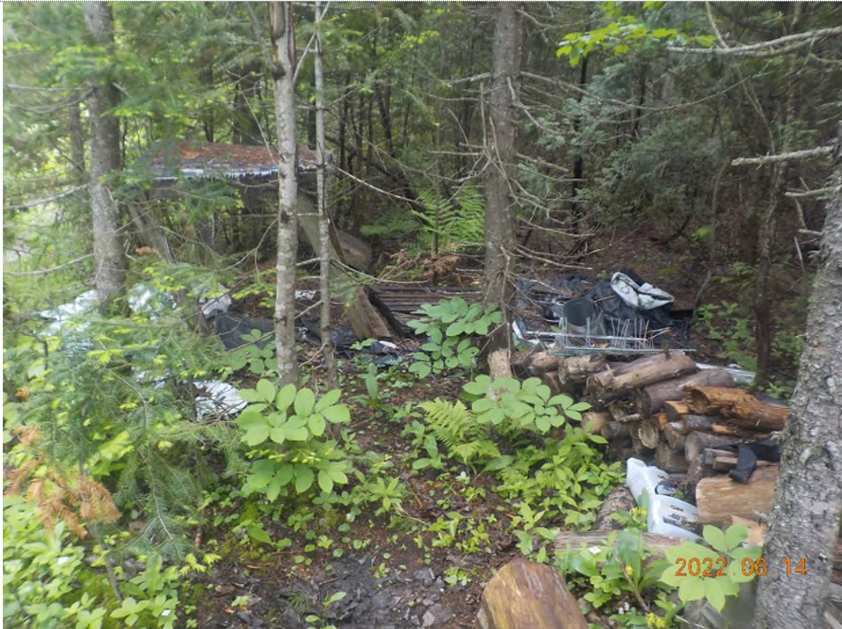
Figure 1: Débris à ramasser