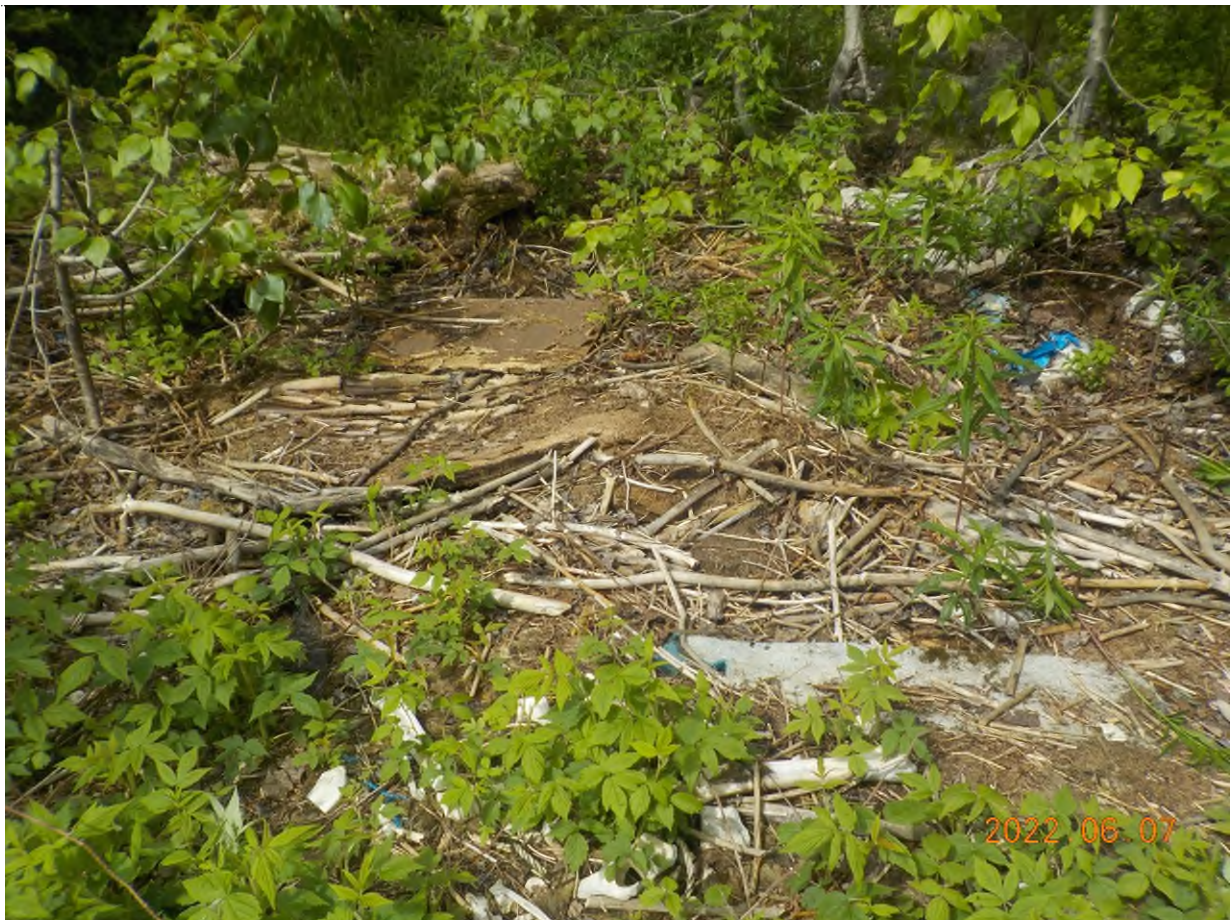
Figure 6: Débris à ramasser sur le site principal (site à creuser pour ramasser)