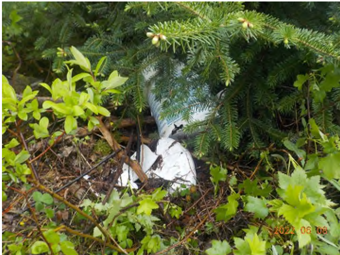
Figure 5: Débris à ramasser