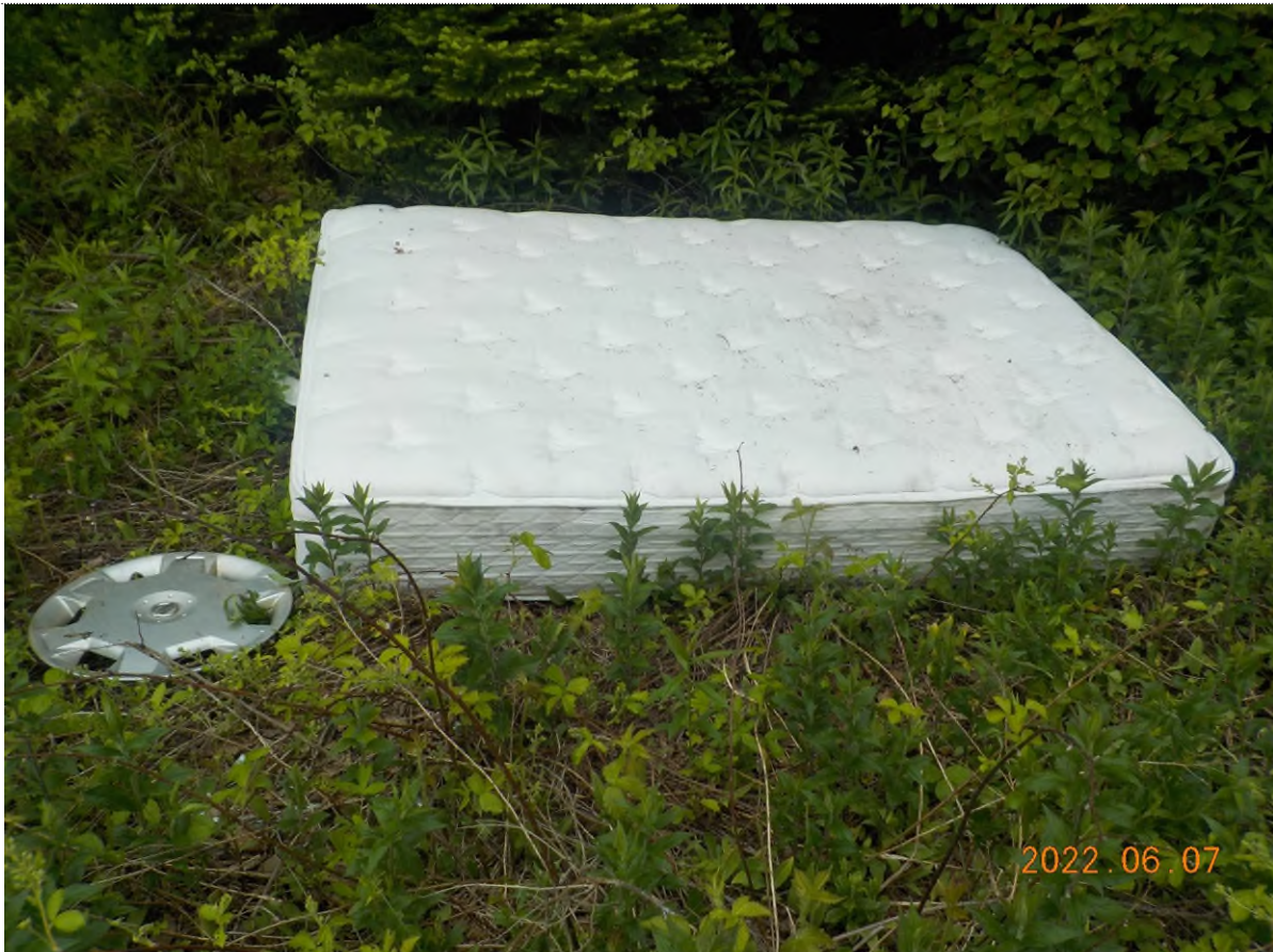
Figure 9: Déchets à ramasser (pts suppl. A)