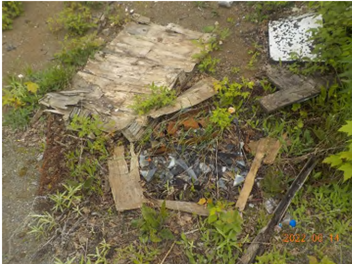
Figure 38: Débris à ramasser au point supplémentaire F