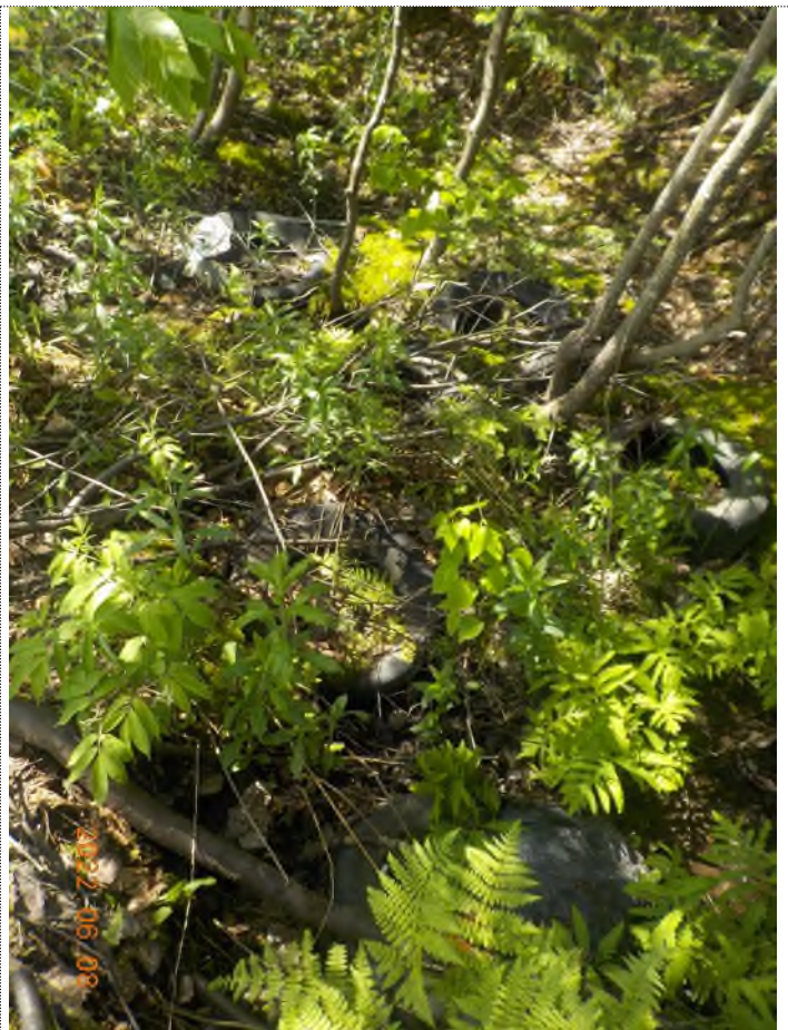
Figure 6: Débris à ramasser aux points suppl. A-B