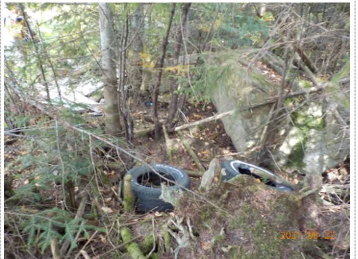
Figure 16: Débris à ramasser au point suppl. C