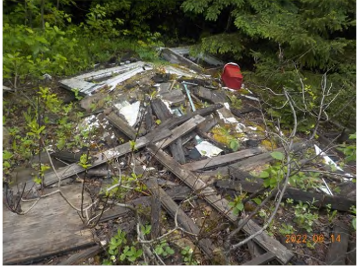
Figure 4: Débris à ramasser