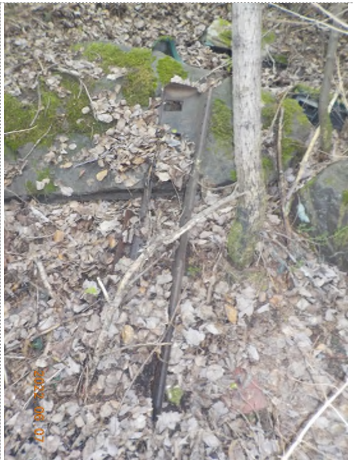
Figure 15: Pièces de voiture enfouis à ramasser (pts suppl.A)