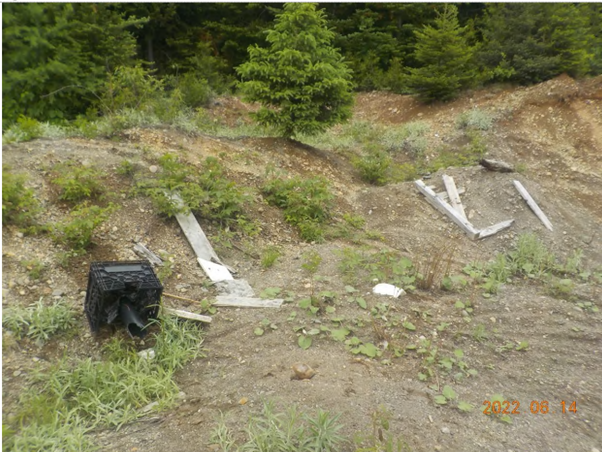
Figure 3: Débris à ramasser