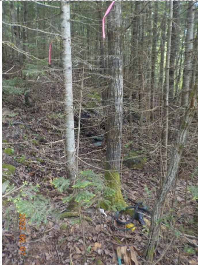
Figure 13: Vue de l'emplacement du point supplémentaire A (pièces de voiture)