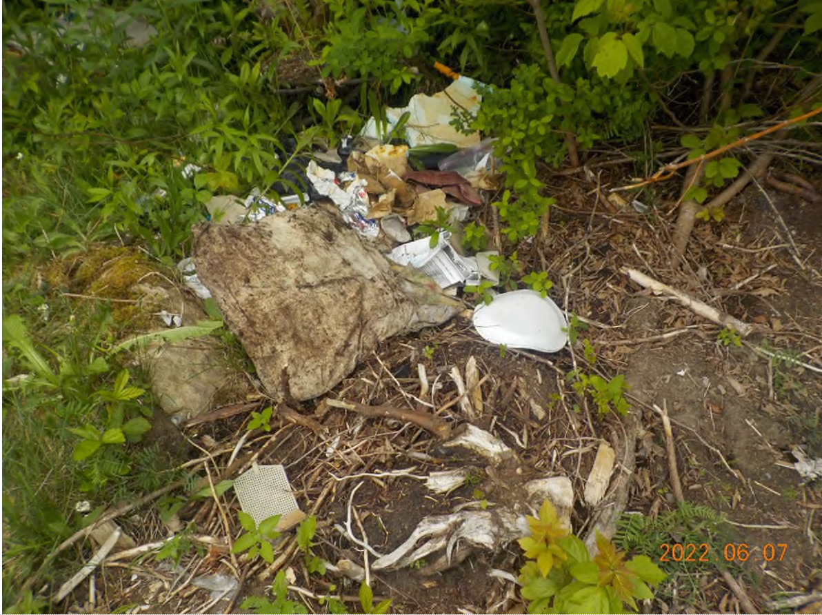
Figure 1: Déchets à ramasser