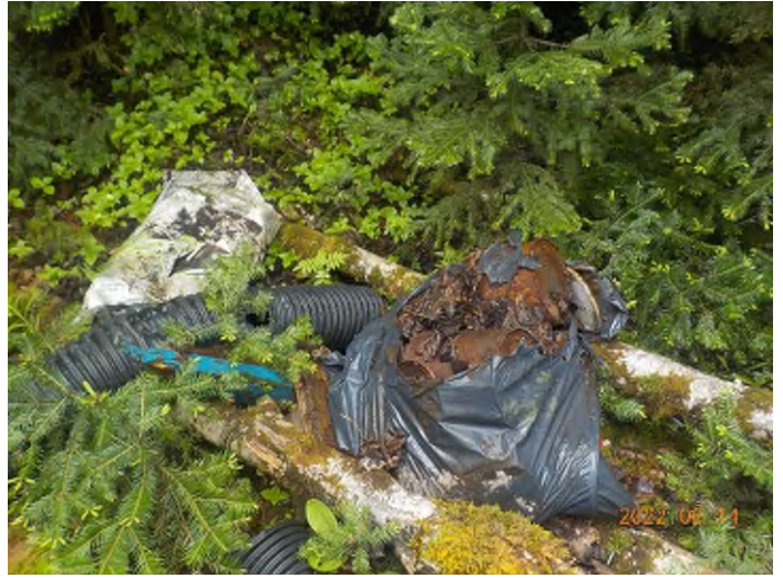
Figure 31: Débris à ramasser au point supplémentaire E