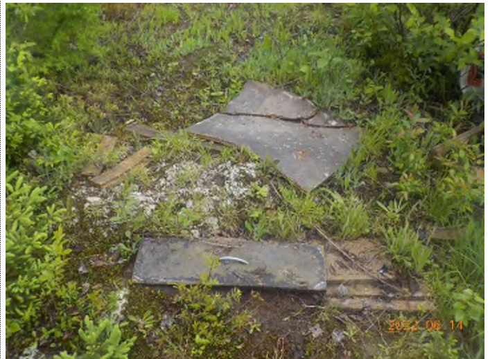
Figure 10: Débris à ramasser du point supplémentaire B