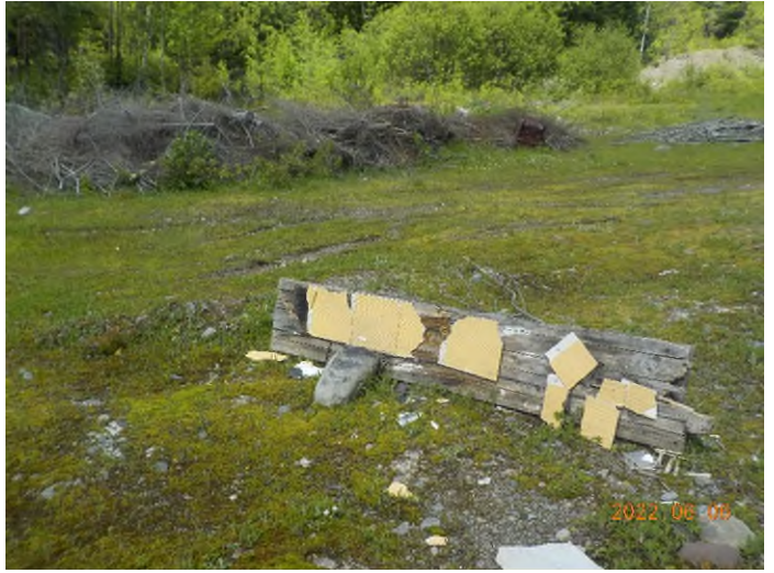
Figure 10: Débris à ramasser