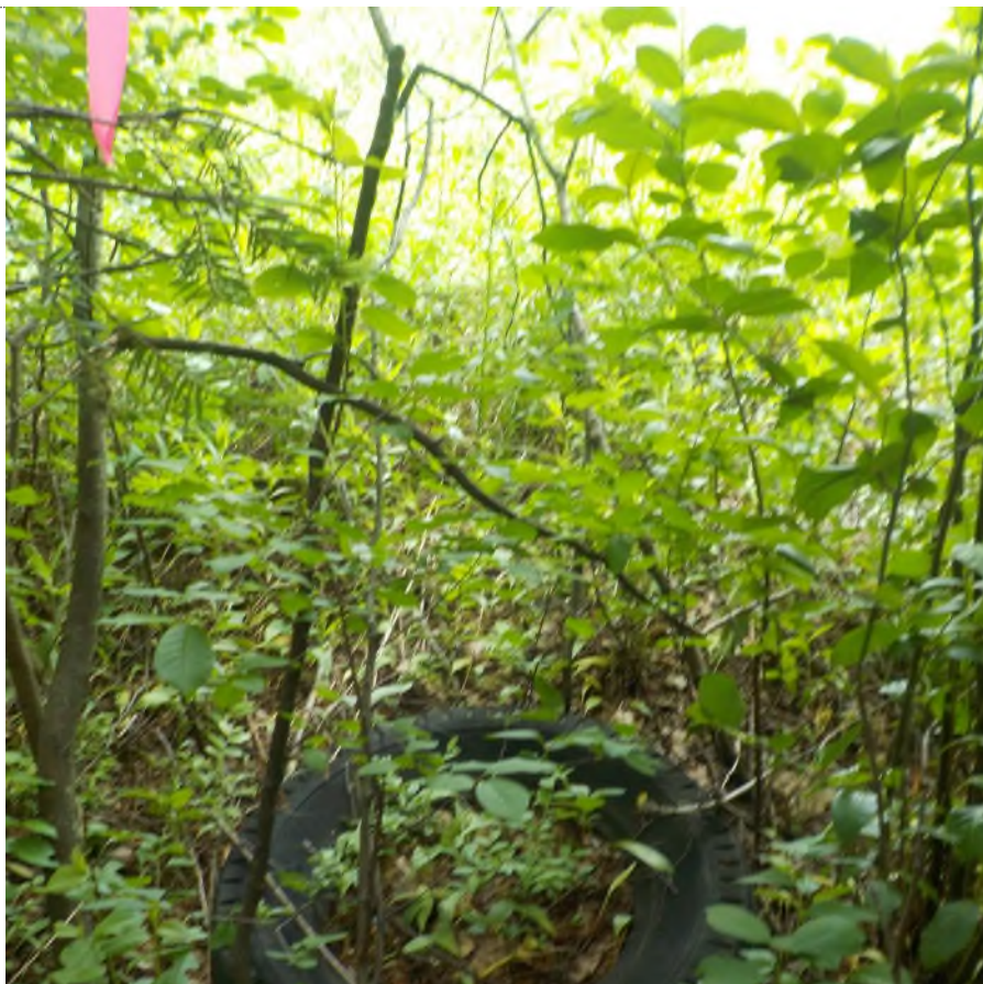
Figure 14: Déchets à ramasser derrière matelas dans la ligne boisé (pts suppl. A)