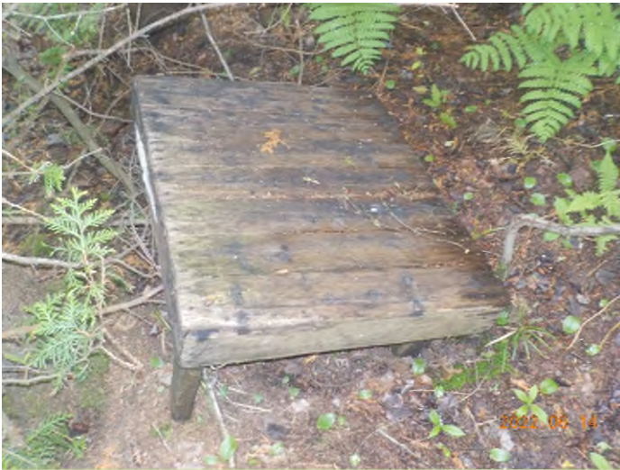
Figure 5: Débris à ramasser