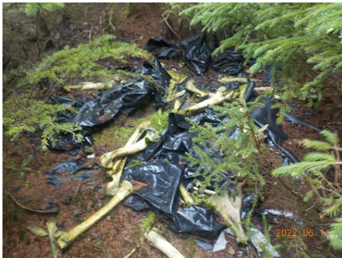
Figure 25: Débris à ramasser du point supplémentaire G