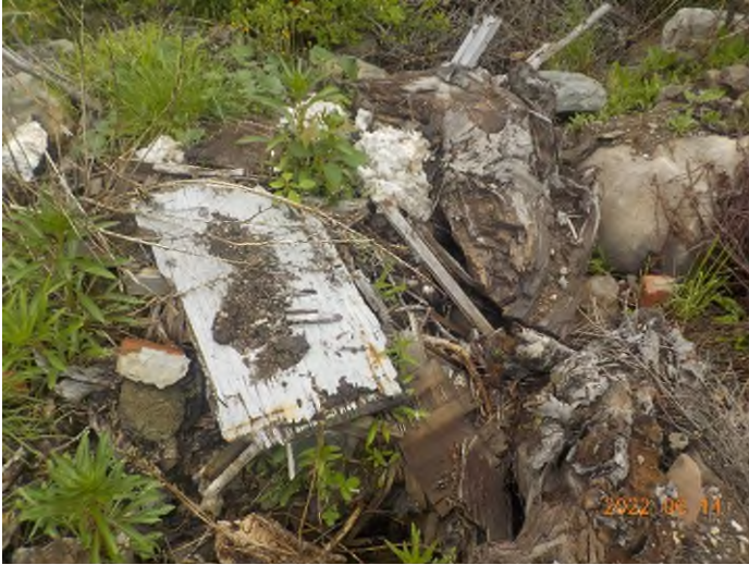
Figure 23: Débris à ramasser au point supplémentaire B