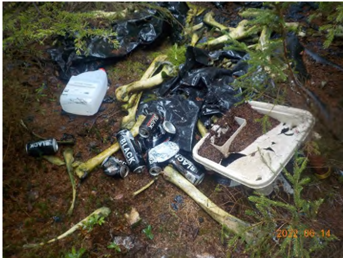
Figure 27: Débris à ramasser du point supplémentaire G