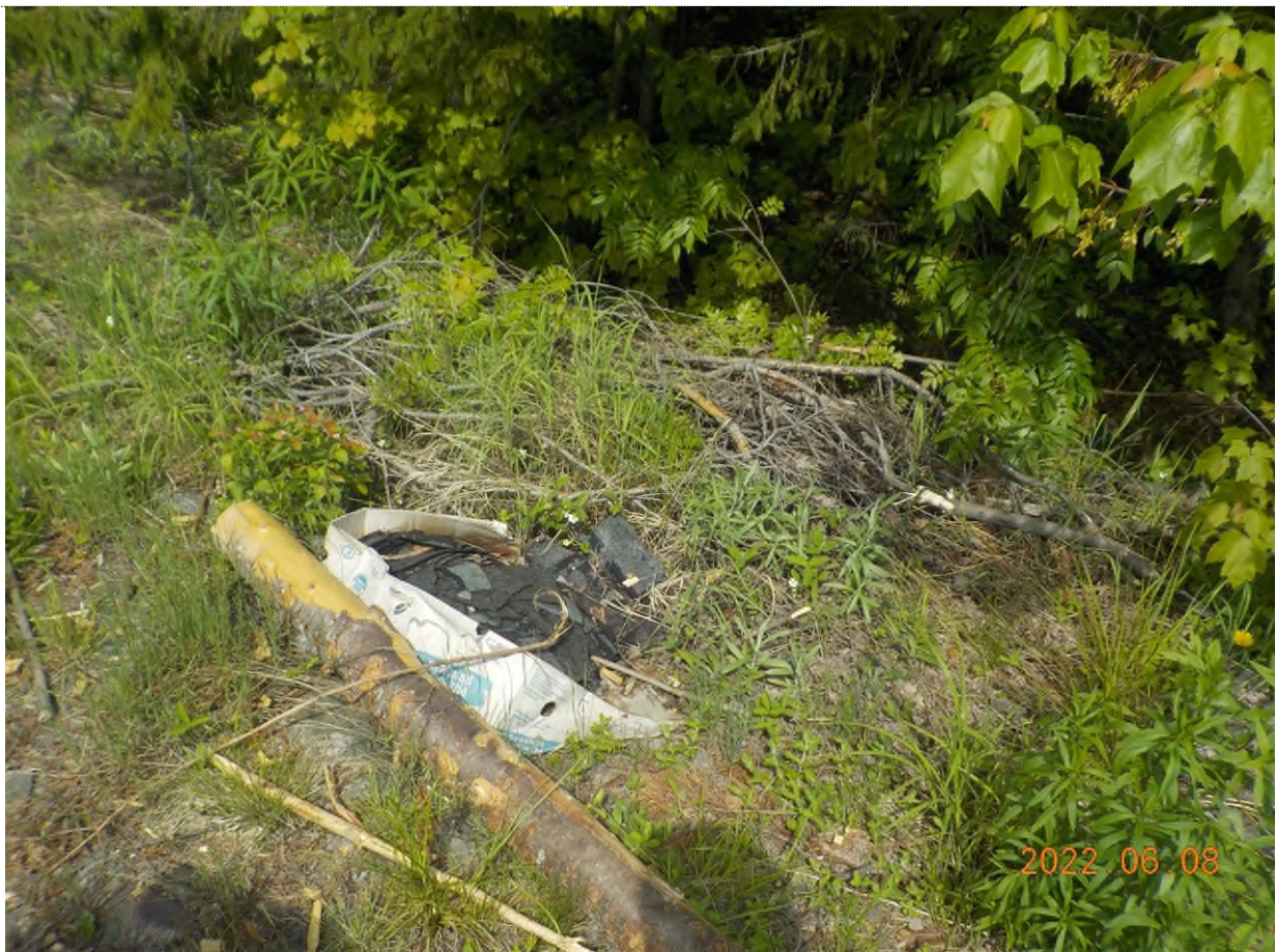
Figure 27: Débris à ramasser au point supplémentaire H (boîte de bardeaux)