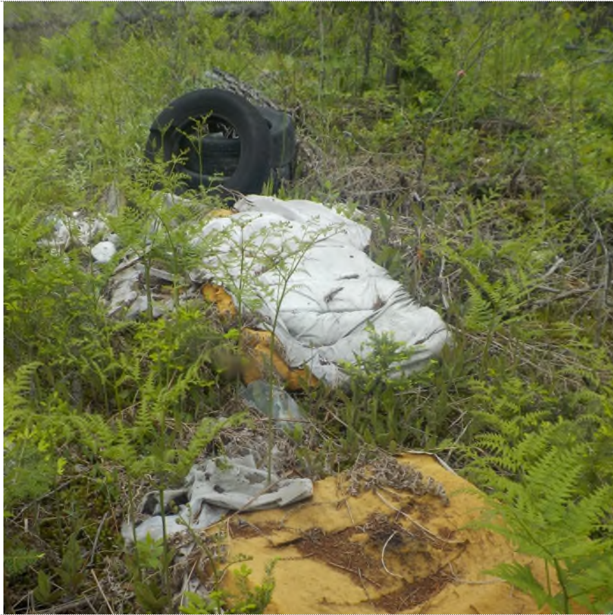
Figure 1: Débris à ramasser