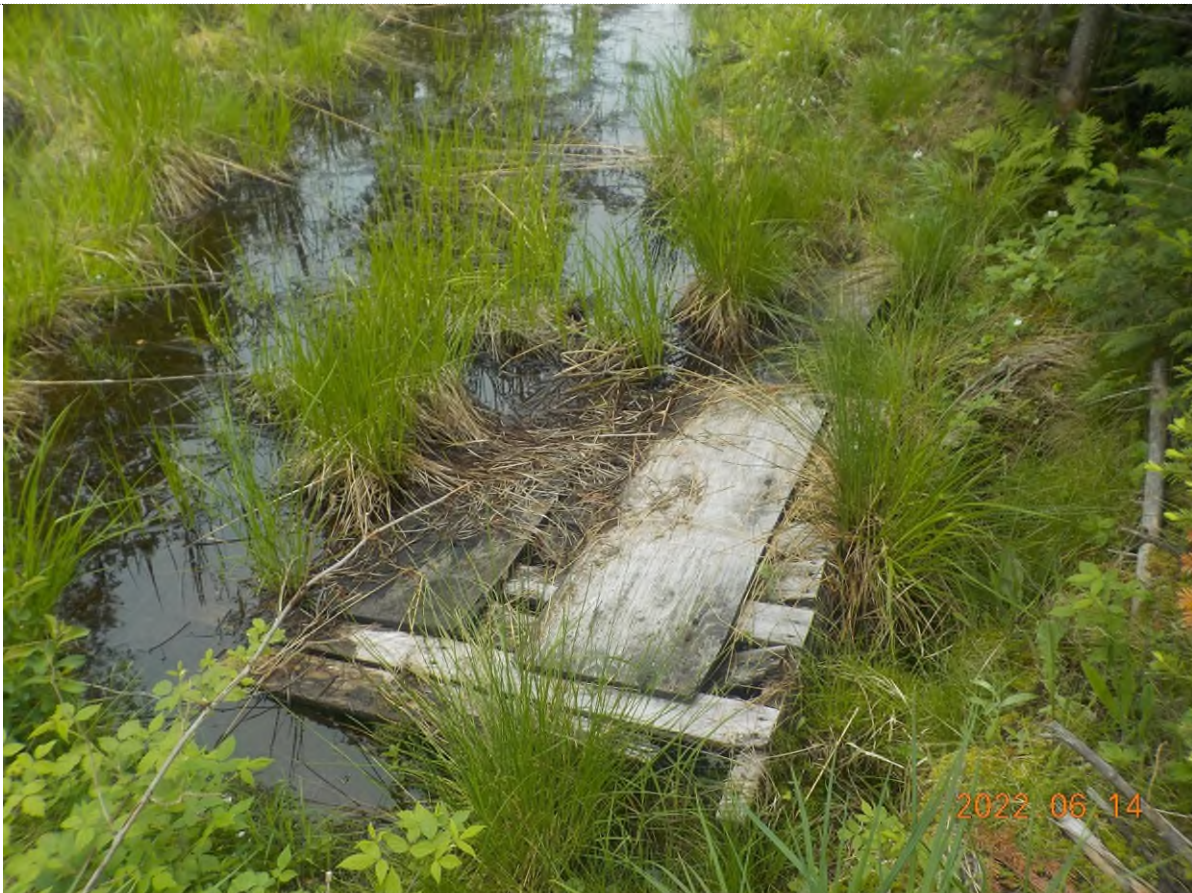
Figure 6: Débris à ramasser du point supplémentaire A