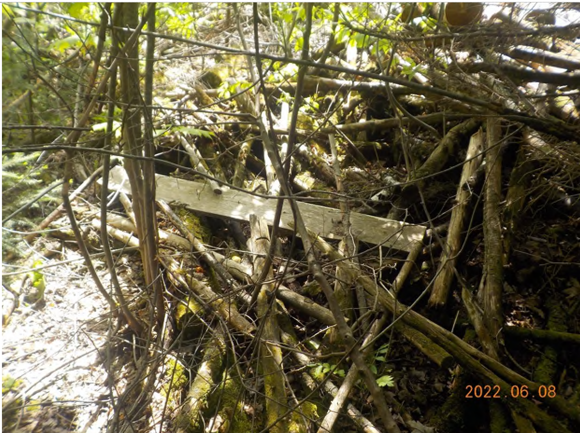
Figure 22: Vue du site point suppl. E