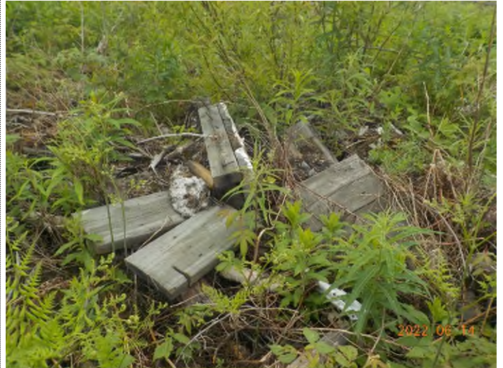
Figure 8: Débris à ramasser