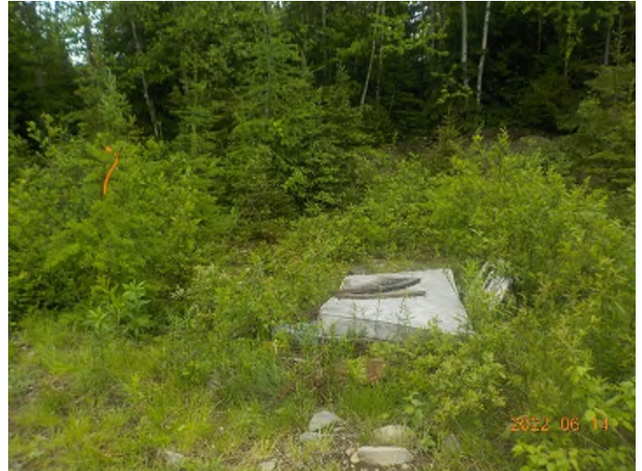
Figure 8: Emplacement des débris à ramasser du point supplémentaire B