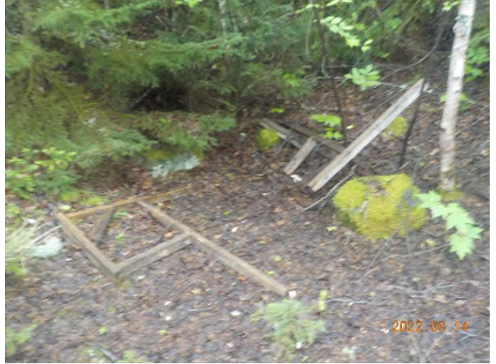
Figure 16: Débris à ramasser du point supplémentaire C