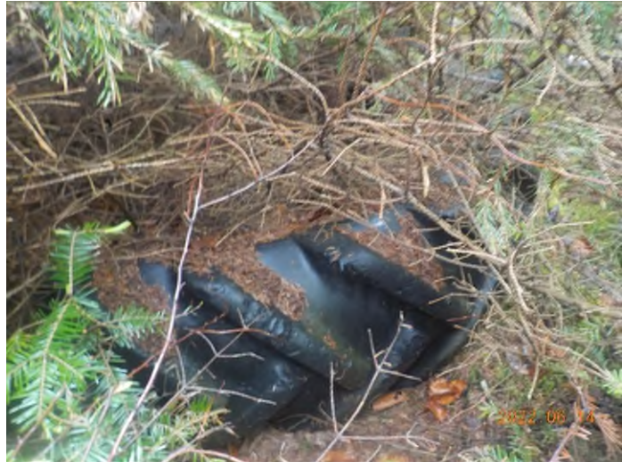
Figure 28: Débris à ramasser du point supplémentaire H