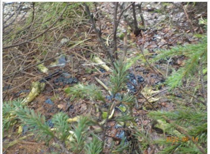
Figure 26: Débris à ramasser du point supplémentaire G