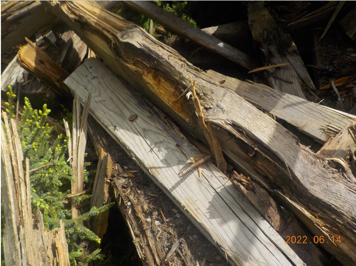
Figure 9: Débris à ramasser du point supplémentaire B