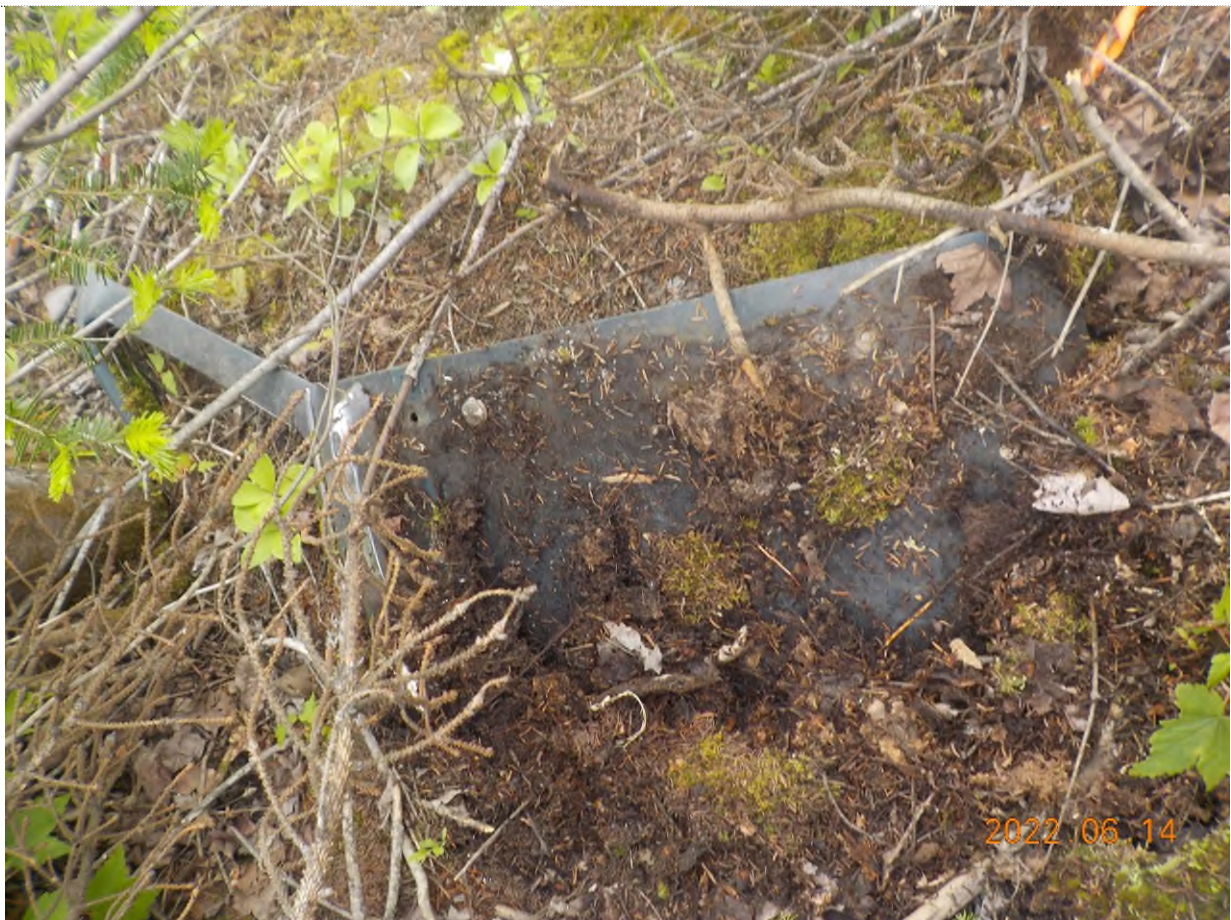
Figure 2: Débris à ramasser