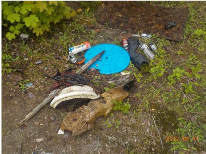
Figure 30: Débris à ramasser au point supplémentaire D