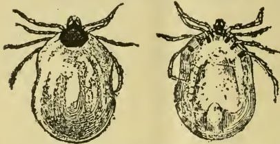
Ixodes ricinus Lat., femelle. (Face dorsale et face ventrale.)

Nous donnons ici le dessin de l' Ixodes redivivus L. ( ricinus Lat.) ♀, dont notre spécimen se rapproche assez, afin que le