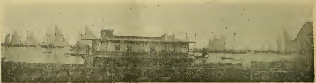
Station de biologie maritime du Canada (1)

des pêcheries du Canada. La photographie ci-jointe, de M.C.-M. Fraser, fait voir la position qu'occupe actuellement la Station, le fond du tableau se composant de goélettes de pêche venant, pour la plupart, de Lunenburg et de Gloucester.