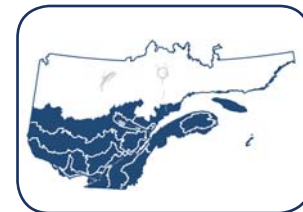
Territoires où les résultats s'appliquent.

Mais pourquoi ne pas laisser faire la nature?