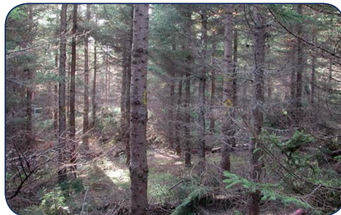
Plantation d'épinette noire de 23 ans dans laquelle 400 tiges à l'hectare ont été élaguées à Chandler, Gaspésie.

La persistance des branches mortes sur le tronc occasionne la formation de nœuds secs, lesquels sont plus enclins à se détacher et à détériorer les propriétés mécaniques du bois que les nœuds formés par des branches vivantes. Le temps nécessaire