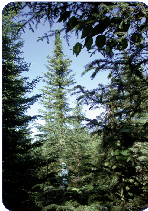
Arbre sélectionné dans un test de descendance d'épinette noire âgé de 17 ans près de Mont Laurier.

plantations expérimentales, établies dans tous les domaines bioclimatiques du Québec forestier. Les meilleurs individus servent ensuite à la production de plants de reboisement et