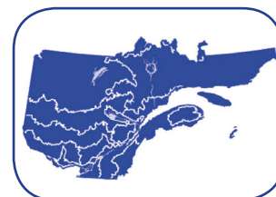
Territoires où les résultats s'appliquent.

évalue dans quelques centaines de dispositifs expérimentaux. Une aussi vaste base de matériel biologique assure une bonne représentativité de la diversité génétique des espèces et la possibilité d'exploiter au mieux