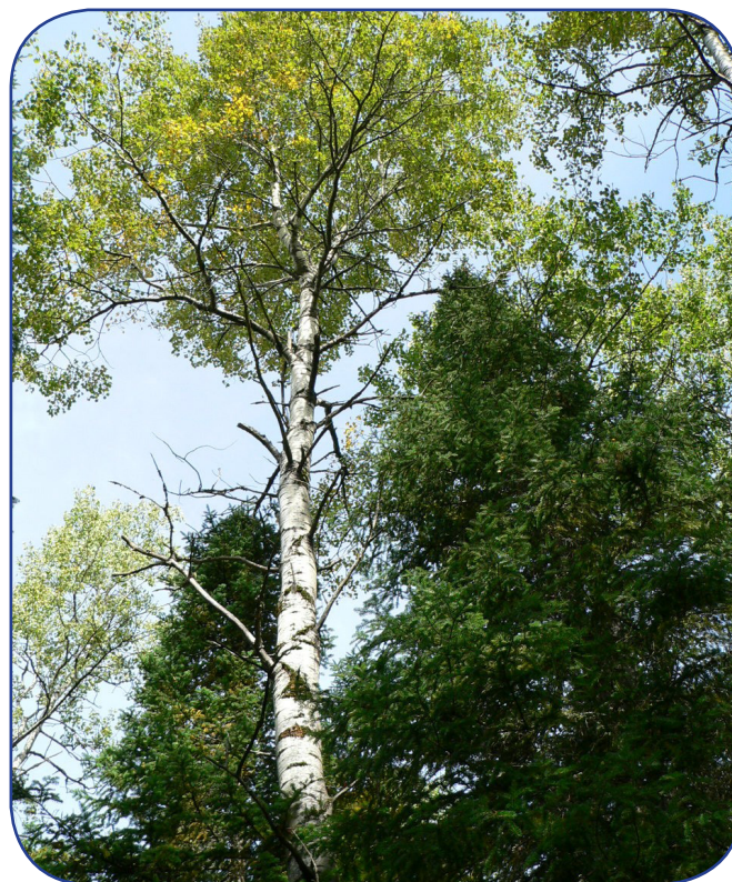
L'étude a été réalisée dans un peuplement dominé par le tremble, accompagné de sapin et d'épinettes.