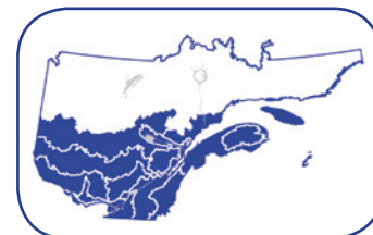
Territoires où les résultats s'appliquent.

Une production de plants à partir des graines issues de clones somatiques a été réalisée à la pépinière de Saint-Modeste.