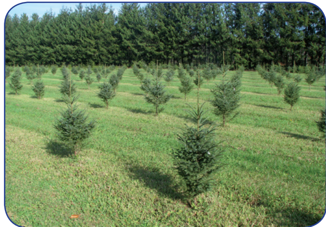
Figure 3. Vue de la plantation réalisée à Duchesnay avec les plants produits à partir des graines issues des variétés somatiques, après quatre années de croissance.

que des variétés somatiques d'élite puissent être intégrées dans les populations sélectionnées par les programmes d'amélioration génétique pour la production de semences dans les vergers à graines ou dans le cadre de croisements dirigés (Figure 4). Ceci permettra ainsi un accroissement plus rapide des gains génétiques globaux dans les futures générations tout en certifiant une grande diversité génétique. Le Québec, qui figure déjà dans le peloton de tête dans le domaine de l'intégration de l'embryogenèse somatique à l'échelle opérationnelle, va pouvoir capitaliser sur cette avancée et augmenter encore plus rapidement la livraison de matériel génétique d'élite pour son programme de reboisement pour le plus grand bénéfice de la productivité de la forêt québécoise.