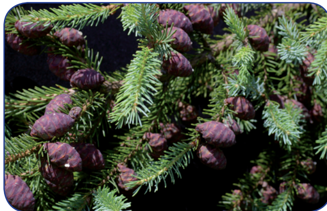
Figure 1. Cônes d'épinette noire produits par la variété somatique M237. La forme et la position des cônes sont similaires à celles observées sur un arbre de la forêt naturelle ou de verger à graines issu de greffes.

L'objectif est de vérifier que ces graines vont pouvoir donner naissance à des plants de fortes dimensions d'excellente qualité morpho-physiologique qui pourraient être utilisés en plantation (Figure 2). Après 2 ans de croissance en pépinière, il appert que les plants issus de ces semences somatiques présentent des caractéristiques normales pour la croissance, l'architecture des parties aériennes et la nutrition minérale, et qu'ils se qualifient selon les normes en vigueur établies pour des plants issus de graines produites dans des vergers ou en forêt naturelle.