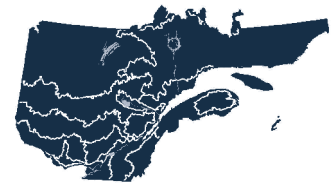
Territoires où les résultats s'appliquent.