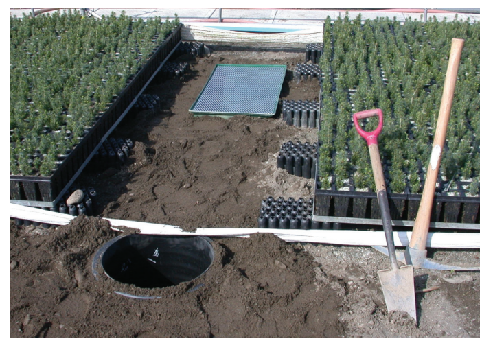
Figure 1. Capteur de lessivat avec puits de récupération sous une culture d'épinette blanche 2+0 en récipients.

Depuis 12 ans, les capteurs de lessivat (Figure 1) installés sous des plants de fortes dimensions (PFD) d'épinette blanche 2+0 en récipients ont montré que les nitrates ( \text{NO}_3 ) sont les minéraux les plus lessivés. Viennent ensuite, par ordre décroissant, le potassium (K), l'ammonium ( \text{NH}_4 ), le phosphore (P), le magnésium (Mg) et le calcium (Ca). L'enregistrement en temps réel des données météorologiques et des teneurs en eau volumétriques du substrat a permis de distinguer les effets de la pluie et de l'irrigation sur le lessivage des minéraux. Par ailleurs, un capteur de solution fertilisante a mesuré le taux d'efficacité des fertilisations appliquées et démontré qu'il varie selon le mode d'application : 95 % avec un robot, contre 80 % avec un tracteur.