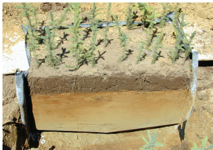
Figure 3. Case lysimétrique composée d'un monolithe reposant sur une plaque en acier inoxydable, sous une culture d'épinette blanche à racines nues.

Nos résultats confirment que les nitrates ( \text{NO}_3 ) sont aussi les minéraux les plus lessivés sous les cultures à racines nues, suivis