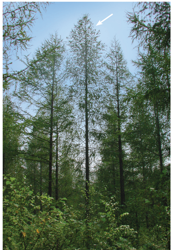
Mélèze d'Europe âgé de 30 ans et sélectionné comme arbre semencier.

Pour former la population de production, chacun de ces 40 arbres semenciers a été reproduit à près d'une centaine d'exemplaires, par greffage. Ces arbres sont cultivés dans un verger à graines sous abri, et devraient produire des semences améliorées de la variété « MEH 20-20 » environ jusqu'en 2033.