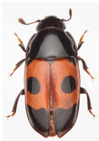
Figure 3. Glishrochilus s. sanguinolentus , un coléoptère associé aux forêts résineuses matures.

Ce projet nous a permis de capturer des individus de 584 espèces différentes, soit 420 espèces de coléoptères et 164 espèces d'araignées. Parmi celles-ci, 41 coléoptères et 25 araignées montraient des préférences significatives pour certains types d'habitats. Les individus ont pu être divisés en 2 grandes catégories : les espèces pionnières associées à la coupe, et celles associées aux forêts matures. La majorité de ces dernières se retrouvaient dans des forêts résiduelles de toutes tailles (Figure 2; figure 3). Toutefois, quelques espèces associées aux forêts matures étaient moins abondantes dans les plus petits fragments que dans les gros (Tableau 1).