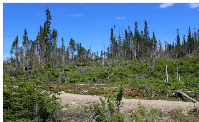
Figure 2. Forêts résiduelles dans une coupe totale avec rétention de bouquets (0,05 ha en moyenne).