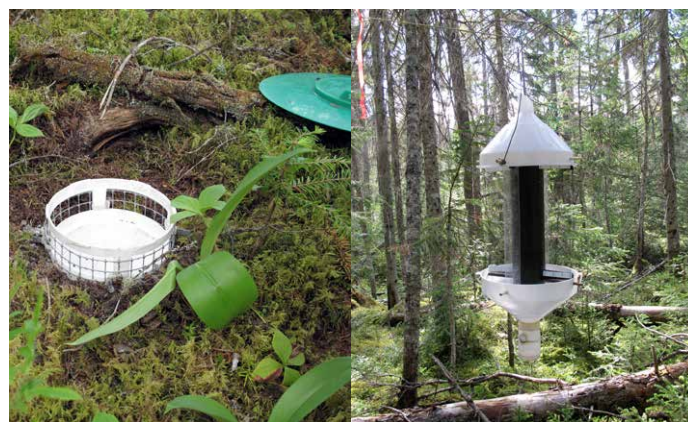
Figure 1. Piège fosse et piège à impact utilisés lors du projet.

Des pièges fosse et des pièges à impact (Figure 1) ont été utilisés pour échantillonner les arthropodes. Ces pièges ont été placés dans 5 agglomérations de coupes réalisées 2 à 5 ans auparavant dans le domaine bioclimatique de la pessière à mousses, plus précisément dans les régions du Saguenay-Lac-Saint-Jean et de la Côte-Nord. Dans chaque agglomération de coupe, nous avons échantillonné des forêts résiduelles de différentes tailles, la coupe adjacente et les massifs forestiers adjacents.