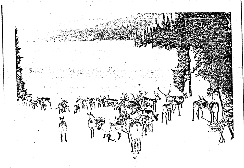
Figure III Troupeau du lac Turgeon, 11 janvier 1974