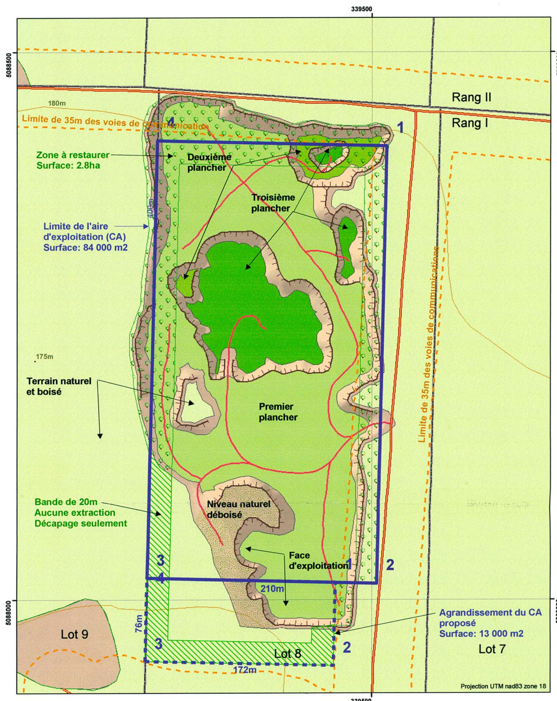
Détails de la gravière